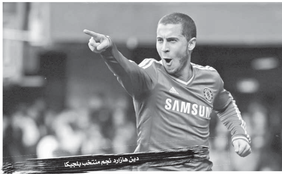
دين هازارد نجم منتخب بلجيكا