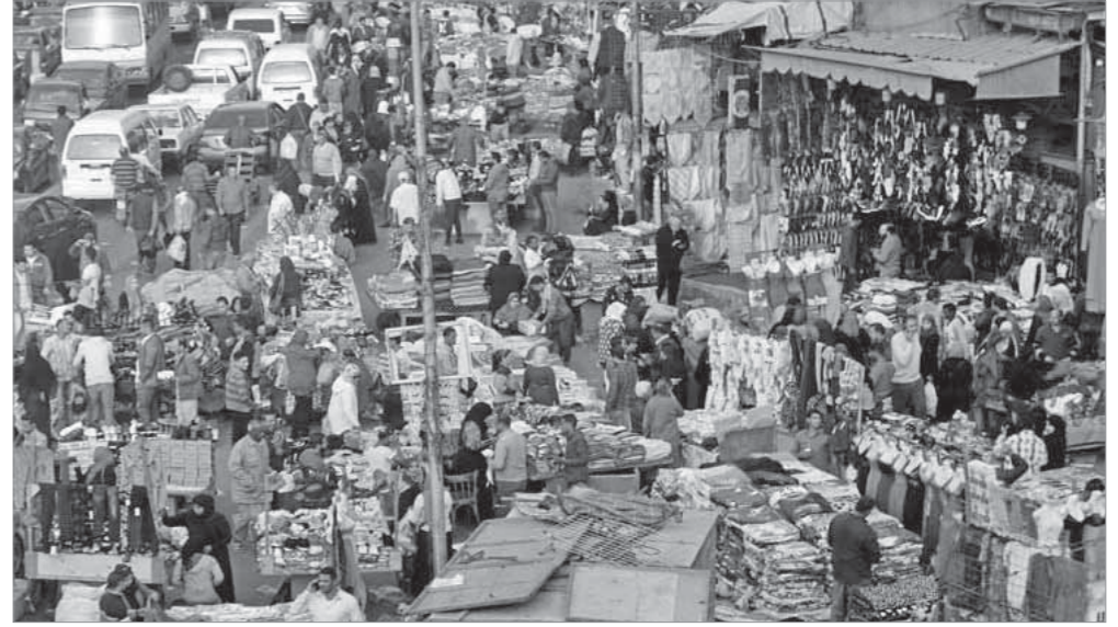
منتجات بئر السلم تنتشر في أسواق العتبة والموسكى وتعطى يقبول عدد كبير من المواطنين