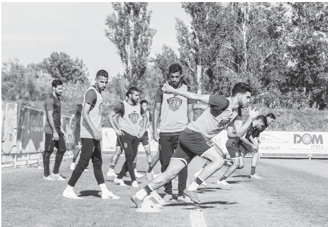
جديدة في معسكر الأهلي في كرواتيا

الأهرام إلى نصف مليار جنيه ليتساوى مع عرض صلة. وتلوح في الأفق أزمة جديدة بين الأهلي وصلة بعد أن هددت الشركة السعودية بتحريك دعوى قضائية ضد النادي للمطالبة بـ 28 مليون جنيه قيمة الغرامات في عقد الرعاية الحالي وليس الجديد الذي لم يتم تصفيه وهو ما أكدته مصادر داخل الشركة السعودية.