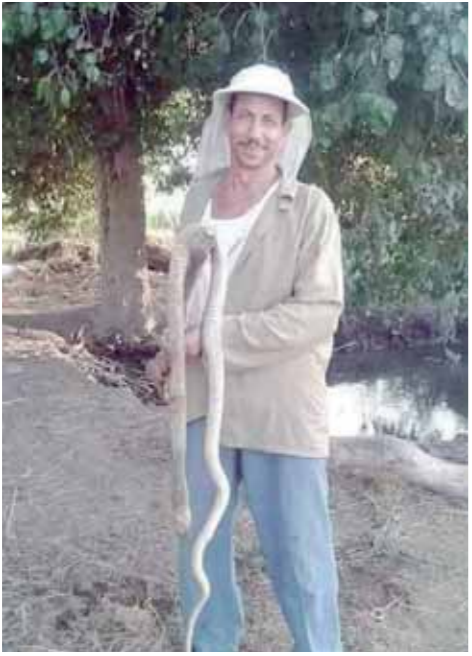
اللجان الشعبية بالمحمودية تواجه الثعابين

بعد فشل خطة البيض المسموم التي لجأت محافظة البحيرة إليها في مواجهة الثعابين التي تهاجم قرى المحافظة، واضطر أهالي المحمودية لتشكيل لجان شعبية لمواجهة الهجوم الذي بات يهدد حياتهم. بدأت لجان شباب القرى المنكوبة في مطاردة الثعابين في المزارع وقتها.