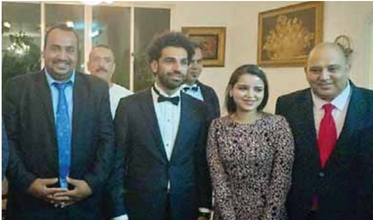
محمد صلاح يشهد حفل خطوبة شقيقه

التدريبات، من جانبه أكد المهندس ماهر شتيه عمدة قرية نرجيح مسقط رأس صلاح أن النجم المصري أصبح يعاني من ضريبة الشهرة، حيث إنه لم يتمكن من حضور حفل خطوبة شقيقه بالشكل الطبيعي بالرغم من اقتضار الدعوات على الأهل والأصدقاء وبعض أهالي قرية نرجيح.