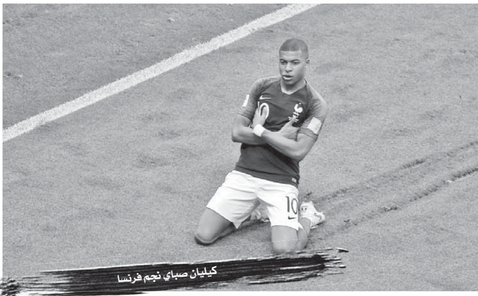
كيليان صباي نجم فرنسا