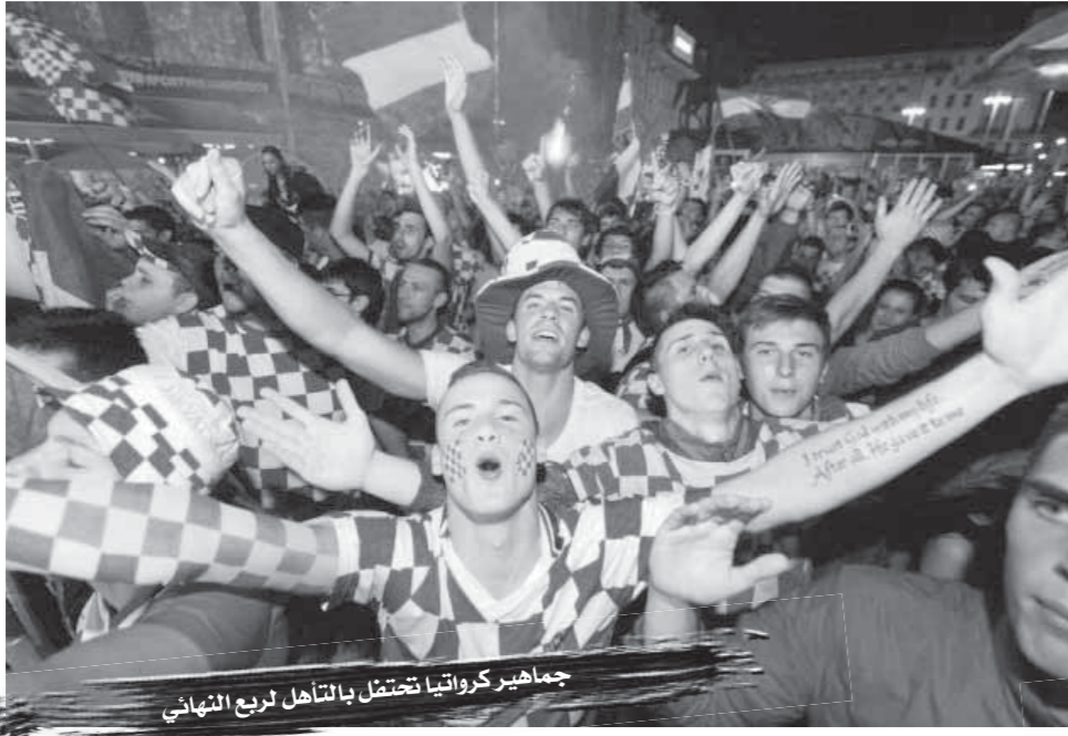
جماهير كرواتيا تحتفل بالتأهل لربع النهائي