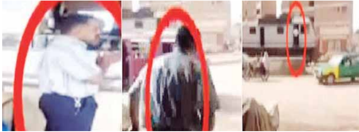
فضيحة سائق «الساندوتش»، بقطار منوف

أصدر د. هشام عرفات وزير النقل تعليماته للمهندس سيد سالم رئيس هيئة السكة الحديد بوقف سائق قطار منوف الذى أوقف القطار مدة 25 دقيقة لشراء ساندوتشات فول وطعمية، وانتشر الفيديو على مواقع التواصل الاجتماعى بالواقعة. وتم تحويل السائق للشئون القانونية للتحقيق معه، وأكد الوزير أنه لا تهاون مع المقصرين بأى حال من الأحوال، ولم تكن هذه الواقعة هى الأولى من نوعها فى مسلسل مهازل السكة الحديد.. فقد سبقها عدة وقائع مماثلة، فمنذ عدة