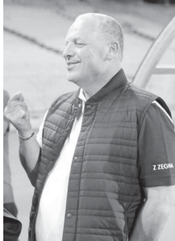
المنتخب ضحية اتحاد الكرة