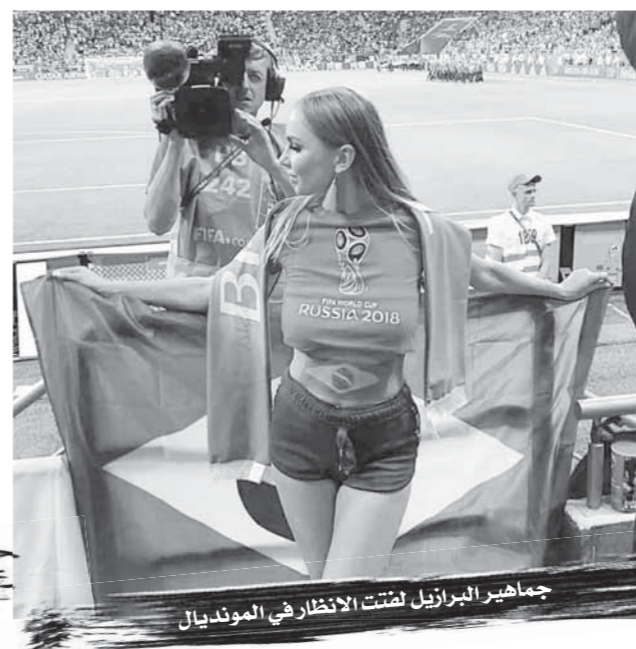
جماهير البرازيل لفتت الانتظار في المونديال