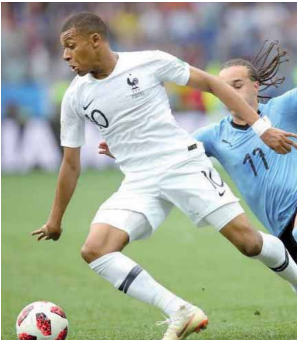
كيليان مبابي نجم فرنسا