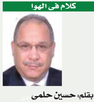
بقلم: حسين حلمي