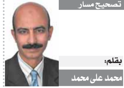
بقلم: محمد محمد

لاشك أن هناك ترمص واضح للعيان من مؤسسات الدولة العميقة التي تخشى من انتقام «الكوت دي مونت ترامب» التي سينسف كل مكتسباتها السياسية وستكون ولاية القادمة نقطة تحول كبيرة في تاريخ بلاد العم سام فليس هناك ما يمكنه بعداً تم إهائته وتشويه سمعته للإيد كأول رئيس أمريكي رد سجون.