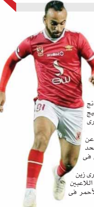
بقلم: محمد الاهنوي