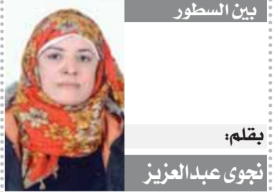
بقلم: نجوى عبدالعزيز