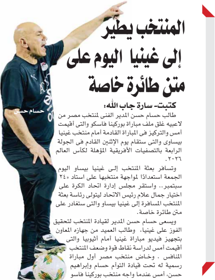
بقلم: حسام حسنى