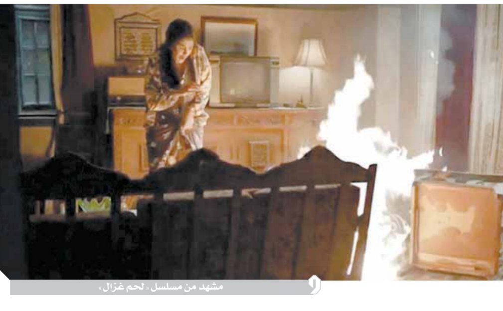
مشهد من مسلسل لحم غزال