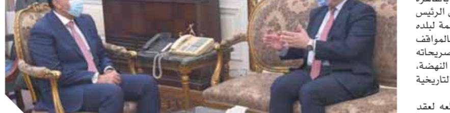
د. مصطفى مدبولي خلال استقباله محمد بن يوسف سفير تونس في القاهرة

كتب. عبد الرحيم أبوشامة: أكد الدكتور مصطفى مدبولي رئيس مجلس الوزراء، خلال لقائه السفير التونسي بالقاهرة محمد بن يوسف سعادة مصر باستقبال الرئيس التونسي قيس سعيد خلال زيارته المهمة لبلده الثاني مصر منذ أسابيع، مشيداً بالمواقف العروبية والقومية للرئيس التونسي، وتصريحاته الداعمة لموقف مصر في ملف سد النهضة، والتي تأتي امتداداً للعلاقات الأخوية التاريخية التي تربط مصر وتونس. وأعرب رئيس الوزراء عن تطلعه لعقد اجتماعات اللجنة العليا المشتركة بين مصر وتونس في أقرب فرصة ممكنة، من أجل تفعيل التعاون في كل المجالات التي تخدم البلدين. وأكد سفير تونس أن مصلحة بلاده أن تكون مصر قوية، وقال إن ما تشهده مصر من إنجازات حالياً هو محل فخر للعرب، حيث صارت مصر نموذجاً يحتذى في التنمية والعمران، مشيداً برؤية الرئيس عبدالفتاح السيسي، وقيادته المتميزة لجهود التنمية في مصر. وصرح المستشار نادر سعد، المتحدث