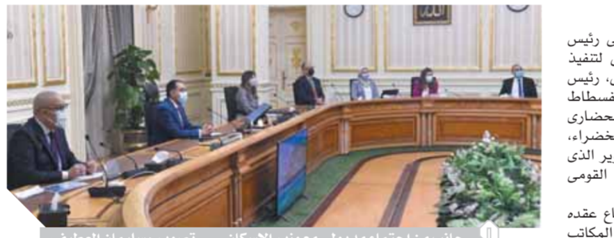
جانب من اجتماع مدبولي مع وزير الإسكان

كتب. عبد الرحيم أبوشامة: أكد الدكتور مصطفى مدبولي رئيس مجلس الوزراء، أن الحكومة تسعى لتنفيذ توجيهات الرئيس عبدالفتاح السيسي، رئيس الجمهورية، بشأن تطوير منطقة الفسطاط في مصر القديمة، لاستعادة الوجه الحضارى للمنطقة وزيادة نسبة المسطحات الخضراء، ولتكمال على نحو نموذجي مع التطوير الذي تم بحيرة عين الصيرة والمتحف القومي للحضارة المصرية. أشار رئيس الوزراء خلال اجتماع عقده مع وزير الإسكان ومسئولى أحد المكاتب الاستشارية الهندسية الدولية لاستعراض التصميمات المقترحة لتطوير المنطقة، إلى أهمية إنشاء حديقة مركزية للقاهرة بمنطقة الفسطاط التي تمتد بموقع جغرافى في قلب القاهرة، ومكانة تاريخية فريدة لقرتها من مجمع الأديان والحضارات، مشيراً إلى أن إنشاء هذه الحديقة سيحقق تنمية مستدامة للمنطقة، وسيوفر منتزها للأسر المصرية، وواجهة سياحية مفتوحة للاطلاع على جمال القاهرة التاريخية. وخلال الاجتماع، استعرض ممثلو المكتب الاستشارى تصورهم المقترح لمخطط إنشاء