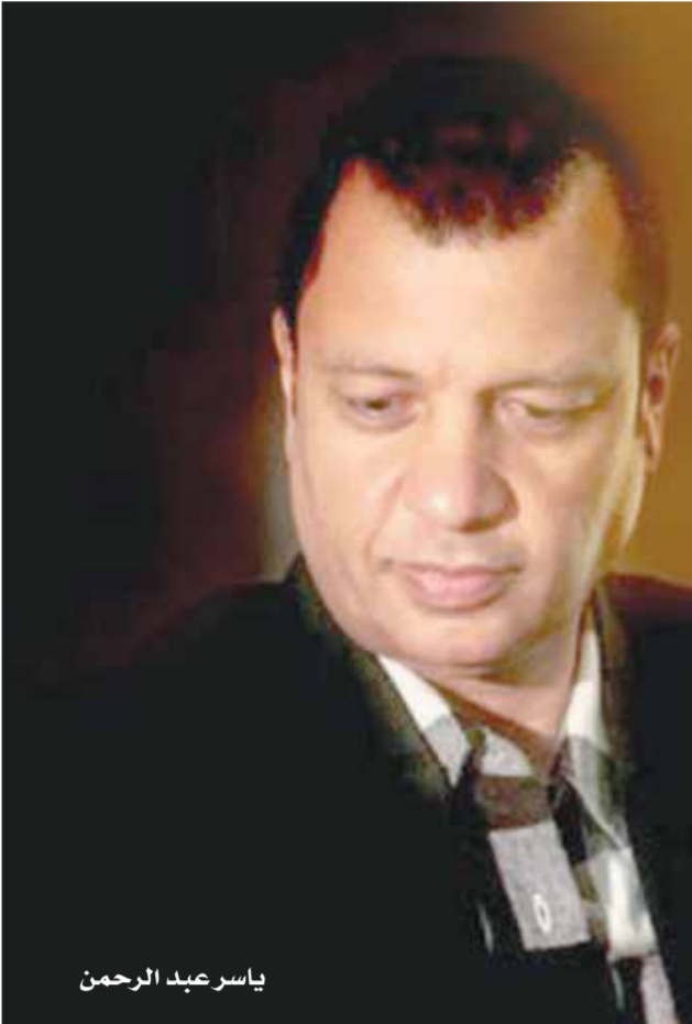
ياسر عبد الرحمن

الإمبراطور عاد وأعاد للموسيقى التصويرية بريقها ورونقها وأهميتها... كالعادة أجاد وتفوق وحسم الأمر من أول جولة... دائماً هو مصدر الدهشة والإبهار بما يقدم... موسيقاه ترجمة حقيقية للمشاعر والأحاسيس التي يعيها الممثل، في أحيان كثيرة يتفوق على الحوار المكتوب وأحياناً أخرى يدخل مع الممثل في منافسة تنتهي لصالحه حتى لو ان الممثل متمكن من أدواته، لذلك ناضت موسيقاه كل الأسماء التي تعامل معها على الشاشة سينما ودراما الشاشية الصغيرة.