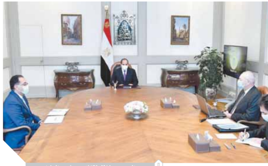
السيسي خلال لقائه مع رئيس الوزراء

الاقتصادية لقناة السويس، والجهود القائمة لتعزيز العوائد الاستثمارية للهيئة من خلال التواصل مع الشركاء الأجانب بشأن المناطق الصناعية المختلفة المزمع إقامتها في المنطقة. كما عرض رئيس الهيئة العامة للمنطقة الاقتصادية لقناة السويس في ذات السياق مستجدات التطوير الجاري بميناء العين السخنة والعريش، خاصة بالنسبة للاستخدامات والساحات والصوامع والمخازن والأرصنة البحرية، فضلاً عن استعراض الجهود القائمة لتوسعة محطة تداول الحاويات لشركة قناة السويس، وكذا إنشاء مركز عالمي للخدمات البحرية. كما تم استعراض المخطط التنفيذي لمنطقة شرق بورسعيد المتكاملة، والتي تضم ميناء شرق بورسعيد إلى جانب مناطق صناعية ولوجستية ومحطة متعددة الأغراض، وكذلك مخطط المنطقة الاقتصادية لقناة السويس بالتعاون مع كبرى شركات السيارات العالمية للانضمام إلى مجمع تجميع السيارات المزمع إقامته بالمنطقة الصناعية بشرق بورسعيد، الأمر الذي سيشهد منه تلك الشركات في ضوء تمديد مصر باتفاقيات دولية للتجارة الحرة مع العديد من المناطق والكيانات الإقليمية والدولية.