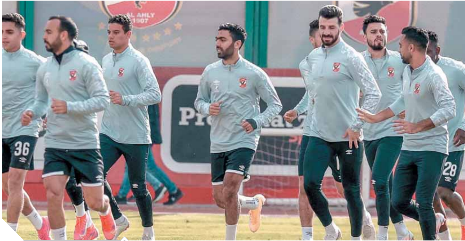
الأهلى يستعد للقاء مع مسكر مبكر