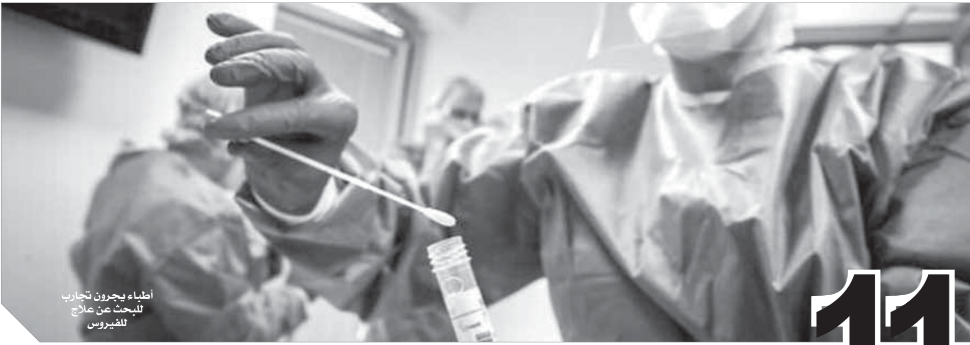
أطباء يجرون تجارب للفيروس

تتسى العديد من الشركات العالمية، للتوصل إلى أدوية فعالة لعلاج فيروس كورونا، ويعمل العلماء والخبراء والأطباء لئيل نهار من أجل الوصول للعلاج المنتظر، خاصة أن مسألة إيجاد لقاح مضاد لهذا الفيروس تمثل أمرا حيويا لأجل إنقاذ العالم من أزمة إنسانية لم تحدث منذ أجيال. وأعلنت منظمة الصحة العالمية، قبل أسابيع قليلة أن ٤٧ دولة تقوم باختبارات حول علاجات ولقاحات فيروس كورونا المستجد