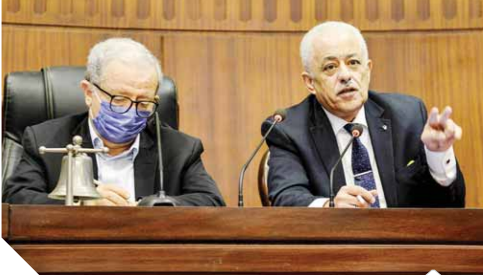
وزير التعليم خلال اجتماعه ببلدية الخطة والوزارة

تطبيق لمنظومة التعليم القديم، وأن نظام التعليم الإلكتروني نجح في القضاء على الكتب الخارجية والدروس الخصوصية، وأضاف أن التلاميذ من كى جى حتى الثالثة ابتدائي بدون تكنولوجيا، بمعنى أنهم يحسبون ويكتبون بأيديهم لأسباب تعليمية، وأكد شوقي وجود مقترحات تتم دراستها عن السيناريوهات المحتملة. خلال العام الدراسي الجديد، في ظل استمرار أزمة فيروس كورونا المستجد، وأبرزها أن يكون الأسبوع الدراسي لمدة يومين فقط، ولكن هذا النظام سيصعب تطبيقه على المرحلة الابتدائية، خاصة أن هذه الفئة العمرية تحتاج إلى تواصل مباشر بين الطالب والمعلم، وأشار شوقي إلى تساؤلات عديدة حول وضع المدارس في سبتمبر المقبل، وكيفية تعقيم الطلاب خصوصاً أن بوابة التعقيم الذاتي الواحدة تكلفها ٢٠ ألف جنيه، وقال الوزير إن المؤسسات الدولية، أكدت أن مصر هي الدولة الوحيدة التي يجري بها امتحانات في ظل أزمة جائحة فيروس كورونا المستجد، وأن دولاً مثل أمريكا وإنجلترا عجزت عن إجراء الامتحانات، مشيراً إلى أن هناك نحو مليون و٢٠٠ ألف طالب يؤدون الامتحانات من منازلهم.