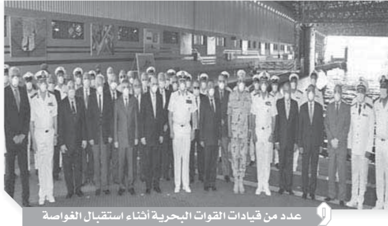
عدد من قيادات القوات البحرية أثناء استقبال الغواصة