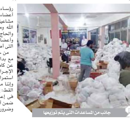
جانب من المساعدات التي يتم توزيعها