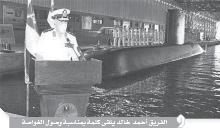
الفريق أحمد خالد يلقي كلمة بمناسبة وصول الغواصة