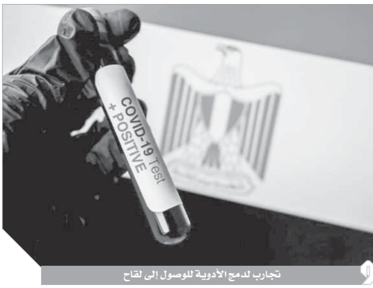
تجارب لدمج الأدوية للوصول إلى لقاح