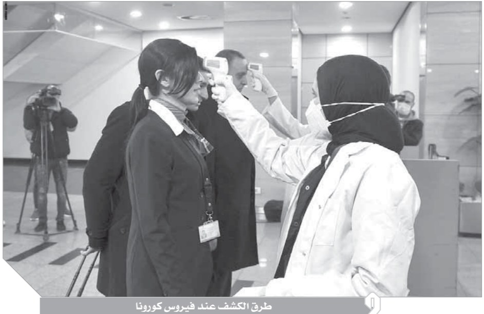
طرق الكشف عند فيروس كورونا