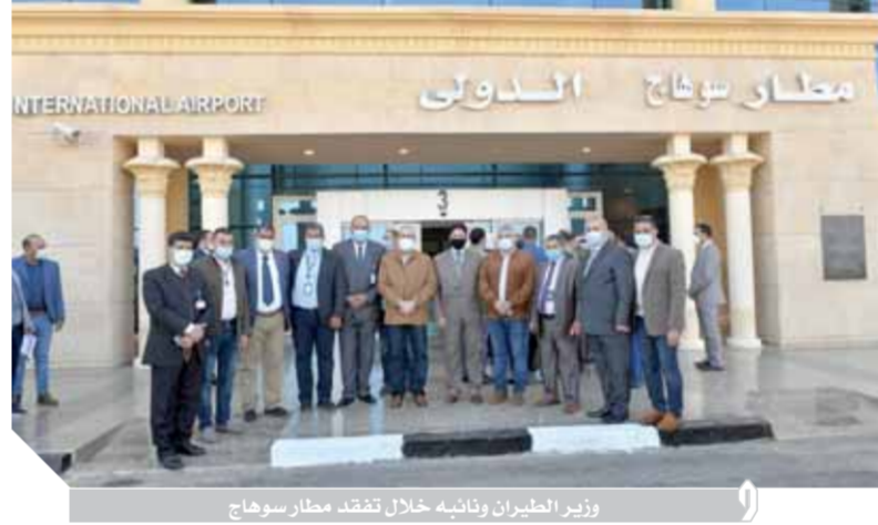
وزير الطيران ونائبه خلال تفقد مطار سوهاج

في ضوء توجهات الحكومة المصرية لتتمية مدن صعيد مصر وفي إطار الزيارات التقديمية المتتالية التي يقوم بها الطيار محمد منار وزير الطيران المدني لتتمية نظام سير العمل داخل المطارات المصرية، قام منار بجولة تقديمية لمطار سوهاج الدولي وذلك بعد زيارته لمطار الأقصر الدولي، رافقه الطيار مناصر مناع نائب وزير الطيران المدني وكان في استقباله الطيار عادل المحجوب رئيس مجلس إدارة الشركة المصرية للمطارات والطيار هشام محمود فريد مدير مطار سوهاج الدولي. وفي بداية الزيارة قام الطيار محمد منار بتسليم شهادة الاعتماد الصحي للسفر ACM الممنوحة من مجلس المطارات الدولي ICAO إلى مدير مطار سوهاج ليصبح مطار سوهاج الدولي ثامن المطارات المصرية حصولاً على هذه الشهادة، وذلك بحضور عدد من أعضاء