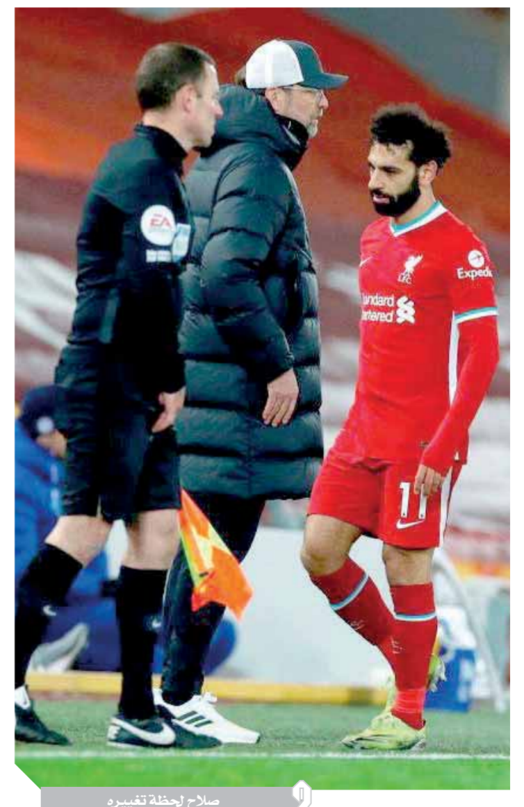
صلاح لحظة تغييره

وزاد الأمور تعقيداً التفريده التي كتبها وكيل أعماله رامى عباس عقب تبديله في لقاء تشيلسى والتي كانت عبارة عن نقطة فقط دون أى كلام، وهي تفريده خالية من أى احترازية، لأنه من غير المعقول مع كل تبديل من صلاح يخرج علينا وكيل أعماله بهذه التصرفات التي نادراً ما نشاهدها من باقى وكلاء اللاعبين. ومع ما يتردد من أنباء حول رحيل صلاح يظهر السؤال الأهم: هل من الأفضل بقاء صلاح في ليفربول أم انتقاله؟ والإجابة تبدو محيرة ولا يستطيع سوى