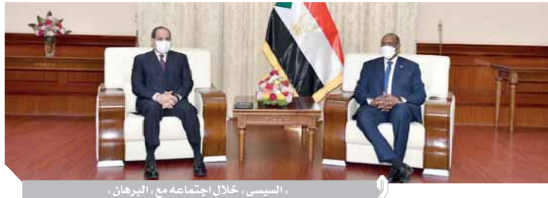
السيسى، خلال اجتماعه مع البرهان،

اتفاق مصر والسودان على رفض أى إجراءات أحادية للاستئثار بموارد النيل الأزرق التوافق على أن ملف سد النهضة يتطلب أعلى درجات التنسيق بين البلدين