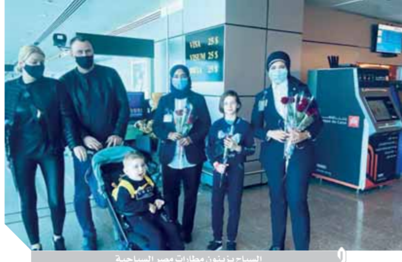
السياح يزورون مطارات مصر السياحية

وسوهاج... وتهدف المبادرة إلى تخفيض أسعار الطيران الداخلي لربط المدن السياحية بمصر من خلال تنظيم رحلات من القاهرة إلى كل من الأقصر وأسوان وشرم الشيخ وطابا والغردقة ومرسى علم، ومن الإسكندرية إلى الأقصر وأسوان... وتقرر استمرار تثبيت أسعار تذاكر الطيران للمصريين