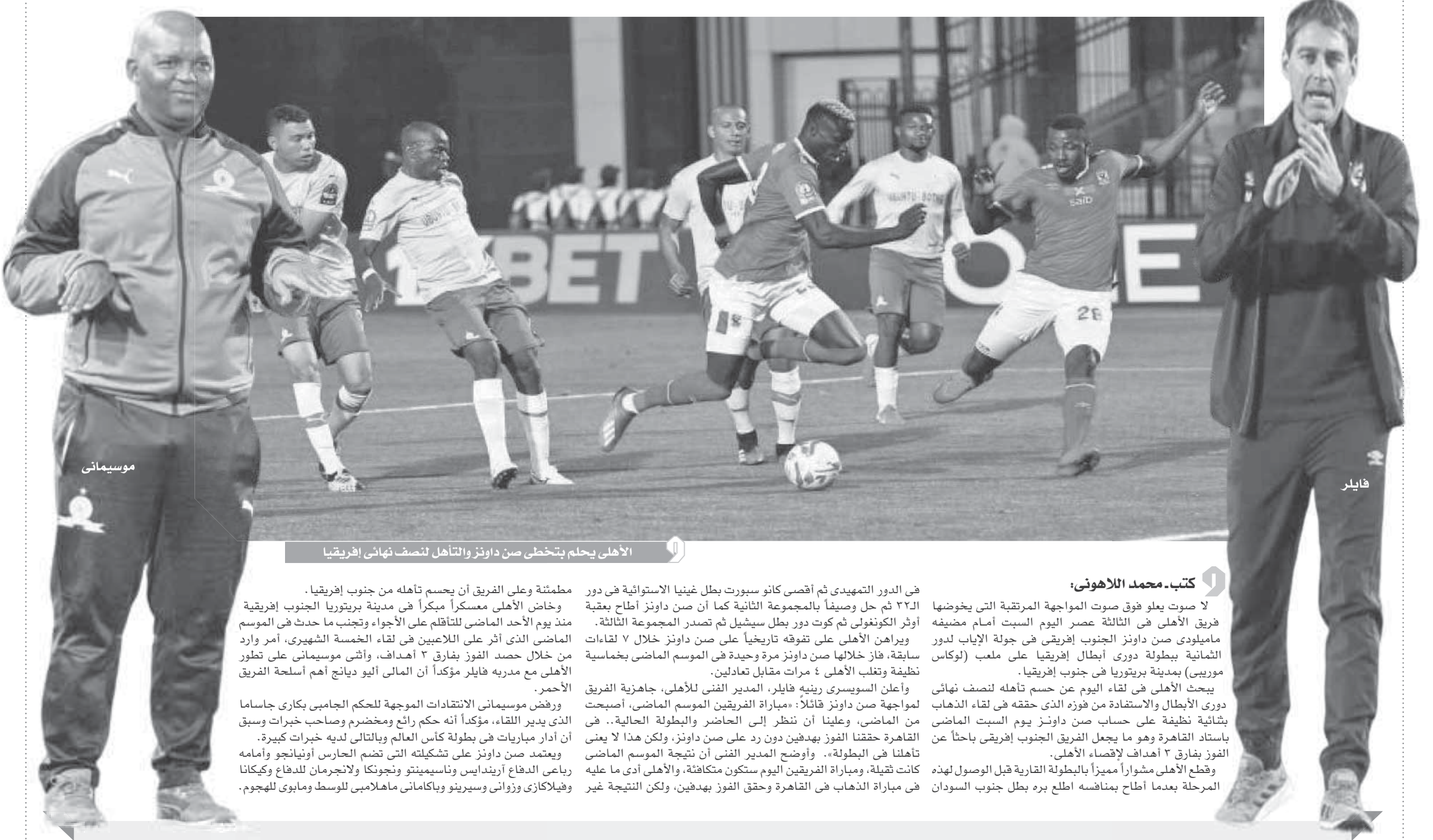
الأهلي يحلم بتخطي صن داونز والتأهل لنصف نهائي إفريقيا