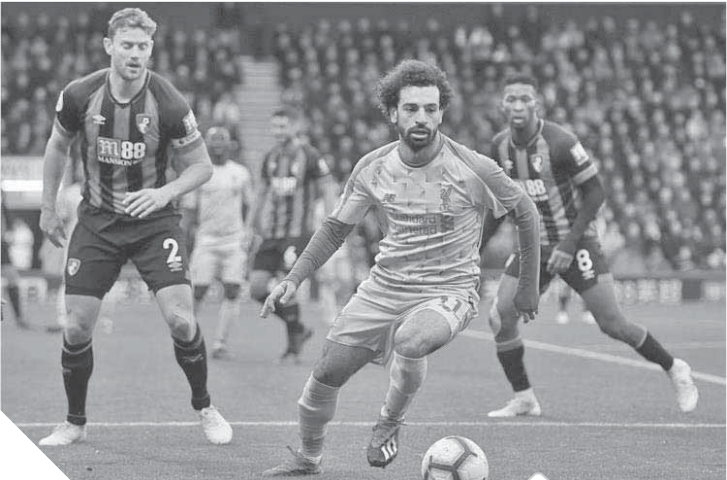
صلاح يقود ليفربول اليوم أمام بورنموث