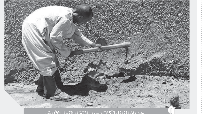
جدران المنازل تآكلت بسبب انتشار النمل الأبيض