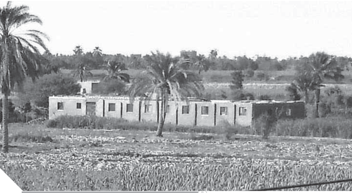
انتشار مزارع الدواجن بالقويسم وسط تجاهل المسئولين