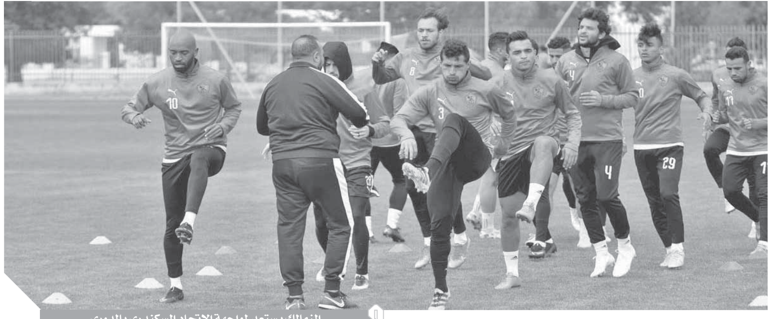
الزمالك يستعد لمواجهة الاتحاد السكندري بالدوري

تطلق اليوم السبت- مباريات الجولة التاسعة والعشرين من الدوري الإنجليزي الممتاز، ويلتقي ليفربول أمام بورنموث، في الثانية والنصف ظهراً، على ملعب «أنفيلد». يدخل ليفربول المباراة وعينه على النقاط الثلاث، بعد الهزائم المتتالية، وأخراً كانت إقصاءه من كأس الاتحاد الإنجليزي، بعد خسارته أمام تشيلسي بهدفين دون رد، والهزيمة أمام وانفورد بالدوري، وتعتبر الهزيمة الأولى للريدز بهذا الموسم بالبريميرليج. يسعى ليفربول لمصالحة جماهيره وتحقيق الفوز من أجل استعادة نغمة الانتصارات لدى الفريق، وتصبح المسار، قبل لقاء الحسم أمام أتلتيكو مدريد الإسباني، ضمن إياب دور الـ ١٦ من دوري أبطال أوروبا، بعدما خسر الريدز