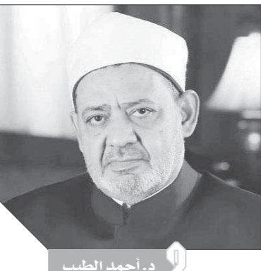
د. أحمد الطيب