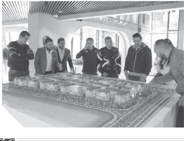
لمزيد من الأخبار والتقارير الصورة