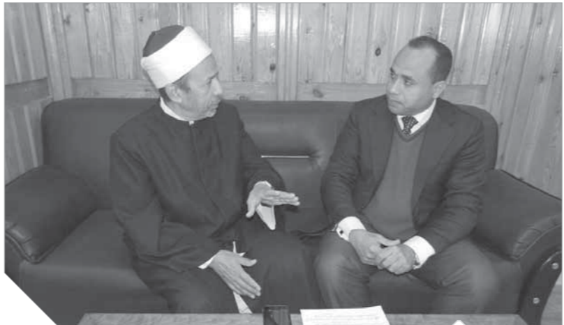
عميد كلية أصول الدين بأسبوط السابق خلال حوار مع الوفد

هناك متطلبات لذلك، أهمها أن تترك الحرية لعلماء الأزهر وكل من يعمل في حقل الدعوة الإسلامية أن يختار موضوعاً، وأن الله بإذاعة القرآن الكريم، وقد بدأت بالحدوث عن أسباب النزول وتفسير القرآن الكريم بشكل عصري، وليد مشروع آخر وهو كتابة مؤلف كامل عن علوم القرآن بعنوان «الوسيط في علوم القرآن»، أريد أن أتمه في ثمانية مجلدات، وهناك كتب أخرى أريد إخراجها للنور أيضاً مثل كتاب عن «التوسل بالنبي عليه الصلاة والسلام».