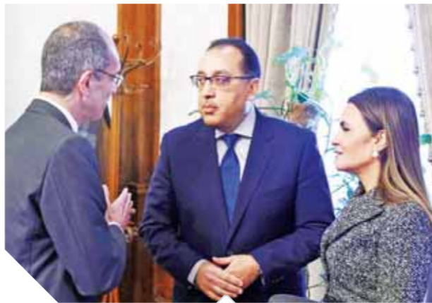
مدبولي بين نصر وطلعت

توجد لجنة مشكلة بكل وزارة لمتابعة أعمال الانتقال إلى العاصمة الإدارية كما وافقت الحكومة على فرض رسم جديد على عقود الشركات بقطاعات السكك الحديدية. المال. وكان «مدبولي» قد بدأ الاجتماع بالتأكيد على وجود تحدي كبير يواجه الحكومة في الكوادر الموجودة في قطاعات السكك الحديدية. كما أكد حاجة هذه الكوادر إلى التدريب والتأهيل، وذكر رئيس الوزراء أن الدولة أنفقت استثمارات ضخمة على البنية التحتية، مع تأكيد أهمية رفع كفاءة وتدريب العنصر البشري. كما وافق مجلس الوزراء على توصيات اللجنة الرئيسية لتنظيم بناء وترميم الكنائس المنعقدة بتاريخ 5