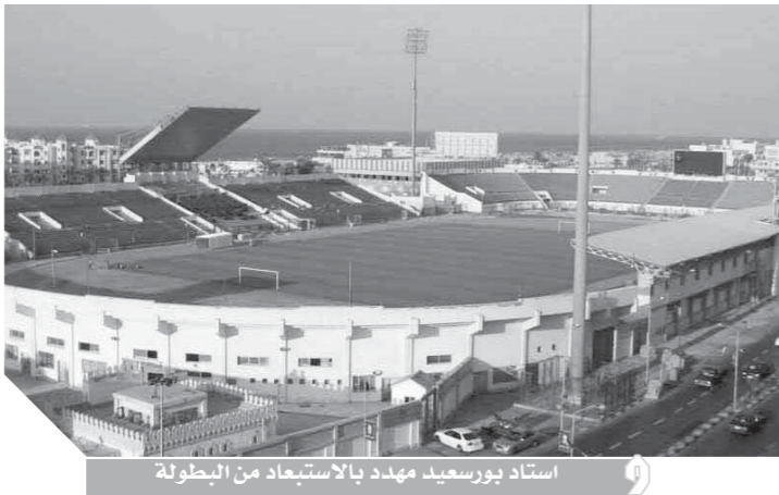
استاد بورسعيد مهدد بالاستبعاد من البطولة