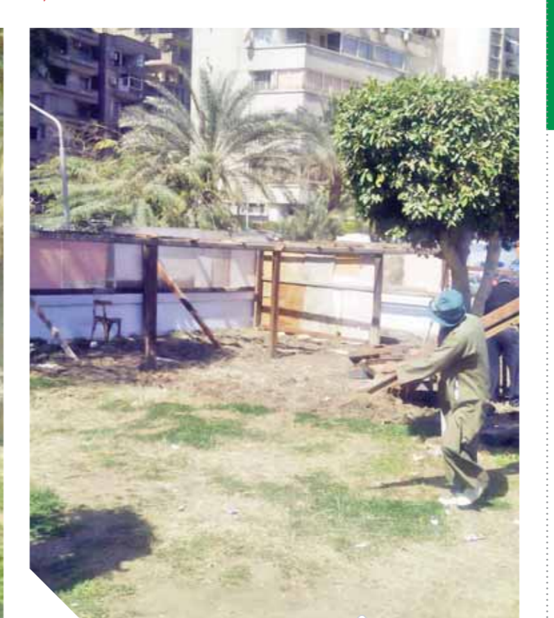
العشوائية تشوه المنطقة

في مشهد لا يليق بتلك المنطقة، وأقام بعض المواطنين الغرف العشوائية على الأرضية الزراعية بالنفق، التي تسبب في تحويل قطعة الأرض التي كانت ممتسكاً لبعض