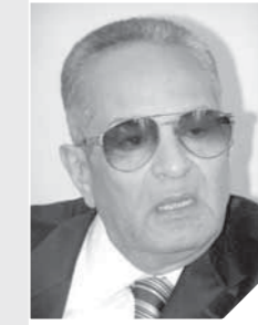
بهاء الدين أبوشقة