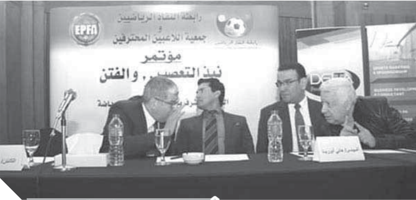
جانب من مؤتمر نبد التعصب والفتن

قائلاً: «كيف يتم الالتزام بما يسفر عنه المؤتمر وهناك طرف مهم في الأزمة غير موجود»، وأضاف أنه ليس لديه أي مانع من زيارة النادي الأهلى للأيام لأنه لا توجد مشاكل مع أحد. كما صدرت توصيات لاتحاد الكرة، بضرورة فرض حالة من الالتزام بالروح الرياضية داخل وخارج الملعب بتطبيق اللوائح وتفعيل دور لجان الانضباط والقيم والأخلاق، كذلك الاستجابة لطلبات الأندية بتطبيق تقنية الفار