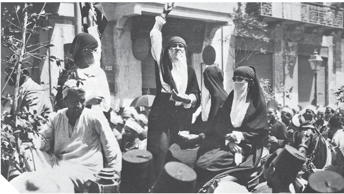
ويهتف تحيا مصر حرة، يحيا الاستقلال التام، يحيا سعد.