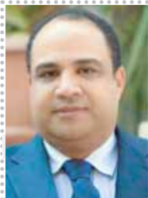
بقلم: ياسر شورى