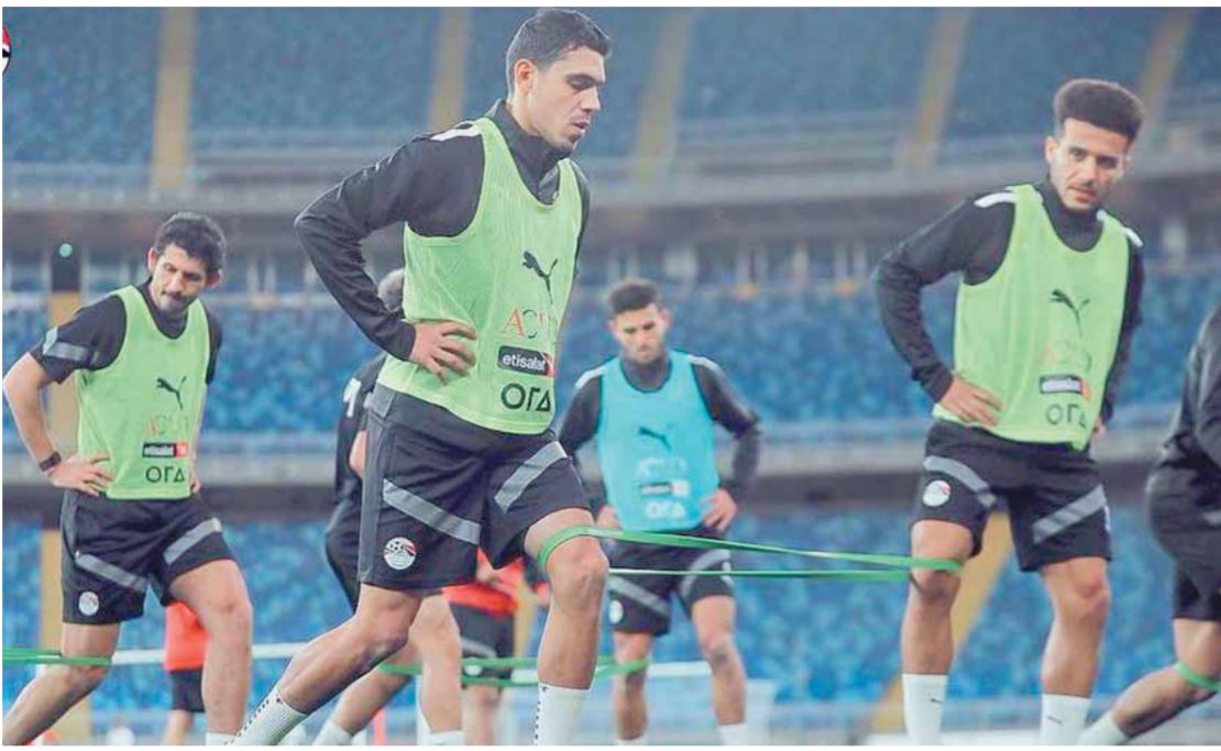
المنتخب يستعد للبطولة الأفريقية بجدية وحماس