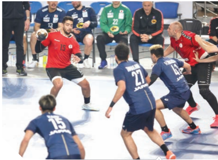
المنتخب يواجه اليابان ودياً