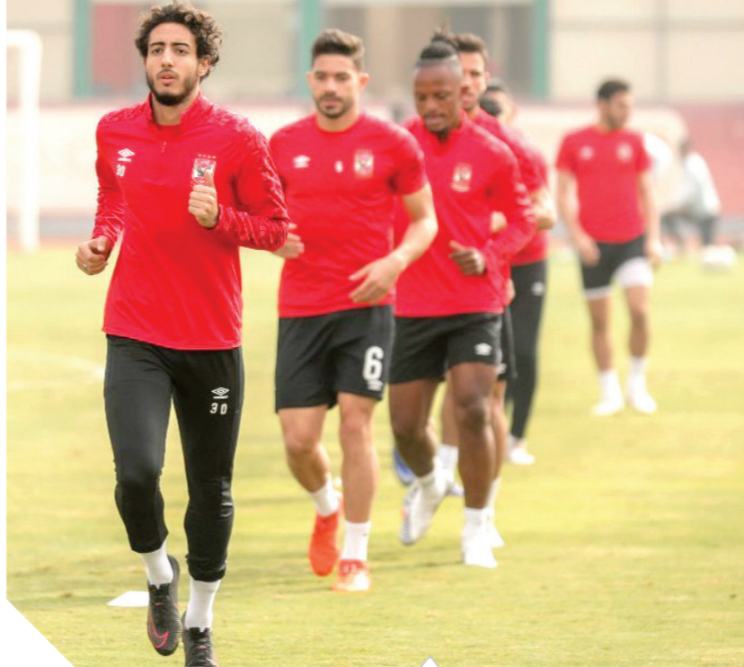
الأهلى يستعد لمواجهة سيراميكًا بقوة

وأكد موسيمانى أنه يحلم بإنجاز تاريخى فى مونديال الأندية الذى يقام فى قطر خلال الفترة