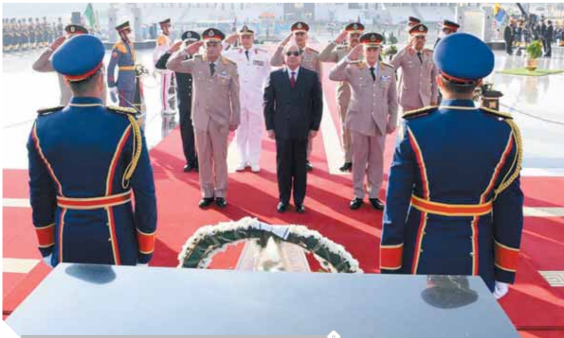
الرئيس السيسي أثناء زيارة قبر الجندي المجهول

كتب- محمد صلاح وأبو زيد كمال وسامية فاروق: