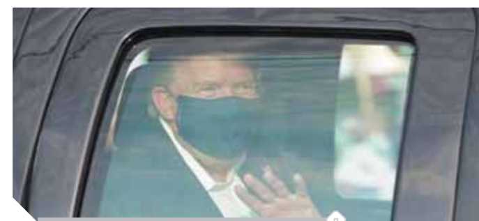
ترامب يحيى مؤيديه خارج المستشفى

العلامات على إصابته بالتهاب رئوى. وأكدت صحيفة نيويورك تايمز أن التفاصيل الطبية الصغيرة التى كشفها أطباء ترامب، وتتضمن تقلب مستويات الأوكسجين، واستخدام دواء «الستيرويد» فى العلاج، تشير إلى أن الرئيس الأمريكى يعاني أعراضاً أكثر حدة مما يعترف به أطباؤه، وفقاً لما ذكره خبراء فى الأمراض الوبائية المعدية. ونقل عن الدكتور توماس ماك جين، مدير مركز «نورث ويل» الصحى، أكبر مركز للرعاية الصحية فى ولاية نيويورك، قوله: «ديكساميثازون هو العقار الذى يمثل لغزاً حتى الآن فى طريقة علاج