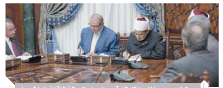
الطيب، و. سعفان - خلال التوقيع على منح العمالة المؤقتة راتباً شهرياً

وعقب المراسم ترأس الرئيس عبدالفتاح السيسي اجتماع المجلس الأعلى للقوات المسلحة، حيث قدم التهنئة للشعب المصرى