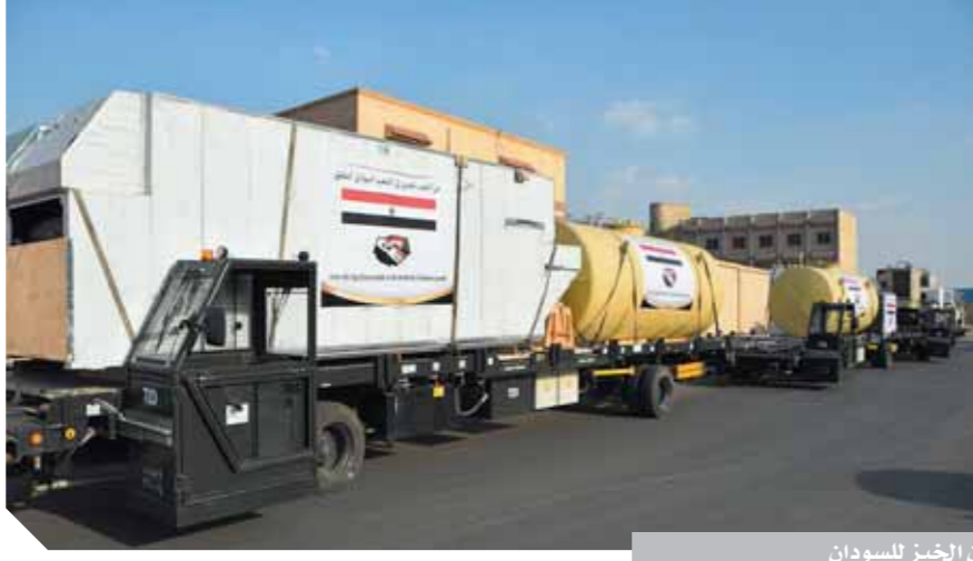
وصول أفران الخبز للسودان