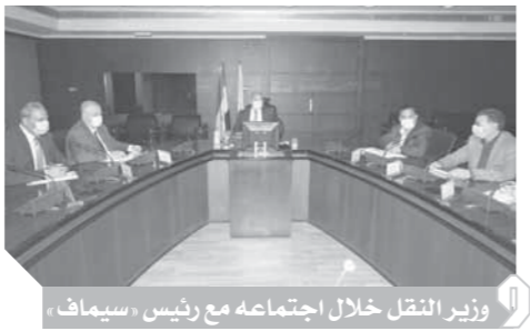
وزير النقل خلال اجتماعه مع رئيس «سيماف»

أكد المهندس كامل الوزير، وزير النقل، ضرورة الانتهاء من كل إجراءات التقييم الفنى والمالى لصفقة ٦ قطارات نوم جديدة خاصة مع احتياج هيئة السكك الحديدية لتدعيم أسطولها من هذه القطارات لتقديم أفضل خدمة للركاب، مشيراً إلى أهمية العمل على توطيئ صناعة النقل فى مصر لهذه النوعية من القطارات عن طريق التعاون مع كبريات الشركات العالمية المتخصصة فى هذا المجال. وأشار الوزير إلى أهمية البدء فى تصنيع وتوريد ٧٥ عربة نقل غلال والانتها من الإجراءات الخاصة بالبدء فى تصنيع وتوريد ١٦٠ عربة كشف قلاب، وذلك لاهتمام الوزارة بالعمل على زيادة المنقول من البضائع عبر السكك الحديدية، لتخفيف الأعباء على الطرق، وزيادة العوائد المالية لهيئة السكك الحديدية.