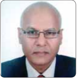
د. مصطفى عبد الرازق

استكمل في هذه السطور ما بدأتها الأسبوع الماضى فى معرض تناول ما أراه يعكس فلسفة العمران التى يمثها ويقوم على تنفيذها الدكتور مصطفى مدبولي رئيس الوزراء والتي تبلورت ملامحها خلال السنوات الماضية سواء خلال فترة توليه وزارة الإسكان أو خلال توليه رئاسة الوزراء. وهى الفلسفة التى تستهدف تغيير وجه الحياة فى مصر بمضاعفة مساحة المعمر من نحو ٧ بالمئة على ما هو عليه الآن إلى ١٤ بالمئة. ويمكن لأى مصرى أن يلمس ملامح هذا التحول من خلال حركة الإنشاءات التى لا تباغ إذا قلنا إنها حركة لم تشهد مصر على مدار تاريخها القديم أو الحديث. وإذا كانت رؤية كهذه من الصعب أن تمر دون إبادة وإشارة فى الوقت ذاته، بمعنى الإعلام بها لمن لا يعلمها، فإنها فى الوقت ذاته من الصعب أن تمر دون مناقشة على الأقل فى ضوء جوهرية التحول الذى تمته وضخامة حجم الإنفاق الذى يوجه إليها. صحيح أن كاتب هذه السطور ليس خبيراً فى التخطيط العمرانى، رغم اهتمامات بسيطة من هنا أو هناك، إلا أنه مما قد يشغل له تناول الأمر هنا أن ذلك ربما يكون دعوة للنقاش على الأقل لتوسيع نطاق الرؤية لتضيق بالغة الحيوية لا شك أن تنفيذها كما قلنا يغير وجه الحياة فى مصر تماماً.