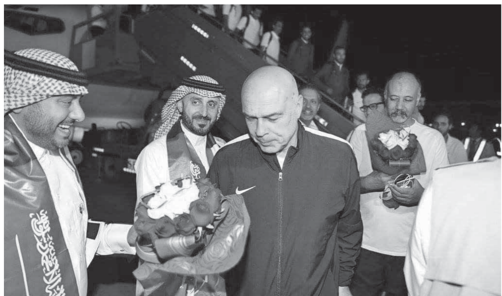
.. واستقبال جروس بالورود