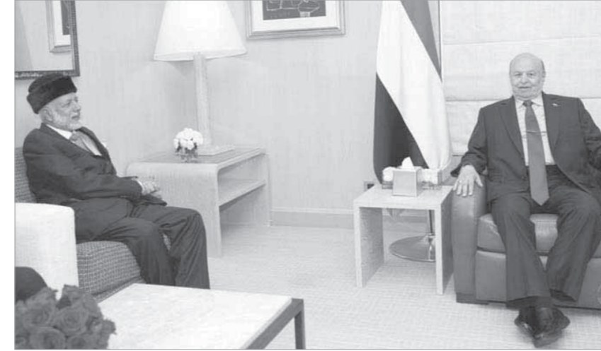
مشاورات عمانية مكثفة مع الوفود المشاركة في الاجتماعات