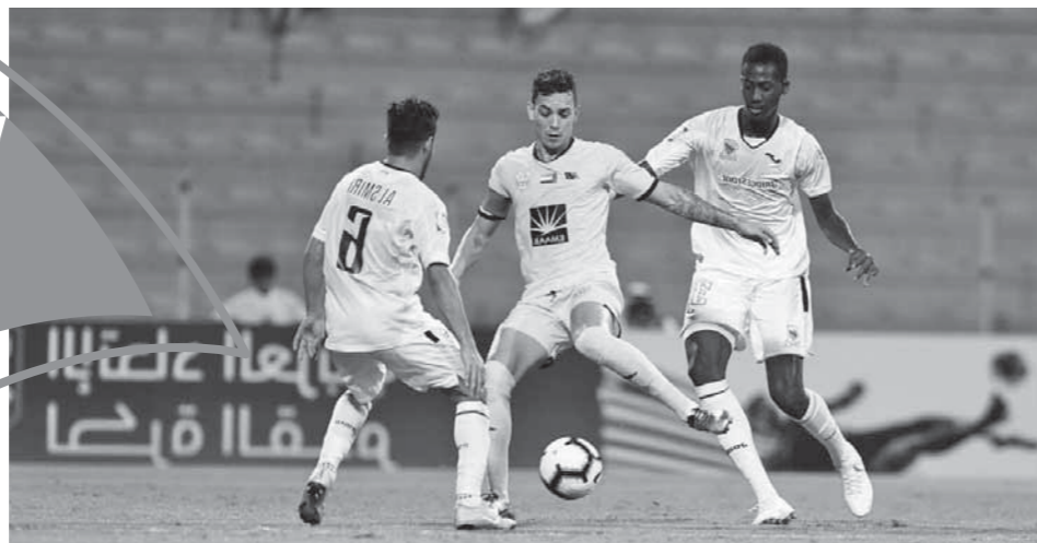
الوصول تاهل بعد تخطينه اتحاد جدة