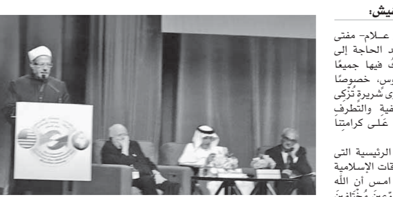
المفتى يلقى كلمته فى مؤتمر العلاقات الإسلامية الأمريكية

شُعبنا وقيادته ليمتدح بعضنا على بعض، وإن سَعِينَا هذا خَيْرٌ بَأَن يَقْدِمَ أَمْوَدَجًا مِنْ الْحَوَارِ نَخْرُجُ بِهِ مِنَ الْغَرْفِ الْمَلْفَقَةِ لِيُنْبِئَنَا جَسُونَ النَّظَاهِ وَالشَّوَالِصِ بَيْنَ الشُّعُوبِ، وَرَجَاؤُنَا لَا يَنْقَطِعُ إِلَّا يَطَّلُ حَيْسِبِ الْجِدْرَانِ، وَأَنْ يَسَاعَدَ الْحَوَارِ عَامَةً النَّاسِ فِي فَهْمِ الْحِكْمَةِ الْإِلَهِيَّةِ مِنَ التَّنَوُّعِ الدِّينِيِّ قِيَادَةً عُمَاةَ الشَّرِّ فِي الْعَالَمِ، وأكد مفتى الجمهورية فى كلمته أن مسئوليتنا أن نهئى لهذه الأجيال الجديدة الفرصة لبناء مستقبل ينعم فيه الجميع بالأمن والسلام والاستقرار. وقال مفتى الجمهورية: لقد خَرَصَتْ دَائِرُ الْإِفْتَاءِ الْمَصْرِيَّةِ عَلَى تَرْجَمَةِ هَذِهِ الْقِيَمِ، فى قَهَائِلَاتِهَا، وَقَهَائِلَاتِهَا، وَبِيَانَاتِهَا، وَمِيَانَاتِهَا، وَمُؤْتَمَرَاتِهَا الْعَالَمِيَّةِ الْمُجْتَمِعَةِ، مشددا على ضرورة أن تُسَعِّحَ لَهَا مناهج التعليم وتبنيها كل أسرة، بل تبنيها المجتمع بأسره بكل مؤسساته الحكومية والدينية والتنوع الثقافى. وأوضح فضيلة وقال فضيلة المفتى أننا مسئولون مسؤولية كاملة عن تأمين مستقبل مُشْرَقٍ بالأمل لأجيال قادمة ليس لها أي تذبذب فى النزاعات والحروب التى شهدتها البشرية عبر وجل، فقد خلقنا سبحانه وتعالى