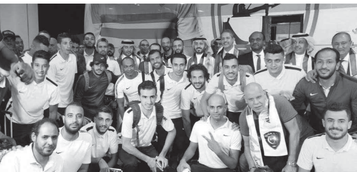
مستولو الهلال يحتفلون ببعثة الزمالك