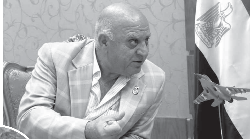
اللواء يسرى عمارة

وفي هذه الأيام المجيدة، واحتفال الشعب المصرى العظيم بذكرى انتصار السادس من أكتوبر، ذكرى الانتقام واسترداد الأرض، والكرامة، نتجيب الفرس لإلقاء الضوء على أهم بطولات رجال الجيش المصرى العظيم، الذين حضروا أسماهم من نور في سجلات البطولة والفداء من أجل الوطن الغالى، ومن هؤلاء الأبطال اللواء يسرى عمارة البطل المصرى الذى أسر عساف ياجورى قائد اللواء الإسرائيلى 190 مدرع، ويؤكد «عمارة» أنه خاض حرب أكتوبر برتبة تقىب قائداً للسرية المضادة للدبابات تحت قيادة العميد حسن أبوسعدة، وفي صباح يوم 8 أكتوبر ثالث أيام القتال حاول اللواء 190 مدرع الإسرائيلى بقيادة العقيد عساف ياجورى تنفيذ هجوم مضاد لاخترق القوات المصرية والوصول إلى النقاط القوية التي لم تستطع بعد ومنها نقطة الفردان، مشيراً إلى أن دبابات هذا اللواء كانت تتراوح ما بين 75 و100 دبابة، وكان قرار قائد الفرقة يعتبر أسلوباً جديداً لتدمير العدو وهو جذب قواته المدرعة إلى أرض قتال داخل رأس كوبرى الفرقة، والسماح لها باختراق الموقع الدفاعى الأمامى والتقدم حتى مسافة 3 كيلومترات من القناة، وأضاف «عمارة» أن هذا القرار كان خطيراً وعلى مسئوليتى الشخصية، وفي لحظة تحولت المنطقة إلى كتلة من النيران، وفي أقل من نصف ساعة أسفرت المعركة عن تدمير 73 دبابة، وبعد المعركة صدرت الأوامر لتطوير القتال والاتجاه نحو الشرق وتدمير أى مدرعة إسرائيلية أو أفراد ومنعهم من التقدم لقناة السويس مرة أخرى حتى لو اضطر الأمر إلى منعهم بصور عارئة.