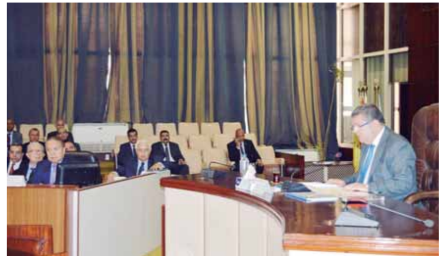
وزير قطاع الأعمال خلال رئاسته أمس للجمعية العمومية للقابضة للنقل

كانت «الوفد» قد اقترعت بقرار نقل تسمية الهندسية للسيارات من القابضة للنقل إلى القابضة للصناعات المعدنية؛ حيث حصلت وزارة قطاع الأعمال العام على