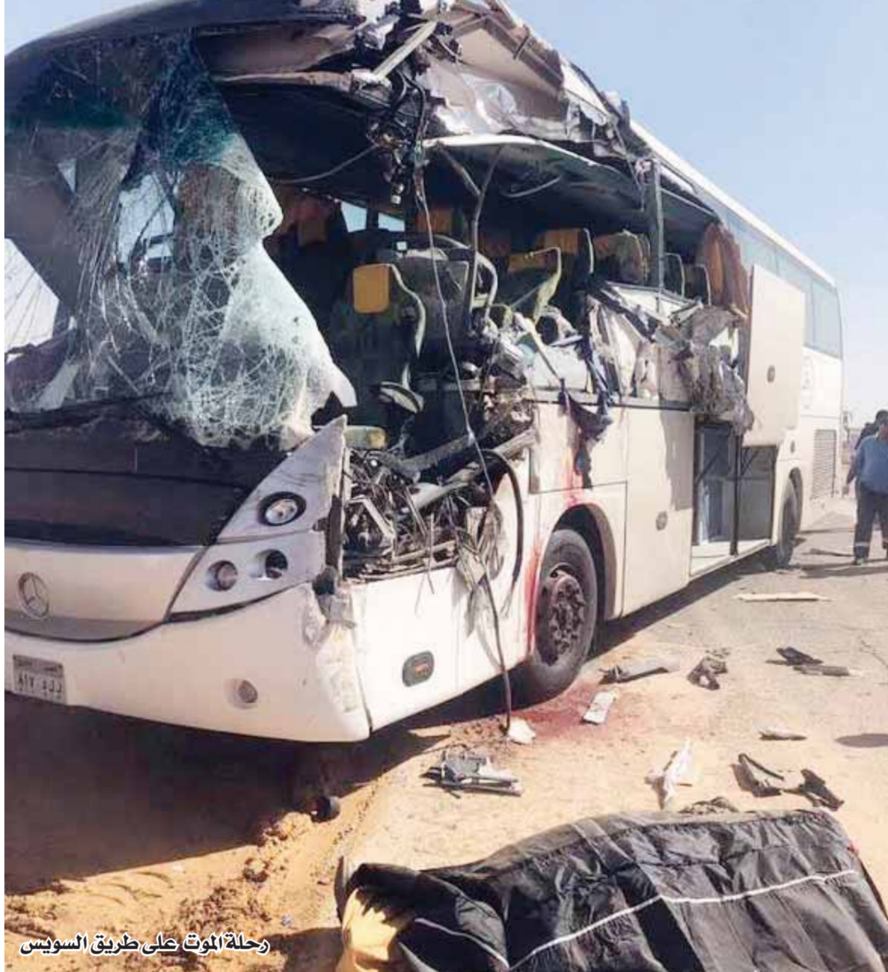
رحلة الموت على طريق السويس