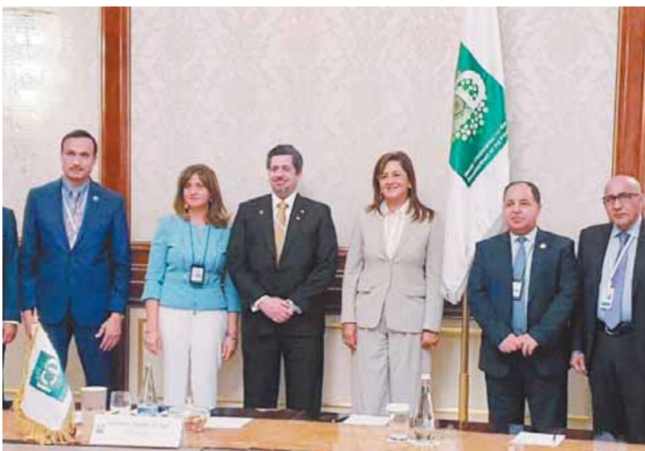
وزير المالية ووزيرة التخطيط في الاجتماع السنوي لمجموعة البنك الإسلامي للتنمية

ترجع العجز الكلي إلى ٤,٧٪ وتحقيق فائض أولى ٤,١٪ من الناتج المحلي العام الماضي