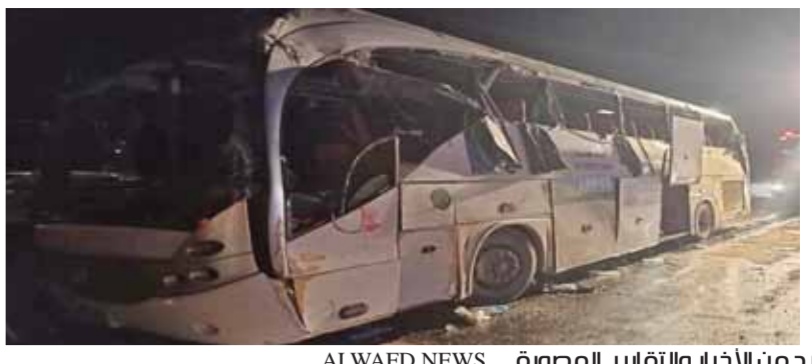
لمزيد من الأخبار والتقارير المصورة ALWAFD.NEWS