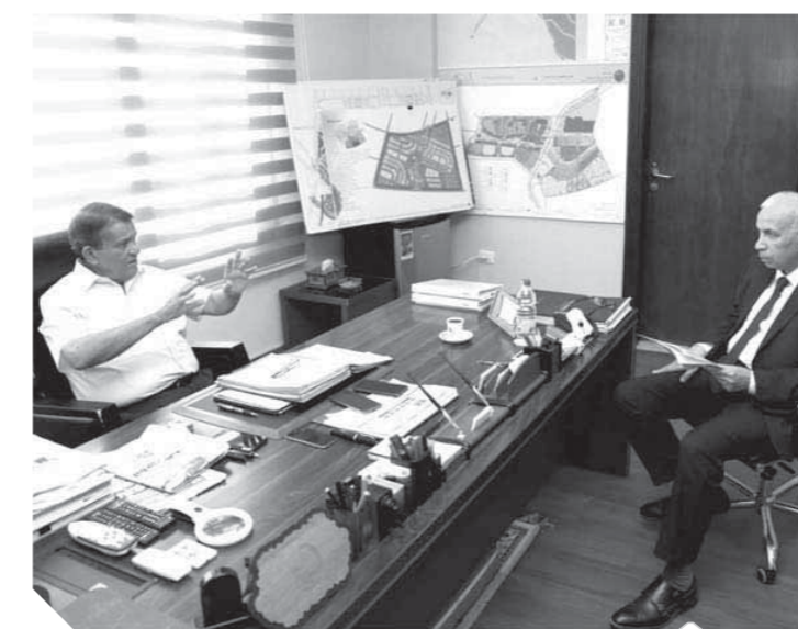
اللواء أحمد زكي عابدين خلال حديثه للزميل علي حسن

المرحلة الأولى من العاصمة الجديدة قاربت على الانتهاء وهي تعادل مساحة واشنطن نسعى لتحويل العاصمة الإدارية الجديدة إلى عاصمة للشرق الأوسط