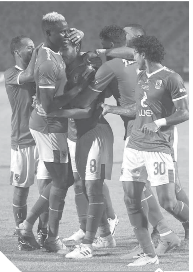
الأهلي حقق فوزا مهما أمام وادي دجلة