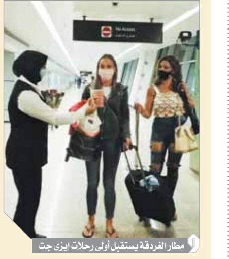
مطار الفردقة يستقبل أولى رحلات إيزي جت