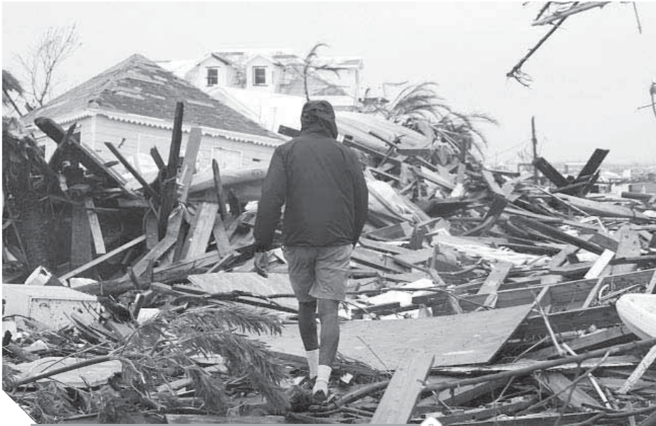
دمار غير مسبوق تسبب في الإعصار