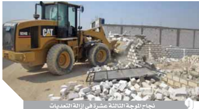
نجاح الموجة الثالثة عشرة في إزالة التعديلات

تسليم ٤٥٠٠ مواطن عقود تقنين الأراضي بالمحافظات استرداد ٢٠٧ آلاف فدان و٦ ملايين متر وازالة ٢١ حالة تعدد كتبت، نغم هلال، أكد تقرير المنظومة الإلكترونية لاسترداد أراضي الدولة، ارتفاع عدد العقود التي تم تسليمها بالمحافظات إلى أكثر من ٤٥٠٠ عقد لمن توافرت لهم شروط التقنين. جاء هذا خلال استعراض اللجنة العليا لاسترداد أراضي الدولة برئاسة المهندس شريف إسماعيل نتائج جهود المحافظات في تقنين أراضي الدولة، وأكد التقرير أن تسليم العقود شهد زيادة واضحة خلال الأسابيع الماضية مرجعها انتهاء المحافظات من إجراءات المعالجة لعدد كبير من طلبات التقنين، إضافة إلى نجاح اللجنة العليا بالتنسيق مع الحكومة في إنهاء كافة العقود القانونية والفنية التي كانت تعطل عمليات التعاقد، وهو ما يشير إلى استمرار التزايد في تسليم عقود التقنين بشكل كبير خلال الفترة القادمة. وشددت اللجنة خلال اجتماعها الدوري، والذي أداره هذا الأسبوع اللواء مجدى عبدالغفار مستشار رئيس الجمهورية للأمن ومكافحة الإرهاب على مواصلة المحافظات تكثيف جهودها لإنهاء ملف التقنين وفقاً للقانون، وتسليم العقود لكل من توافرت لهم شروط التقنين مع التأكيد على إيداع حصيله التعاقدات والرسم المختلفة في حساب حق الشعب، واستعراض اللجنة للنتائج النهائية للموجة الثالثة عشرة لإزالة التعديلات على أراضي الدولة، والتي لم تتوافر لها شروط التقنين أو لم تقدم عنها طلبات تقنين من الأساس، وأكد تقرير الأمانة الفنية للجنة أن الموجة الثالثة عشرة استمرت عن إزالة ٢١ ألفاً و٤٠٠ حالة تعدد، بلغت مساحة الأراضي المستردة منها نحو ٢٠٧ آلاف فدان أراض زراعية و٦ ملايين و٣٢٠ ألف متر مربع أراضى بناء بكافة المحافظات، وطلبت اللجنة استمرار في موجات