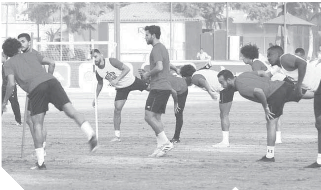
الأهلى يستعد بقوة لمواجهة كاتو سبورث الغنى