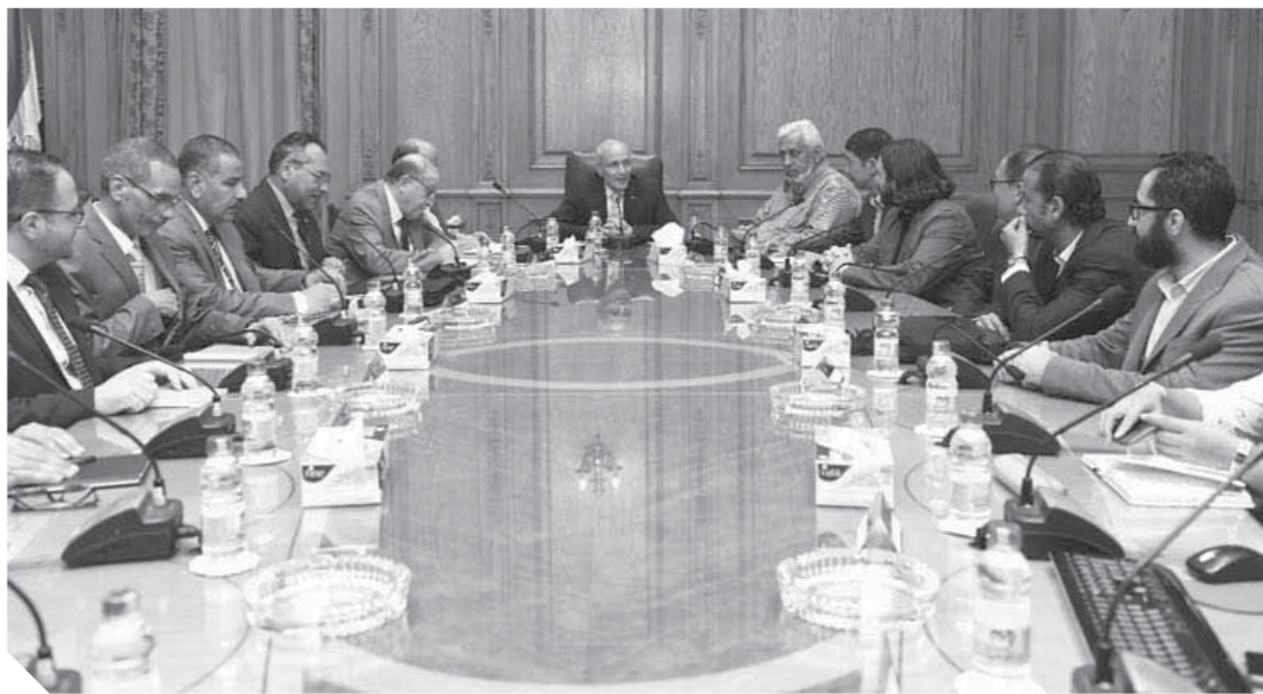
جاناب من اجتماع العصار، مع وفد شركة «أنكاى»

كتب صابر رمضان: افتتح فضيلة الإمام الأكبر الدكتور أحمد الطيب شيخ الأزهر، قسم جراحة القلب والصدر بمستشفى سيد جلال الجامعي بمنطقة باب الشعرية. وقال فضيلة الإمام الأكبر إن الأزهر الشريف لن يدخر أي جهد من شأنه تخفيف آلام المصريين ومشاركته همومهم للصين شهر أبريل الماضي على هامش منتدى الحزام والطريق. وأكد رئيس شركة «أنكاى» تطلعه بالتعاون مع وزارة الإنتاج الحربى لما يتوافر بشركاتها من إمكانيات تكنولوجية وفنية وتصنيعية وعمال فنيين مدربين وبنية تحتية متميزة.