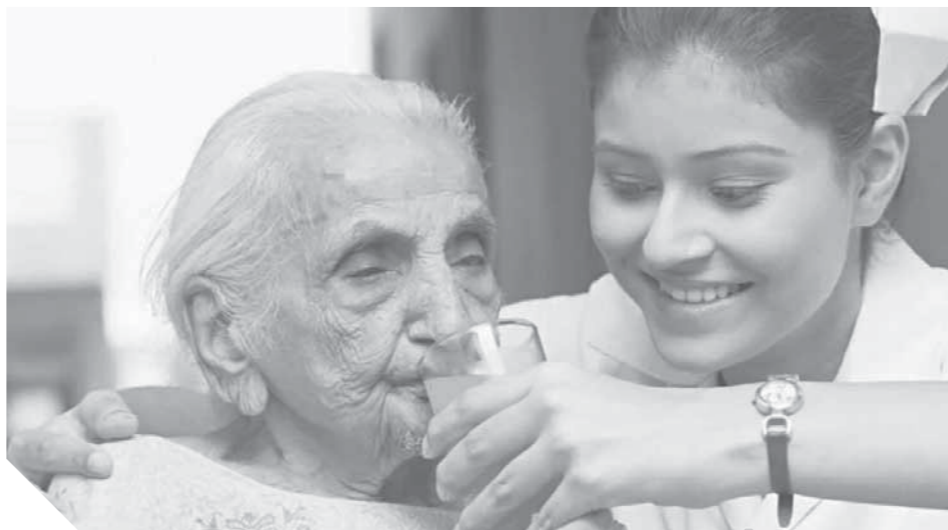
رد الجميل لكبار السن واجب وطني وديني

وقالت الدكتورة أسماء عبدالعظيم، أستاذة التنمية البشرية والصحة النفسية والإرشاد الأسري: تقديم خدمة رفيق المسن خدمة اجتماعية، ومجال عمل يوفر فرصة الحصول على عمل بمرتبات تبدأ من ٤ آلاف جنيه، بالتاكيد هي خطوات من غاية الأهمية لمسار