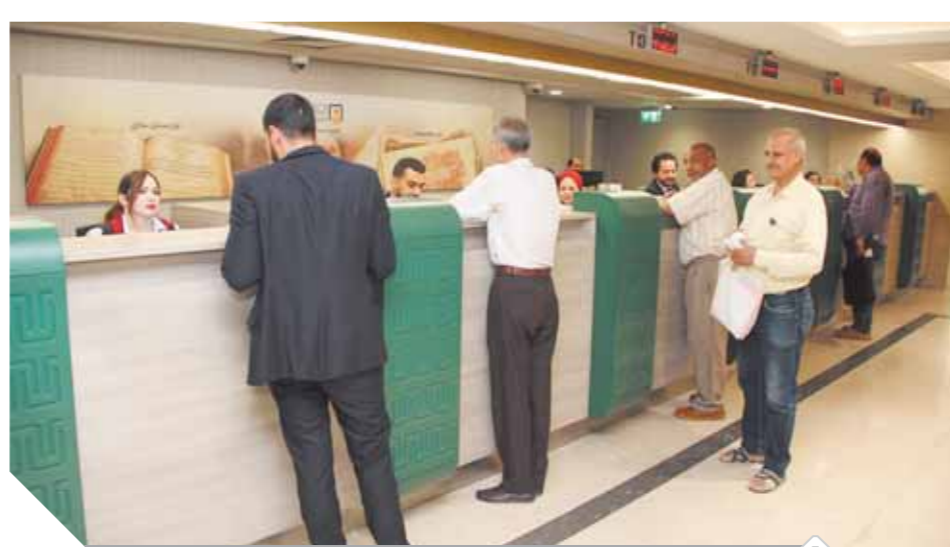
إقبال ضعيف على سحب قيمة شهادات قناة السويس

العملاء يتجهون لشراء الأوعية الادخارية للبنوك.. وإتاحة السحب من الماكينات