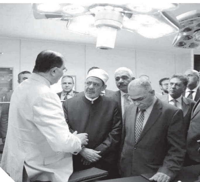
شيخ الأزهر يتفقد مستشفى باب الشعرية الجامعي

المتميز داخل كافة أقسام المستشفى المختلفة؛ بما يضمن توفير خدمة طبية مناسبة للمواطنين في مختلف التخصصات الطبية. وحرص فضيلة الإمام الأكبر، خلال الزيارة، على تفقد غرف العمليات والعناية المركزة وغرف رعاية المرضى، وذلك للاطمئنان على مستوى الخدمة المقدمة، موجهاً بتوفير كافة أوجه الرعاية الطبية اللازمة لجميع المواطنين المترددين على المستشفى. تأتي الزيارة في إطار اهتمام فضيلة الإمام الأكبر بقطاع المستشفيات بجامعة الأزهر؛ باعتباره القطاع الأكبر الذي يقوم بدور كبير في خدمة المجتمع.