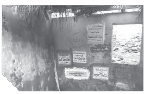
جانب من أعمال تطهير المقابر