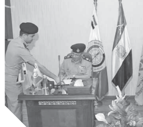
..وخلال توقيع بروتوكول التعاون مع الجامعة المصرية الروسية

خدمة وخدمة بيع قطع الغيار. ومنطقة إدارية وطبية على مساحة ١٥ ألف متر باستثمارات ١.٥ مليار دولار وتشمل مبنى إداريا ومبنى آخر للخدمات الطبية، ومنطقة لوجيستية على مساحة ٦٠ ألف متر، منها ٣٠ ألف متر لمنافذ توزيع لشركات الأدوية، و٤٠ ألف متر لمنطقة معارض تجارية. وأشار إلى أن المشروع يضم العديد من المشاريع التى تساعد على توفير فرص عمل مباشرة وغير مباشرة تتعدى ٥٠ ألف فرصة عمل تعمل على تعزيز الاقتصاد بالمنطقة ورفع مستوى المعيشة للمواطن بالدلتا. كما زار وزير الترميم والوفد المرافق له نادى ماتريكس فى المنطقة اللوجستية المقام على ١٥ فدانا لخدمة منطقة الدلتا سوف يتم افتتاحه بنابر القادم بعد الانتهاء من كافة الانشاءات. وردا على سؤال له الوفد» عن مدى تناسب المول التجارى مع القدرة الشرائية لمواطنى الدلتا، قال إنه وفقا لدراسات السوق