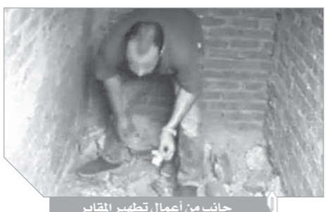
بعض أعمال الشر التي تم العثور عليها

كتب - عبده خليل: بهالة من القدسية والمهابة إلى جانب هيبه الموت ورعبه، ارتبط السحر الأسود بالموت، وهو ما جعله أشد وأخطر أنواع السحر لصعوبة الوصول إليه وتحديد مكانه من أجل إبطائه والتخلص منه من قبل المديين والدجالين، بالإضافة لخطورة جن المقابر وفقاً لاعتقاد البعض، الذين يعتبرونه من أخطر أنواع الجن وأكثرم إيدا للأنسان.