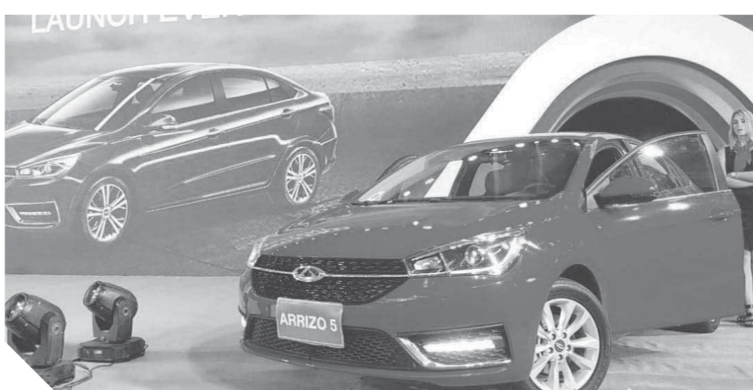
جانب من حفل إطلاق السيارة شيري اريزو المجمعمة محلياً

وبالنسبة للمقصورة الداخلية فهى مزودة بخامات عالية الجودة، بداية من الكونسول الوسطى، الذى يحتوى على شاشة ترفيهية HD مقاس ٧ بوصة، تتيح ربط الهاتف بالسيارة عبر تقنية البلوتوث، وصولاً إلى مكيف الهواء ذي الفتحات للركاب فى المقاعد الخلفية. ومنحت «Arrizo ٥» باقة من أنظمة السلامة والأمان للركاب، ومنها نظام منع إدارة المحرك، ومكابح مضادة للانغلاق ABS، وتوزيع قوة الفرامل إلكترونياً EBD، ووسائد هوائية أمامية، وكاميرا ونظام تحذير المسافة الخلفية لمساعدة السائق على الاصطفاف فى المكان الصحيح بكل سهولة، بالإضافة إلى نظام FIX ISO تثبيت مقاعد الأطفال فى السيارة.