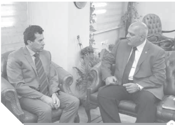
وزير الرياضة مع رئيس اتحاد الرماية

وتطرقت اللقاء الي الحديث عن التجهيزات المتعلقة باستضافة مصر لبطولة العالم لرماية الطلياق المروحية خراطوش العام القادم، والخطط التي وضها الاتحاد للخروج بالبطولة في أفضل صورة على كافة الأصعدة الفنية والتنظيمية واللوجيستية، كما تم بحث إقامة بطولة عربية إفريقية للرماية بمصر في مطلع العام القادم. واستعرض اللقاء برنامج اتحاد الرماية في ضوء الاستعدادات لمنافسات دورة الألعاب