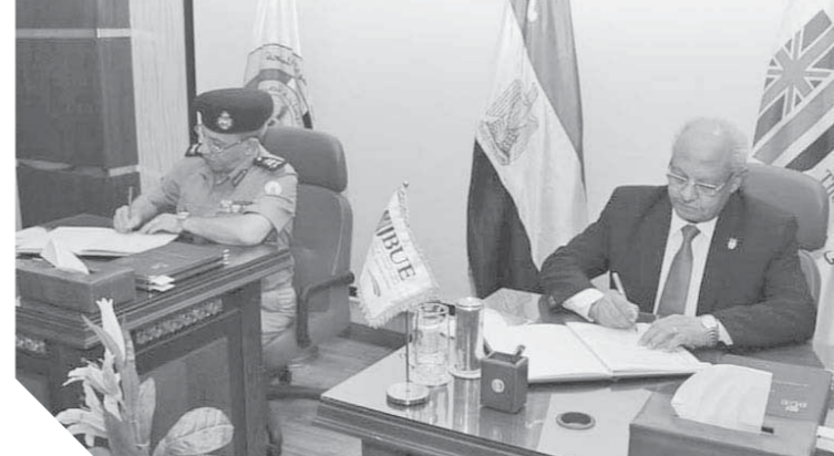
جانب من توقيع بروتوكول التعاون بين ، طب القوات المسلحة ، والجامعة البريطانية