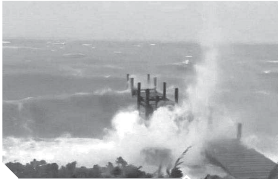
الفيضانات تغرق العديد من المناطق

ويحسب رئيس الوزراء هوبيرت مينيس فإن نسبة الدمار في مدينة مارش هاريزور، كبرى مدن أرخبيل أبياكوس، بلغت حوالي ٦٠٪. في الوقت نفسه حذر مساعد الأمين العام للأمم المتحدة للشئون الإنسانية مارك لوكوك من أن حوالي ٧٠ ألف شخص في جزر الباهاما بحاجة إلى مساعدة فورية بسبب