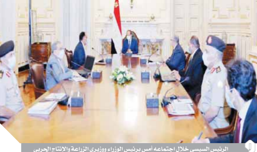
الرئيس السيسي خلال اجتماعه أمس برئيس الوزراء ووزيري الزراعة والانتاج الحربي

استعراض الدراسات الخاصة بالتوسع في توطين وتصدير سلالات الماشية المستوردة ذات الإنتاجية المرتفعة من اللحوم والألبان، بهدف إحلال وتحسين السلالات الموجودة محلياً في مصر، بما يساهم في تقليص فجوة الاستيراد من اللحوم وزيادة كمية إنتاج الألبان وما لذلك من مردود إيجابي على دخل صغار المربين والمزارعين. كما تم استعراض البرنامج الوطني لإنتاج بذور الخضراوات وأصنافها والذي يهدف إلى تقليل الاعتماد على الاستيراد من الخارج ومن ثم تخفيض تكلفة الإنتاج في هذا الصدد. وأضاف المتحدث الرسمي أن رئيس الوزراء قام بمرح عرض الموقف التنفيذي للمشروع القومي لتنمية شمال ووسط سيناء، والمتضمن القطاعات المستهدفة بالتوسع الأفتق، مع استعراض التكلفة المالية المتوقعة وفقاً لأفضل البدائل والخطط والمشروعات ذات الصلة، بما في ذلك مسارات مياه الري في مناطق التوسع المستهدفة، وأيضاً الاستفادة من مياه الصرف الزراعي المعالجة المتاحة حالياً، وتلك المتوقع توفيرها من محطة معالجة مياه الصرف الزراعي من مصرف بحر البقر، وقد وجه السيد الرئيس في هذا الإطار بالإسراع في سير الموقف التنفيذي لهذا المشروع الاستراتيجي لما له من مردود مباشر وملمس على جهود تنمية سيناء.