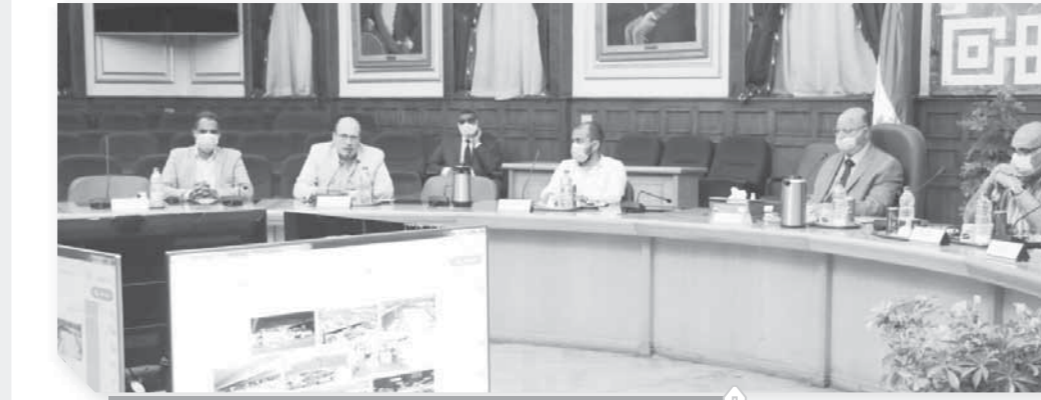
محافظ القاهرة خلال اجتماعه بالسنتين عن تطوير القاهرة الخديوية