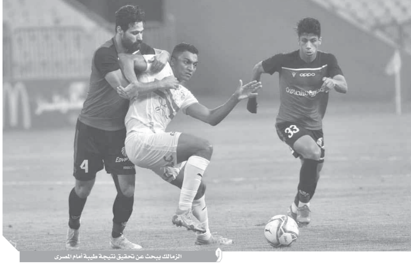
الزمالك يبحث عن تحقيق نتيجة طيبة أمام المصرى