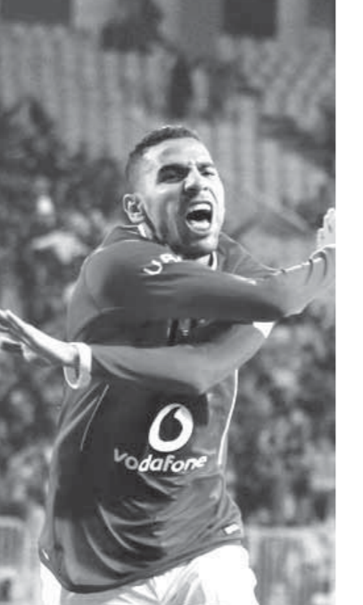
جديفة فى مران الأهلئ