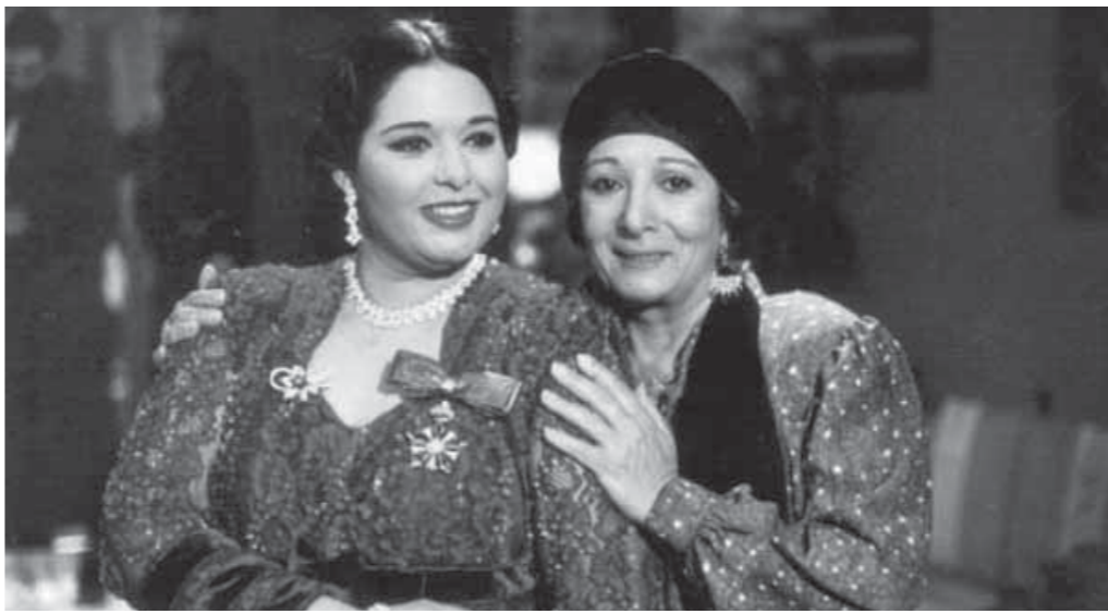
سميرة عبد العزيز وصابرين في مشهد من مسلسل «أم كلثوم»