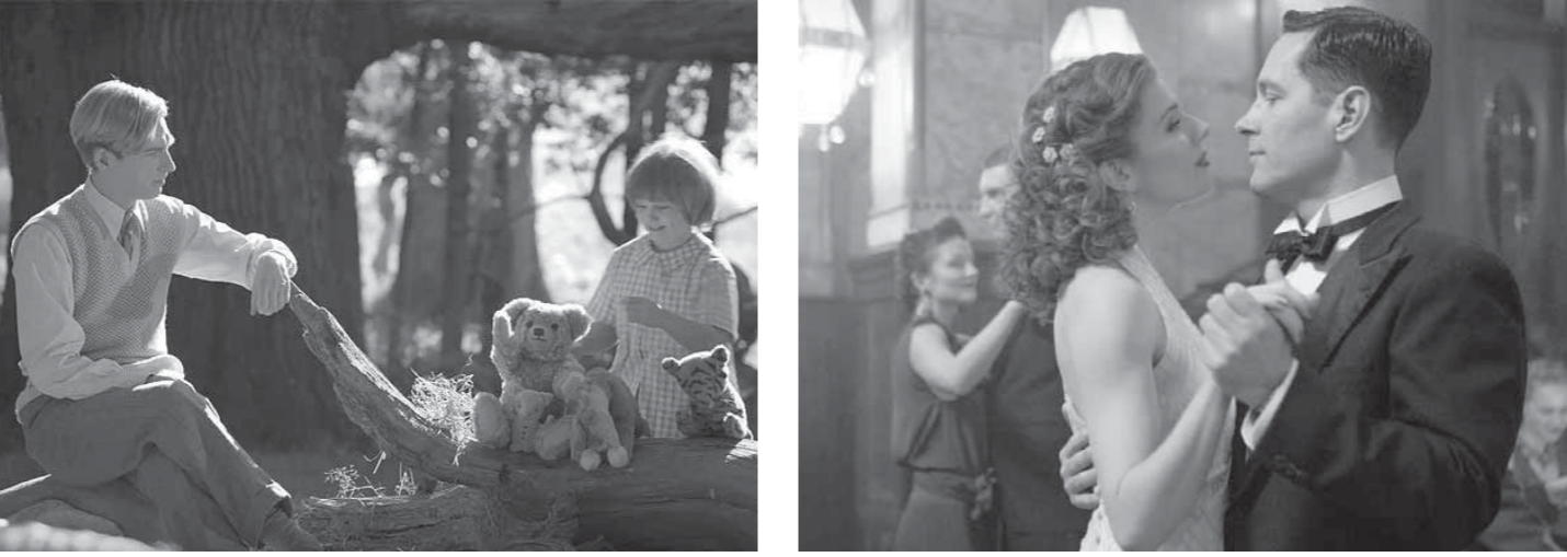
مشهد من فيلم «christopher robin»