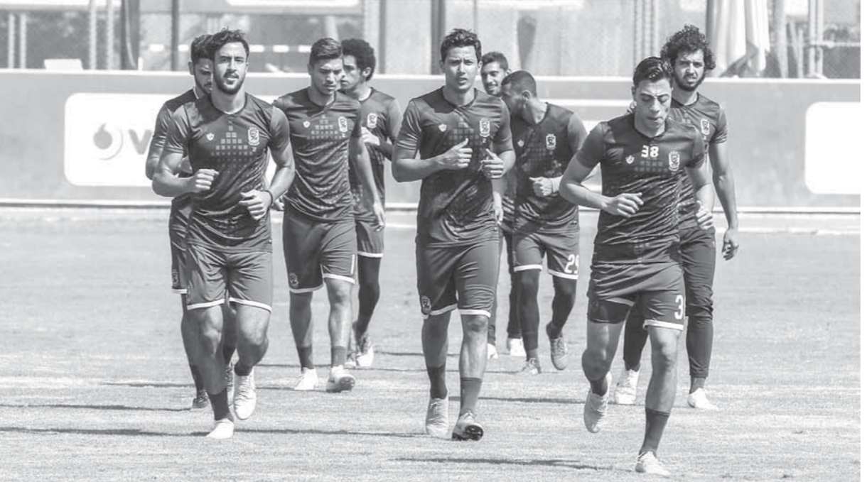
جديفة فى مران الأهلئ

لا صوت يعلو فوق صوت المواجهة النارية التي تجمع بين الأهلئ والمصرئ غداً الثلاثاء فى استاد برج العرب بالإسكندرية فى الجولة الثانية للدورى الممتاز بعدما أعلن الجهاز الفنى للأهلئ بقيادة الفرنسي باتريس كارتيرون حالة الطوارئ قبل هذه المواجهة. وينادي الفريق الأحمر الآننيين، إلى الإسكندرية ويخوض مرانه الأخير على ملعب برج العرب، وخاض الفريق مراناً شاقاً أمس الأحد، بدأ بمحااضرة فنية من الفرنسي «كارتيرون» للاعبئ وطالبهم فيها بالحد من الشدئ من تكرر مسلسل الأخطاء السالجة التي حدثت فى مباراة الاسماعئلي التي انتهت بالتعادل.