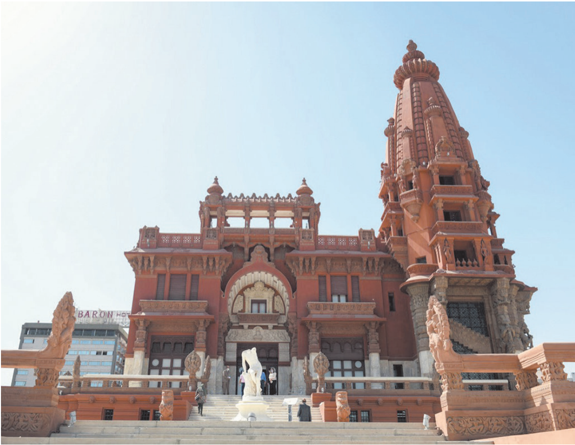
المتحف المصري ومدينة شالي بسيوة وقصر البارون على لأحة المواقع التراثية بـ (الإيسيسكو)