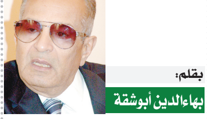
بقلم: بهاء الدين أبو شقة