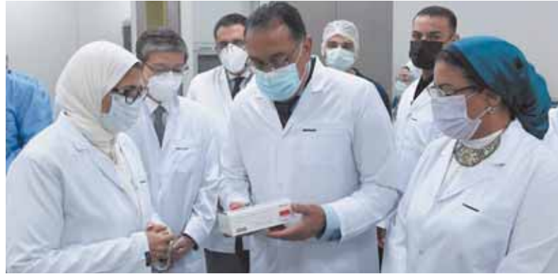
تفقد رئيس الوزراء مصنع إنتاج لقاح كورونا للشركة القابضة للمستحضرات الحيوية

عليها مع شركة «سينفاك» الصينية. وسيتم إنتاج ما بين ١٠ إلى ١٥ مليون جرعة لقاح شهرياً، بداية من شهر أغسطس المقبل، كما تستهدف تطعيم ٤٠ مليون مواطن بنهاية العام، مع الإشارة إلى الاتفاقية التي أبرمتها الدولة للحصول على لقاحات فيروس كورونا بالتعاون مع مختلف الشركات العالمية ومع التحالف الدولي للقاحات والأمصال (جافي) للحصول على أكثر من ١٢٠ مليون جرعة لقاح للمواطنين.