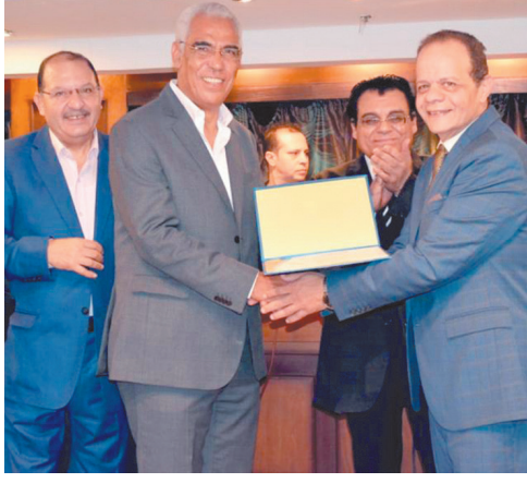
احتفالاً بمرور عام على إنشائه..