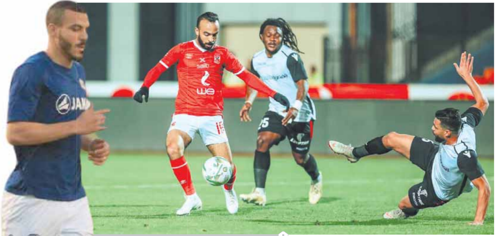
أفشة يسابق الزمن للحاق بمواجهة الترجى