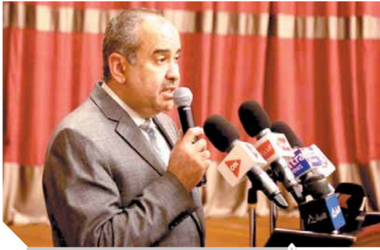
وزير الطيران خلال المؤتمر الصحفي لتطعيم العاملين بالطيران