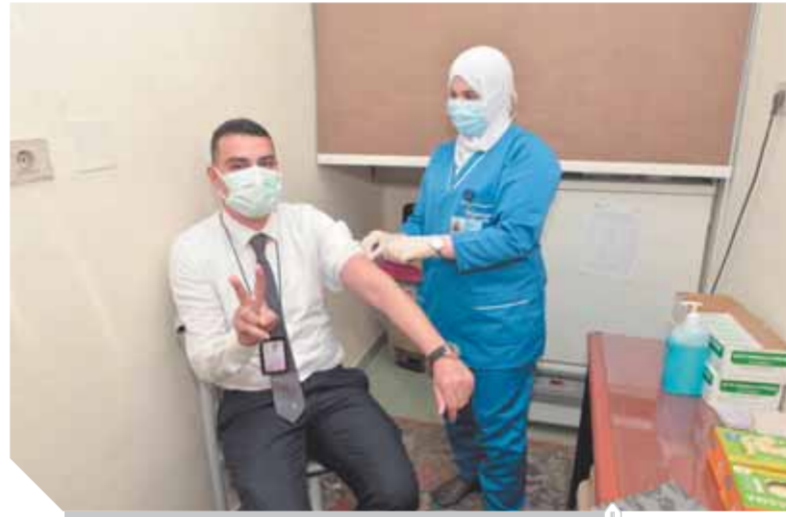
أحد العاملين بقطاع الطيران خلال تلقيه التطعيم