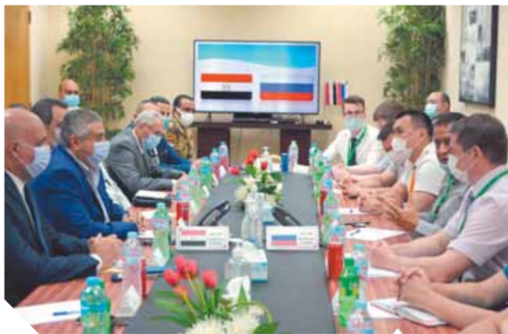
نائب وزير الطيران خلال لقائه الوفد الروسى

في إطار توجيهات الطيار محمد منار، وزير الطيران المدني بالتنسيق المستمرة للإجراءات الأمنية والاحترازية والوقائية المطبقة بالمطارات المصرية، قام الطيار مناصر منار، نائب وزير الطيران المدني بزيارة تفقدية لمطارى شرم الشيخ والفردقة حيث التقى بالوفد الأمنى الروسى المتواجد حالياً بكلتا المطارين، حيث تم مناقشة واستعراض جميع الإجراءات الأمنية المطبقة في جميع مراحل السفر والوصول والإجراءات تأمين الركاب والحاقبات وغيرها، بالإضافة إلى الإجراءات الاحترازية التي تتبعها وزارة الطيران المدني لحماية المسافرين من خطر الإصابة بفيروس كورونا المستجد وذلك بالتعاون مع الجهات المعنية وذلك استعداداً لعودة الحركة الجوية من المطارات الروسية إلى مطارى شرم الشيخ والفردقة.