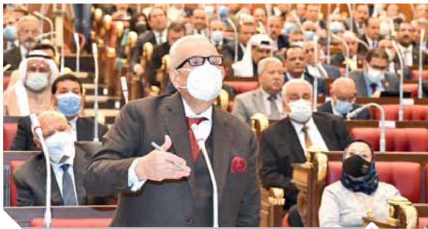
أبو شقة خلال حديثه في جلسة الشيوخ أمس تصوير: خالد مشعل