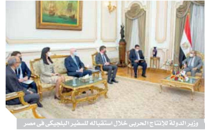
وزير الدولة للإنتاج الحربى خلال استقباله للسفير البلجيكى فى مصر

كتبت- محمد صلاح وإبوزيد كمال وسامية فاروق، استقبل المهندس محمد أحمد مرسى، وزير الدولة للإنتاج الحربى، فرانسوا كورنيه ديلزيوس، السفير البلجيكى لدى مصر، لبحث سبل تعزيز التعاون المشترك بين البلدين فى مجالات التصنيع المختلفة، جاء ذلك بديوان عام وزارة الإنتاج الحربى، وبحضور المهندس محمد محمد صلاح الدين، نائب رئيس مجلس إدارة الهيئة القومية للإنتاج الحربى والعضو المنتدب، وعدد من قيادات الوزارة. تم خلال اللقاء استعراض القدرات والإمكانات التصنيعية والتكنولوجية والفنية والبشرية لشركات ووحدات الإنتاج الحربى، ومناقشة الموضوعات التى يمكن التعاون بها مع الشركات البلجيكية العاملة فى مجالات التصنيع المختلفة على الصعيدين العسكري والمدنى، وأشار وزير الدولة للإنتاج الحربى إلى اهتمام الوزارة بالاستفادة من الخبرات البلجيكية،