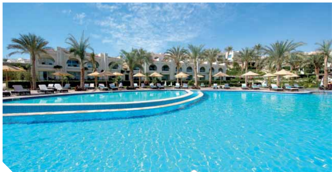
منتجع SUNRISE Montemare Resort شرم الشيخ

استمتع بإجازتك العائلية الآن بمنتج SUNRISE Monte-Grand-Resort mare-lect بعد تحويله إلى منتجع عائلي ليكون أحد أفخم الفنادق بشرم الشيخ التي تتشرف بتقديم خدمة فاخرة تليق بأسرتك. يشمل ذلك غرفاً فضيحة ومريحة لتسع جميع أفراد الأسرة، وتأتي بوسائل متعة عديدة كالجاكوزي وحمامات السباحة المخصص وامتيازات أخرى متنوعة. ويحتوى الفندق على نادٍ مخصص للأطفال لمتعة لا حصر لها؛ كما يمكن لعائلتك التلذذ بوجبة غنية في واحد من ٧ مطاعم تقدم شتى أنواع الطعام، كالأطباق الآسيوية والإيطالية والمصرية وغيرها حتى تتم بإجازة سعيدة متكاملة.