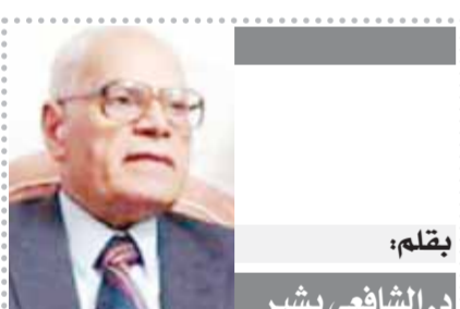
يقلم: د. الشافعى بشير

لقد تكاثرت قذراً يوماً على تسليح المعارضة السورية فكان هذا بمثابة صب الزيت على النار، وكان قد غاب عنها التداعيات الخطيرة والدومية التى ستجتم من ذلك، وهى دعوة حذر منها «الآن جوييه» وزير الخارجية الفرنسى، حيث قال (إنها ستقود إلى نشوب حرب أهلية فى سوريا بين جميع الأطياف). كما أنها تعارض مع النهج المنطقى الذى تبنته مصر والقائل بأن تسليح المعارضة يمكن أن يؤدى إلى حرب أهلية شاملة، وتعارض مع مظهر العراق من أنها قد تؤدى إلى حرب إقليمية دولية تمهد للتدخل العسكري الأجنبى، وتعارض مع ما حذر منه «الأفروف» وزير خارجية روسيا من أنها ستزيد من سفك الدماء، حتى الله سوريا العربية وانصفها وأعاد للحق وبيض الانتصار.