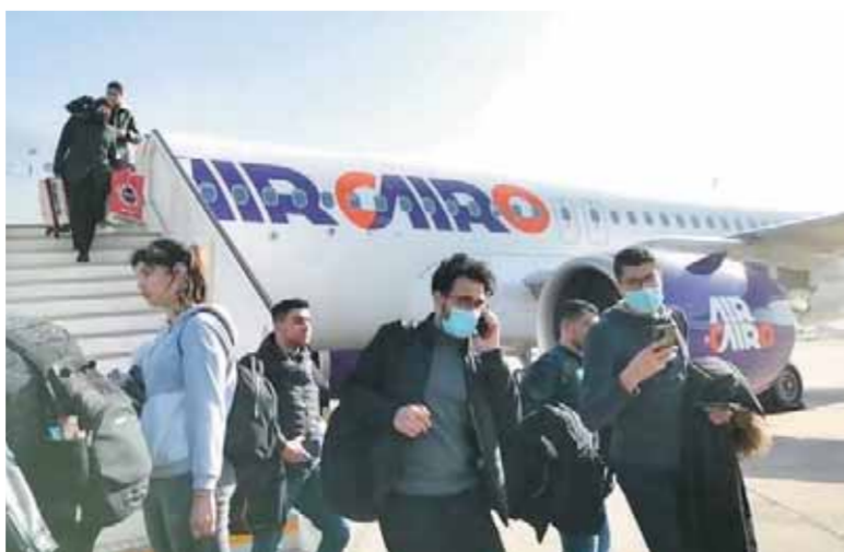
جددت وزيرة الهجرة مناشدتها للمصريين بأوكرانيا بالالتزام بالتعليمات الصادرة عن السلطات المختصة واللجوء لأماكن الإيواء الدراسية للطلاب.

فى المناطق الخطرة، والتواصل مع السفارة المصرية وممثلى الجالية عند تحركهم حتى الوصول للمناطق الحدودية الآمنة. وفى سياق متصل عادت للقاهرة طائرتان قادمتان من بولندا، وعلى متنها طلاب يدرسون بالجامعات الأوكرانية. وصرح السفير نادر سعد المتحدث الرسمى لرئاسة مجلس الوزراء بأن الطائرتين اللتين عادتتا لأرض الوطن تنبعان من شركة «إير كايرو»، وأشار «سعد» إلى أن قرار تذييل كافة العقبات لإعادة المصريين بأوكرانيا يأتى فى سياق توجيهات الرئيس عبدالفتاح السيسى بمساعدة الطلاب المصريين فى العودة لأرض الوطن. جدير بالذكر أن وزارة الدولة للهجرة وشؤون المصريين بالخارج بالتعاون مع وزارة التعليم العالى والبحث العلمى، طرحت استمارة تسجيل موحدة للطلاب الدارسين فى أوكرانيا فى إطار تلبية مطالبهم، تضم الاستمارة كافة تفاصيل السنة الدراسية التى يدرس فيها كل طالب بأوكرانيا والمدينة التى يقيم بها.