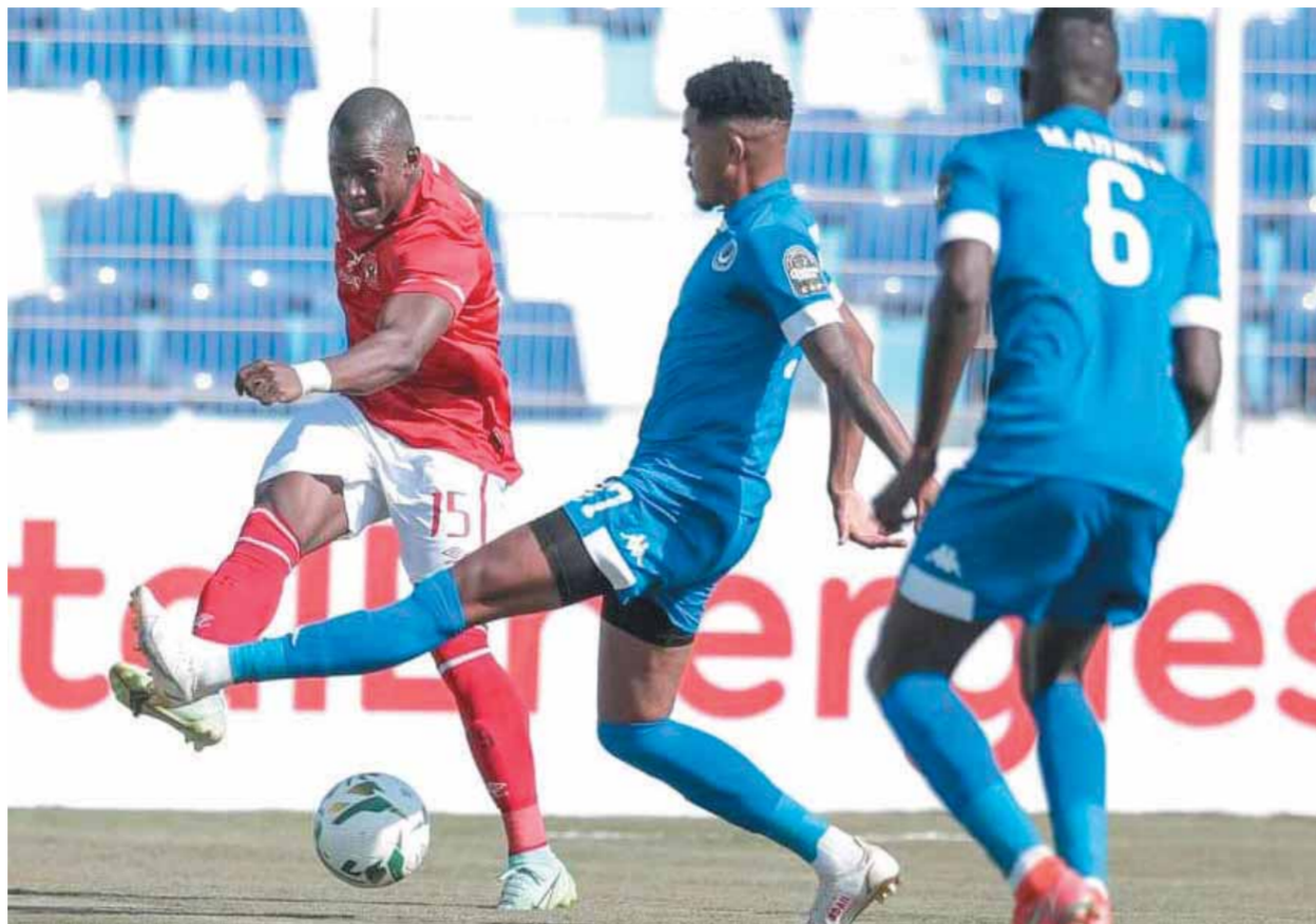
ديانج يقترب من الدورى الإنجليزي

وهى حكمة ليست فى كل المديرين مهما امتلكوا من إمكانيات فنية فهى موهبة يختص بها الله البعض، وإذا كانت المدرسة البرتغالية متفوقة فى الأغلب الأعم فى هذا الجانب عالمياً، فهى مع فيرييرا أكثر توقفاً خاصة أنه يشقق القلعة البيضاء ويملك أدواته وقادر على التحدي. والمجلس الجديد بقيادة المستشار مرتضى سيكون سنداً وداعماً له للوصول بفريق الكرة لأعلى نقطة ممكنة واستعادة البطولات خاصة الأهم الدورى المصرى ودورى الأبطال والتواجد فى كأس العالم للأندية. sabryhafez@hotmail.com