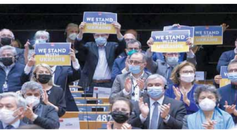
مجموعة من المواطنين في بروكسل يحملون لافتات تضامنا مع أوكرانيا.

إلى أن حصول أوكرانيا على موافقة الانضمام للاتحاد الأوروبي مسألة قد تستغرق سنوات، وصرحت يبيروك لصحيفة بوليميرج الأمريكية بأن الانضمام للاتحاد يستلزم إجراء عملية «تحول» مكثف على حد قولها، وأعقب شارل ميشال رئيس المجلس الأوروبي كلمة زيلينسكي، مؤكدا أنه سوف ينظر إلى الطلب متوخيا الاعتبار النواحي الرمزية والسياسية والشريعة من أجل النظر في الطلب الأوكراني حسب صحة بيوراكتيف، وتعهد ميشال بتوجيه الدعوات الرسمية لأوكرانيا من أجل حضور كافة القمم الأوروبية القادمة.