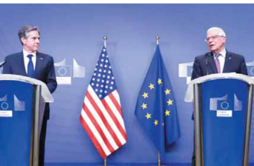
جوزيب بوريل نائب رئيس الاتحاد الأوروبي مع الرئيس الأمريكي جو بايدن في مؤتمر صحفي مشترك.

وأوضح بلينكن في مستهل حديثه أثناء اجتماع وزراء خارجية الاتحاد الأوروبي أن الولايات المتحدة تعيش لحظة تاريخية تجمعها وحدة وتعاون غير مسبوقين مع حلفائها الغربيين الذي سوف يتكسب إيجابيا على قوة الشراكة الأوروبية الأطلسية في المستقبل، وأضاف بلينكن أن هذا التعاون تجسد في الاتفاق الكامل على العقوبات التي قررتها مجموعة هذه الدول ضد روسيا والرئيس الروسي فلاديمير بوتين ورجاله وبعض أعضاء الكرمين، مما جعل روسيا في عزلة تامة غير مسبوقة، مشيرا إلى ضرورة الاستمرار في هذا التعاون القوي من أجل ضمان تنفيذ هذه العقوبات وسد جميع الثغرات التي قد تقود تنفيذها إلى حد قوله، كما وجه بلينكن حديثه إلى الصحفيين موضحا إقرار مجموعة الدول السبع الصناعية عقوبات إضافية على روسيا والكيانات المتصلة بتمويل آلة الحرب الروسية. ومن جانبه نعى جوزيب بوريل نائب رئيس الاتحاد الأوروبي عن هدف العقوبات المفروضة