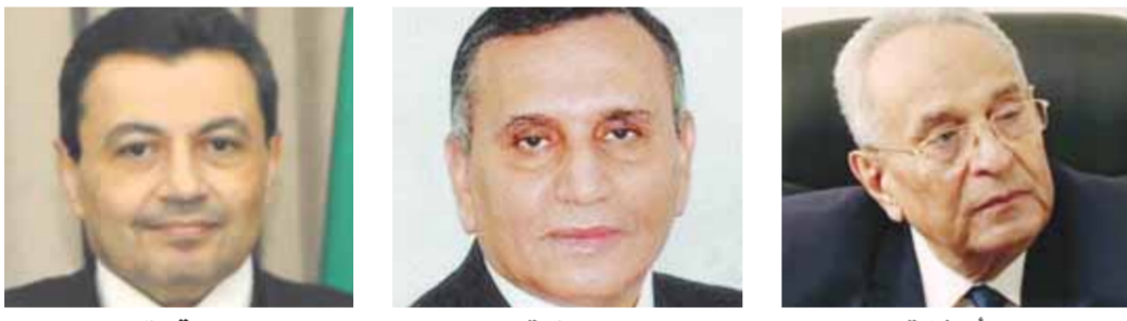
قورة بيمامة أبو شقة