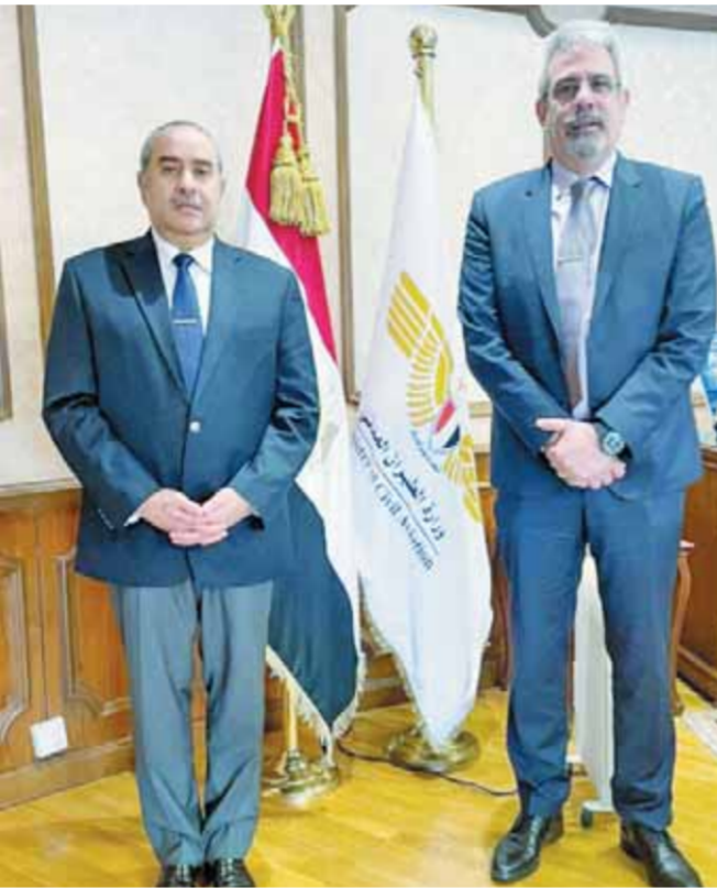
وزير الطيران خلال لقائه نائب رئيس الاياتا