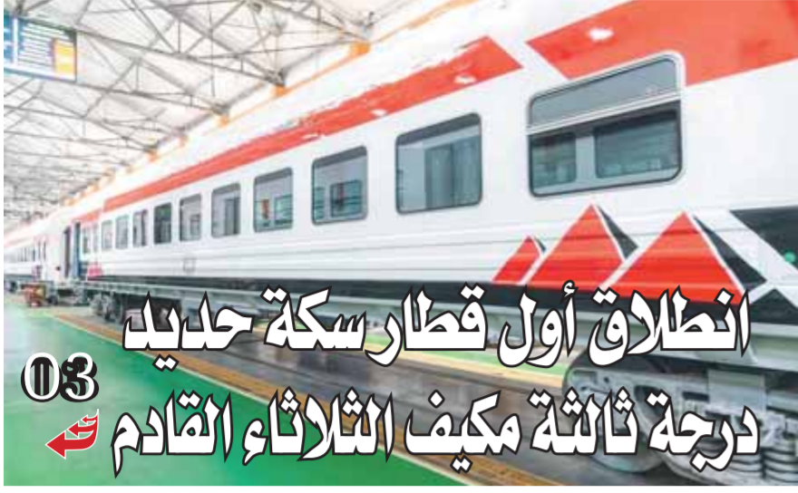
انطلاق أول قطار سكة حديد درجة ثالثة مكيف الثلاثاء القادم