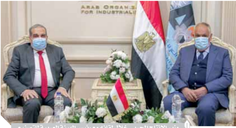
وزير الإنتاج الحربى خلال لقائه مع رئيس الهيئة العربية للتصنيع