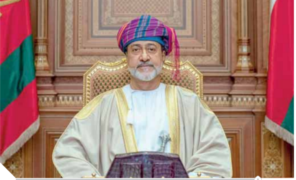
السلطان هيثم بن طارق

منذ تولي السلطان هيثم بن طارق، سلطان عُمان، مسؤولية الحكم العام الماضي، يحرص دوماً على تعزيز التعاون مع كافة الدول العربية وتنمية وتطوير هذا التعاون بما يقوّى مسيرة العمل العربي المشترك، وأكد ذلك في أول يوم لتوليه الحكم، حينما قال: «سوف نستمر في دعم جامعة الدول العربية وستعاون مع أعضائها زعماء الدول العربية لتحقيق أهداف الجامعة والرفق بحياة مواطنينا والتي بهذه المنطقه عن الصراعات والخلافات والعمل على تحقيق تكامل اقتصادي يخدم تطورات الشعوب العربية». وعلى مدار الأشهر الماضية عكست مشاركات سلطنة عُمان في المحافل العربية والإقليمية والدولية تأكيداً واضحاً أن عُمان لا تدخر أي جهد في خدمة القضايا العربية، وعبرت عن مواقفها القوية الراسخة في دعم العمل العربي المشترك وتعزيز مستوياته، انطلاقاً من سياستها الخارجية الثابتة مع الأصدقاء والأصدقاء.