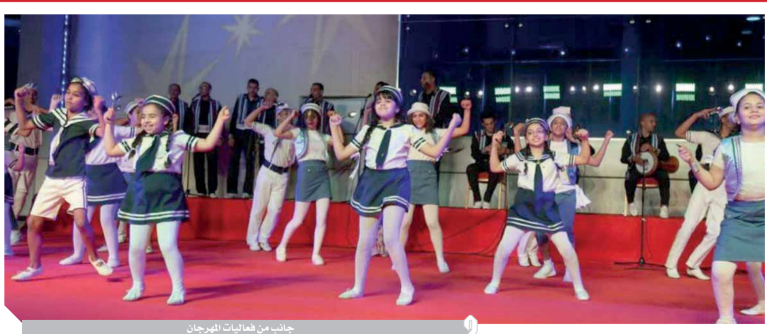
جانب من فعاليات مهرجان

١٩٦٤ وأوصت بتعديل وإضافة ٢٨ مادة وكذلك كتبت عن التعارض بين الجهات المختصة والمتداخلة والاختصاصات والرسوم المفروضة . كل ذلك ويكل اسف ظل حبيس الأدرج . لم يطلع عليه أحد . ويبدو ان طبيعة واختصاص أعضاء الحكومة . ومجلس النواب . وعدد أعضائه ومسئولياتهم . لا تتسع للدراسة والتأمل والتأني في اصدار التشريع وضبط ايقاع الحكومة في مواجهة طوفان التشريعات . لأنها تحظى بتأثير ساحر ومسكنات وقتية لحل المشاكل !! • وبهذه المناسبة الحالية . لنا ان ندعو مجلس الشيوخ الموقر . وهو يستعد لبدء جلساته وممارسة اختصاصاته ومسئولياته . الأسبوع القادم . بعد غياب طويل . بادرنا ما يراه كفيلا لدعم السلام الاجتماعي . وتوسيد دعائم الديمقراطية والمقومات الأساسية للمجتمع وقيمة العليا والحقوق والحريات . ويقع على القمة من الدراسة . مواجهة أزمة صناعة التشريع في مصر ومناقشة القضية الحالية بمناسبة الموجة الجادة لتعديلات قانون الشهر العقاري . ودراسة أسبابها . والوقوف على كيفية اعداد هذا التشريع ؟ . والموافقة عليه وصدوره ؟ . والعودة الى قيم وتقاليد العمل التشريعي . والسبيل الى حماية الثروة العقارية وكيفية تسميتها . وضمان انتقال الملكية وإجراء الصفقات بسهولة ويسر ودراسة مقارنة لما يجري في دول اخرى . ولعل المجلس الموقر . ان الأولوية !!