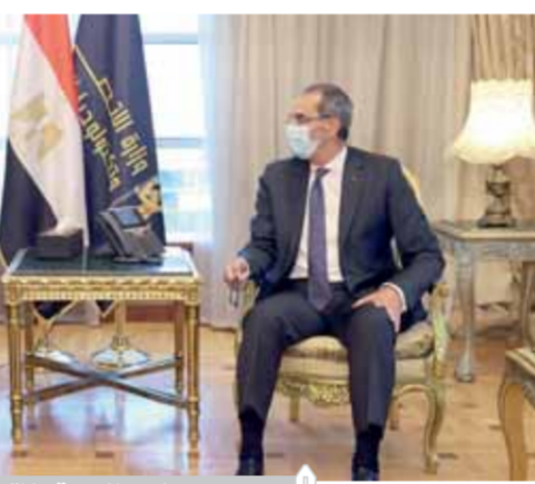
وزيرا الزراعة والاتصالات خلال الاجتماع

وخلال اللقاء تم الاتفاق على عدد من الإجراءات التنفيذية الخاصة بالانتهاج من عمليات تدقيق بيانات العيازات الزراعية، وتشكيل لجنة مشتركة لاستلام المشروع عقب إطلاقه فى باقى المحافظات من أجل تسهيل إجراءات متابعة التشغيل والصيانة. واتفق الجانبان على رقمنة ١٣٠ خدمة تغطى جميع قطاعات وزارة الزراعة على أن يتم إطلاقها على منصة مصر الرقمية خلال أربع مراحل؛ بحيث يتم إطلاق المرحلة الأولى فى يوليو المقبل تضم ٢٠ خدمة فى الأكثر طلباً وتمثل خدمات ملموسة مع الجماهير.