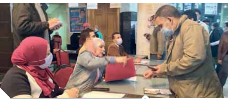
خلال عملية التسجيل

أعلنت اللجنة المشرفة على انتخابات التجديد النصفى لنقابة الصحفيين على منصب النقيب ٧٦ من أعضاء مجلس النقابة، عن تأجيل الانتخابات إلى يوم الجمعة ١٩ مارس المقبل، لعدم اكتمال النصاب القانونى لعقد الجمعية العمومية ٥٠٪. وأوضح خالد ميرى رئيس اللجنة المشرفة