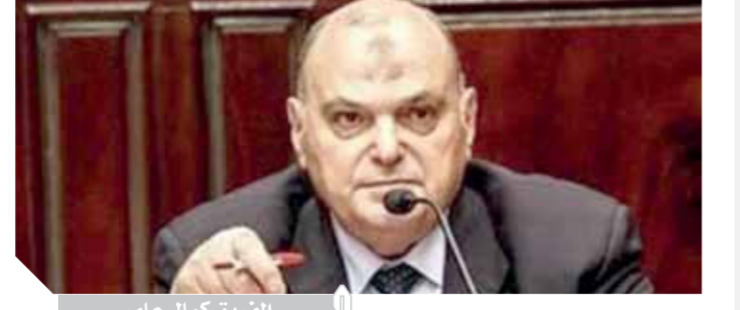
الفريق كمال عامر

كتب- محمد عبيد؛ نعى المستشار بهاء الدين أبوشقة رئيس حزب الوفد ووكيل أول مجلس الشيوخ باسمه وباسم مؤسسات الحزب ووجوه الوفدين الفريق فخرى كمال عامر رئيس لجنة الدفاع والأمن القومى فى مجلس النواب، أخصاً وصديقاً ونموذجاً مشرفاً للوطنية المصرية والآداء البرلمانى المتميز. رحم الله الفقيد وأسرتة خالص العزاء .. ورئيس برلمانية الوفد: «فقدنا قائداً وطنياً غيوراً على بلده» كان لهم بصمات واضحة فى التاريخ العسكرى المصرى. وتقدم رئيس حزب برلمانية الوفد باحر التعازى إلى أسرة الفقيد داعياً الله عز وجل أن يتغمده بواسع رحمته وأن يسكنه فسيح جناته ويلهم أهله وذويه الصبر والسلوان.