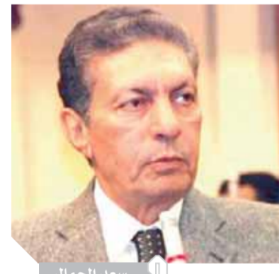
سعد الجمال العربية بمجلس النواب، وأثناء توليه منصب نائب رئيس البرلمان العربى. رحم الله الراحل الكريم وأسكنه فسيح جناته وألم أسرته وذويه الصبر والسلوان.