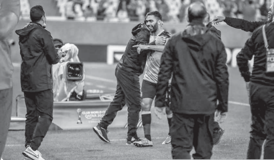
الأهلى تخطف عقبة الدحيل وجاهز للبايرن