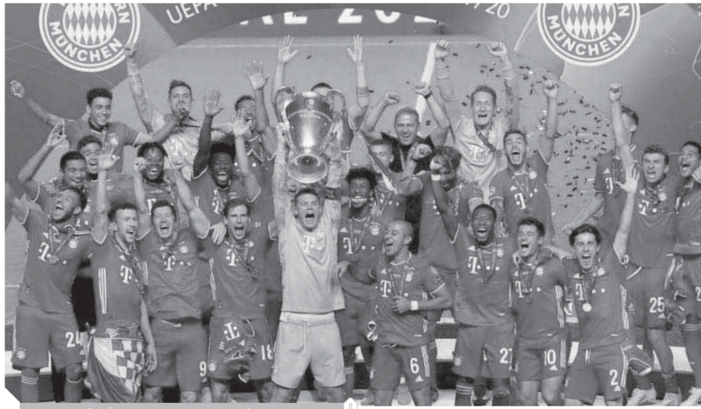
بطل أوروبا يحلم بالتتويج بمونديال الأندية

موسم واحد، بعدما حصل على خمسة ألقاب فى موسم ٢٠٢٠، فى دورى وكأس ألمانيا، وكأس السوبر الألمانى، ودورى أبطال أوروبا والسوبر الأوروبى.