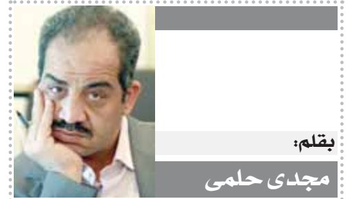
بقلم: مجدى حلمي