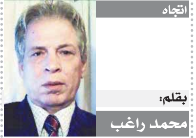
بقلم: محمد راجب

والعشرون من ديسمبر الماضى. وفى ٢١ ديسمبر ٢٠٢٣، أن كل الترتيبات الفنية أصبحت جاهزة ومن الممكن