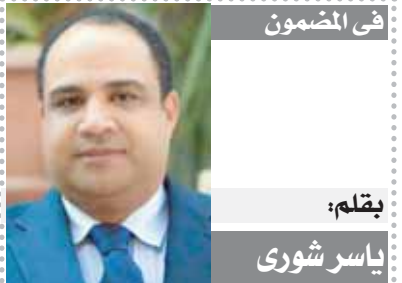
بقلم: ياسر شوري