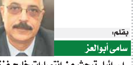
بقلم: سامي أبوالاعز