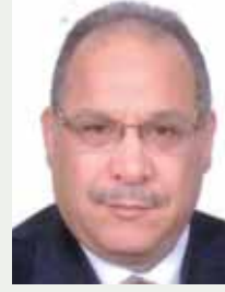
بقلم: حسين حلمي