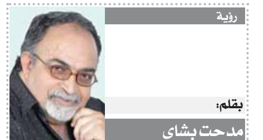
بقلم: مدحت بشاي

وفي حالة صدور القرار لصالح جنوب إفريقيا سوف تكون لطمة على كل الدول التي أيدت العدوان وعلى رأسها الولايات المتحدة الأمريكية التي تمارس ضغوطاً دبلوماسية لئلا تتخذ جلسات الاستماع.. سوف يكون القرار بإذن الله كاشفاً لعنصرية إسرائيل قبل الكيان الصهيوني وسوف يكون نقاشاً مفصلياً علينا أن نمتصها فوراً وإرسالها إلى الرأى العام العالمي حتى تصل الرسالة إلى كل بيت أو كوخ أو عشة على هذه الأرض.. وستكون بداية لزوال الاحتلال الإسرائيلي من على أرضنا الطاهرة في فلسطين.. شكراً جنوب إفريقيا شهما وحكومة.. فما قيمته به جميل سوف يطق عنق كل عربي مهما كآبته ينتهج.