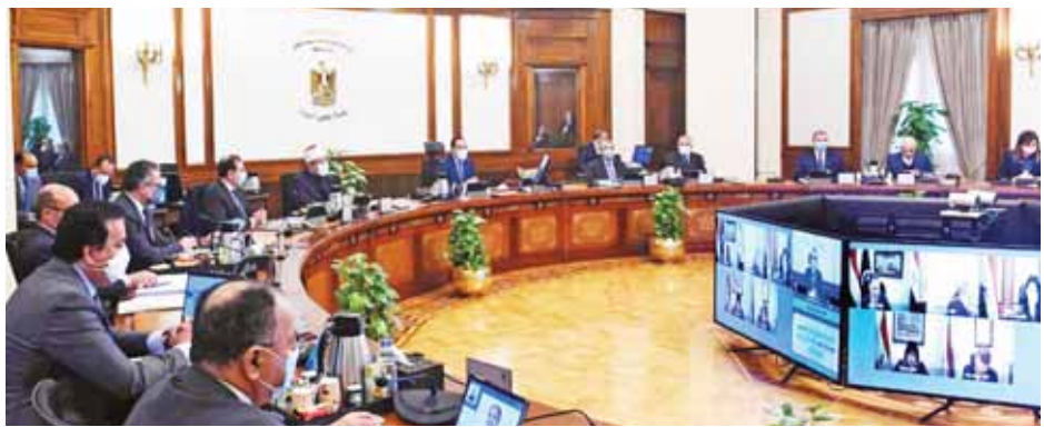
جانب من اجتماع مجلس الوزراء

الجمهورية بشأن الموافقة على قرار مجلس محافظتي بنك التنمية الإفريقي رقم ٥ لسنة ٢٠٢١، الصادر في ٥ مارس ٢٠٢١ بالتصديق على الموافقة الخاصة المؤقتة لرأس المال القابل للاستدعاء، وذلك من خلال استصدار أسهم مؤقتة لرأس المال القابل للاستدعاء، بقيمة اسمية قدرها ١٠ آلاف وحدة حسابية لكل سهم، كما تمت الموافقة على أداة إكتتاب مصر في إطار الزيادة الخاصة المؤقتة لرأس المال القابل للاستدعاء، ووافق مجلس الوزراء على مشروع قرار رئيس الجمهورية بشأن إنشاء جامعتين أهليتين باسم «جامعة حلوان الأهلية»، و«جامعة المنصورة الأهلية». كما وافق مجلس الوزراء على مشروع قرار رئيس مجلس الوزراء بتعديل أحكام اللائحة التنفيذية لقانون تنظيم الجامعات رقم ٤٩ لسنة ١٩٧٢، وذلك بإضافة كلية الآسمن لجامعة أسيوط، على أن يكون مقرها مدينة أسيوط الجديدة، وذلك في إطار تزويد الجامعات بالتخصصات العلمية وتقليل الأعباء.