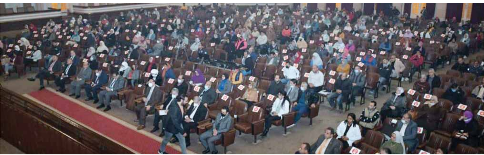
أساتذة وطلاب الجامعة خلال المحاضرة