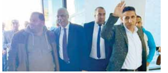
جمال علام وقائمه خلال عمومية الجبلية

كتب- إيهاب محروس: عاد جمال علام رئيس اتحاد الكرة مرة أخرى لرئاسة الجبلية، بعد اكتساح قائمته لانتخابات مجلس إدارة الاتحاد التي أجريت، أمس الأربعاء، بمقر الجبلية في مشروع الهدف بأكوبر، خلال الاجتماع العادي للجمعية العمومية للاتحاد. حصلت قائمة علام على الأغلبية المطلقة في العملية التصويت الأولى بمجموع أصوات بلغ ١٠٩ أصوات من أصل ١١٦ صوتاً شاركوا في العملية الانتخابية، فيما حصلت القائمة الثانية برئاسة محمد إبراهيم على ٦ أصوات بينما استبعد صوت واحد لبطلانه.