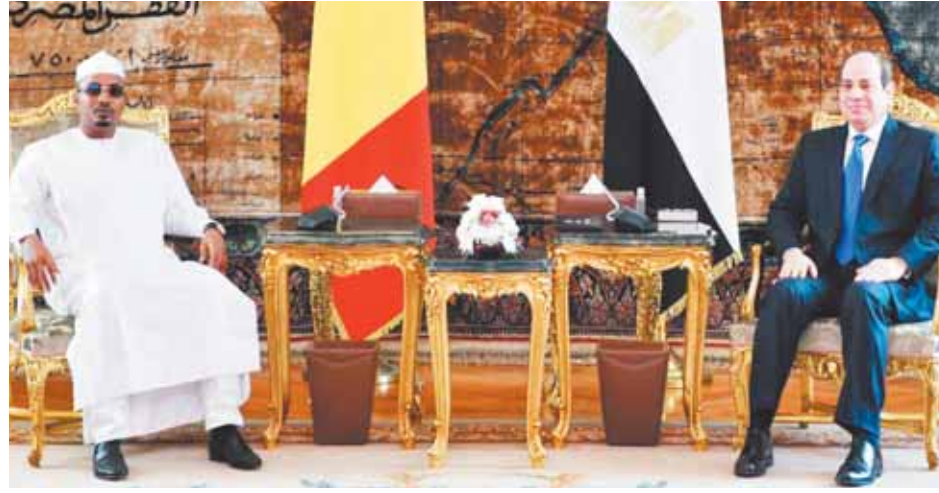
الرئيس السيسي خلال استقباله رئيس المجلس العسكري التشادي

الحساسة التي تمر بها تشاد وفي العديد من المجالات، خاصة في مجال دعم القدرات، وذلك لمساعدتها على تحقيق تطورات العلاقات ودعم أطر التعاون المشترك بين البلدين الشقيقين على مختلف الأصعدة. وذكر المتحدث الرسمي أن اللقاء شهد التباحث حول سبل الدعم قدم بالتعاون الثنائي بين البلدين، خاصة من خلال إعادة تفعيل اللجنة الثنائية المشتركة، حيث أكد السيد الرئيس اهتمام مصر بمواصلة التعاون مع الأشقاء في التشادية في مختلف التخصصات، فضلاً عن تعظيم التعاون الأمني والاستخباراتي والعسكري لمكافحة تحدي الإرهاب والفكر المتطرف. كما تم خلال اللقاء مناقشة عدد من القضايا الإقليمية ذات الاهتمام المشترك، خاصة تطورات الأوضاع في ليبيا الشقيقة وتداعياتها الإقليمية على صعيد الأمن والاستقرار، حيث أوضح المتحدث الرسمي أن مصر قد تم التوافق على ضرورة تضمين العملية السياسية في ليبيا آلية واضحة لخروج كافة العناصر الأجنبية المسلحة المتواجدة هناك من مرتزقة وإرهابيين وتطهيرات متطرفة، مع ضمان عدم تسرب الأسلحة والعتاد العسكري لديهم إلى المحيط الإقليمي.