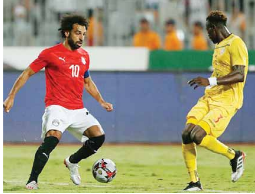
محمد صلاح يشارك بقوة في مران المنتخب

في سياق متصل، انضم الثالث المحترف في الدوري الإنجليزي محمد صلاح ومحمود حسن تريزيجيه، إلى تدريبات الفراغنة، بعدما اطمأن الجهاز الطبي على نتيجة المسحة الطبية والتي جاءت سلبية للثلاثين، كما خضعا لاختبار طبي من أجل الاطمئنان على حالتها البدنية. وحظف صلاح الأنظار فور ظهوره في مران الفراغنة، حيث جمعت حوارات ثنائية على هامش