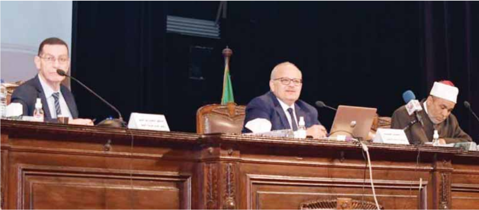
د. الخشت رئيس جامعة القاهرة يتوسط د. وجدى زين الدين والشيخ جابر طابع خلال المحاضرة

رئيس الجامعة يدعو لنظرة كلية تتجاوز النظرة الجزئية والأحادية للدين إلى العلوم الإنسانية والاجتماعية والطبيعية