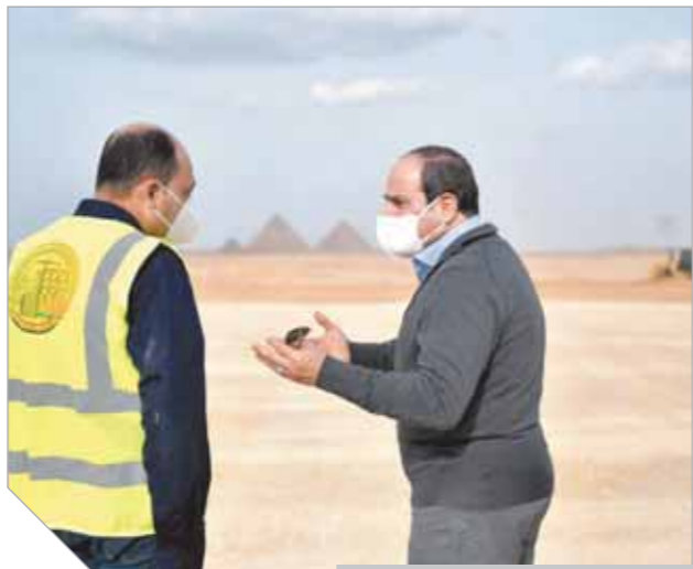
الرئيس خلال تفقده الطريق الدائرى بالجيزة