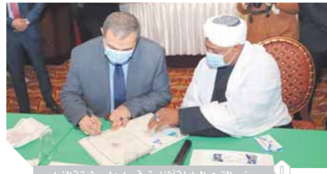
وزير القوى العاملة أثناء توقيعها على وثيقة الزواج

وأحداث التنمية البشرية المطلوبة، كما قدم محافظ أسوان الشكر لكل من أسهم وقدم هذا النموذج المشرف للعمل الاجتماعى المكامل والتعليم وخاصة بيت الزكاة والصدقات المصرى وجمعية الأورمان ما يعكس الفكر التنويرى للجهود الحكومية والاجتمعية معاً.