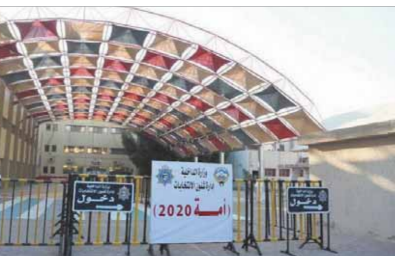
المملات الانتخابية وربما قطعت خيط التواصل مع بعض الناخبين، خصوصاً كبار السن من الحسنيين ومن الأكثر التزاماً بالاشتراطات الصحية، مشيرة إلى أن المرشحين ومن خلال وسائل التواصل غير المباشرة، توقعون أن تخفض نسبة المشاركة عما كانت عليه في الانتخابات ٢٠١٦. وأوضح الأوساط أن المرشحين بدأوا في التركيز على عملي الانتماء المجتمعي وتخصير الجماع، مبيّنة أن تخفيض الميزانية من أهم عناصر النجاح لأنّ هناك ناخبين مترددين في حضور أي مراكز الاقتراع، خشية جائحة «كورونا»، وربما عدم وجود تباعد، اجتماعي والتزام بالاشتراطات بين الناخبين في أجن الاقتراع.

تصدير الخام فقط، ويشير المراقبون إلى أن الاقتصاد وأزماته سيستمران النازق في الانتخابات الراهنة، إذ يتطلع الناخبون لعمدرة وجود مخرج ما يسهل البلاد حالها من تداعيات أزمة كورونا التي أثرت على كثير من القطاعات وأبرزها قطاع المشاريع الصغيرة والسحابة والسفر وغيرها من الأنشطة، ويضيق المراقبون قد هناك كساد أمام الحكومة بحسب أطروحات بعض المرشحين قد تبدو منطقية في مقدمتها فرض الضرائب التصاعدية التي يمكنها أن تعنى الحكومة عن المساس بالدمع والبدلات المقمنة للموظفين، وأكادوا أهمية وقف الهدر في مؤسسات الدولة ومحاربة الفساد بجديّة أكبر وإعادة النظر بشأن رسوم إيجارات أملاك الدولة التي يقطنها من وراء شغلها كبار التجار مكاسب ضخمة مقابل إيجارات ضئيلة سنوياً.