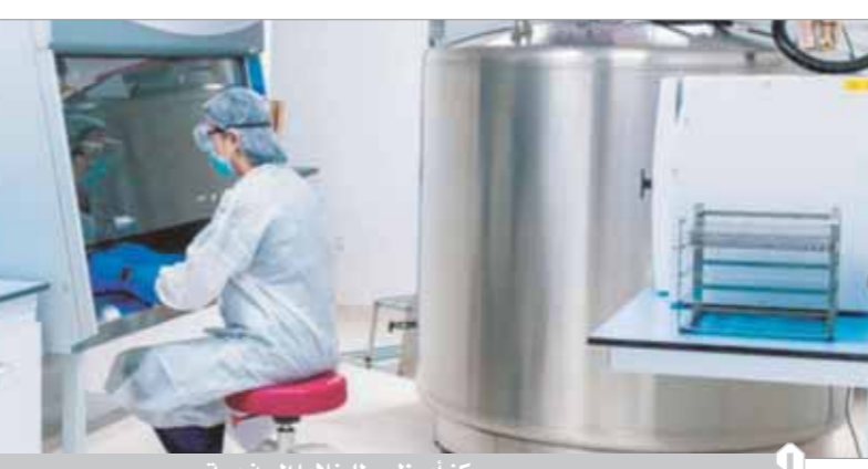
مركز أبوظبي للخلايا الجذعية

ضخ الخلايا الجذعية المستخلصة إلى مجرى الدم، حيث تعد الخلايا المدمرة وعلى مدار أسبوعين وستأنف إنتاج خلايا الدم السليمة غير الخبيثة.