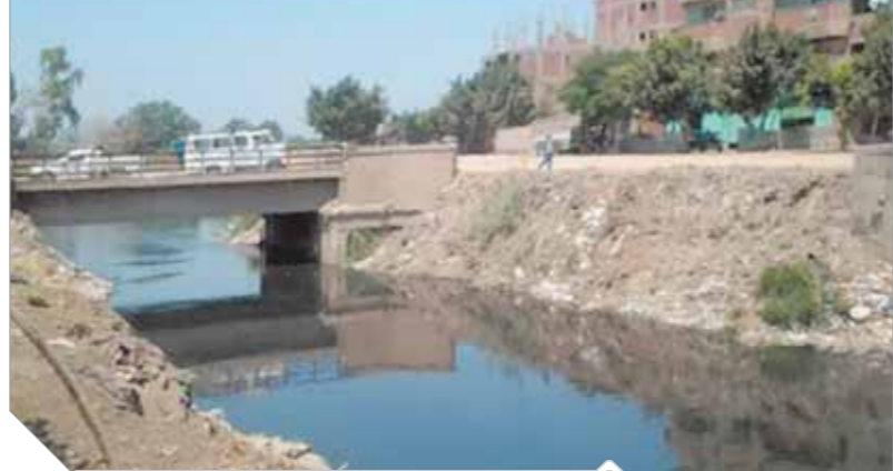
القمامة تتحاصر مصرف بحر البقر