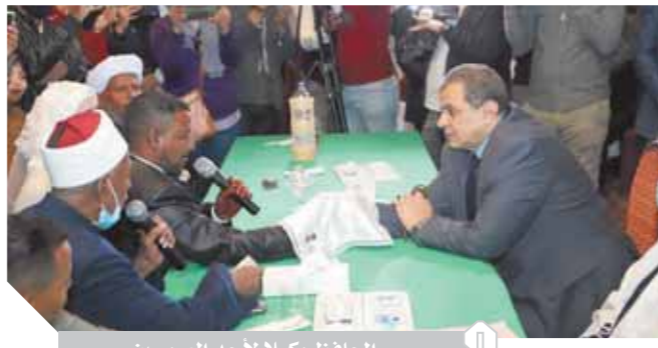
المحافظ وكيلا لأحد العروسين