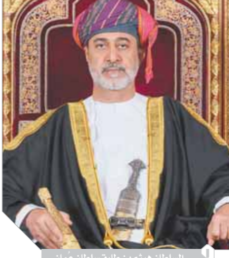
السلطان هيثم بن طارق سلطان عُمان

لقد وضع المفوق له السلطان قابوس بن سعيد - طيب الله ثراه - منذ بداية عصر النهضة العمانية الحديثة في سبعينيات القرن الماضي، أسساً راسخة لبناء مجتمع عماني خال من العنف والإرهاب، كما وضع مبادئ ثابتة لسياسة السلطة الخارجية إزاء الصراعات والنزاعات، تقوم على الحياد وعدم الانحياز لأي طرف وفتح الحوار سبيلاً لتسوية الأزمات، حتى أصبحت عُمان وسيطاً مقبولاً ومرحباً به في الوسط الدولي، وهو ما يعزز من مكانتها لتصبح منارة الأمن والسلام والاستقرار عربياً وإقليمياً ودولياً. ومنذ تولي السلطان هيثم بن طارق سلطان عُمان، مسئولية الحكم في ١١ يناير ٢٠٢٠م، حرص على التأكيد أكثر من مرة على أنه سوف يسير على خطى السلطان الراحل في مختلف الاتجاهات داخليا وخارجيا لاستكمال مسيرة البناء والتنمية والعطاء، حيث قال في خطاب توليه الحكم: «على الصعيد الخارجي، فإننا سوف نرسم خطى السلطان الراحل مؤكداً على الثوابت التي احتفظها لسياسة بلادنا الخارجية القائمة على التعايش السلمي بين الأمم والشعوب وحسن الجوار وعدم التدخل في الشؤون الداخلية للغير واحترام سيادة الدول وعلى التعاون الدولي في مختلف المجالات، كما سنبقى كما عهدنا العالم في عهد المغفور له بإذن الله السلطان قابوس بن سعيد بن تيمور، داعين ومساهمين في حل الخلافات بالطرق السلمية وبالدبلوماسية الجهد لإيجاد حلول مرضية لها بروح من الوفاق والتفاهم».