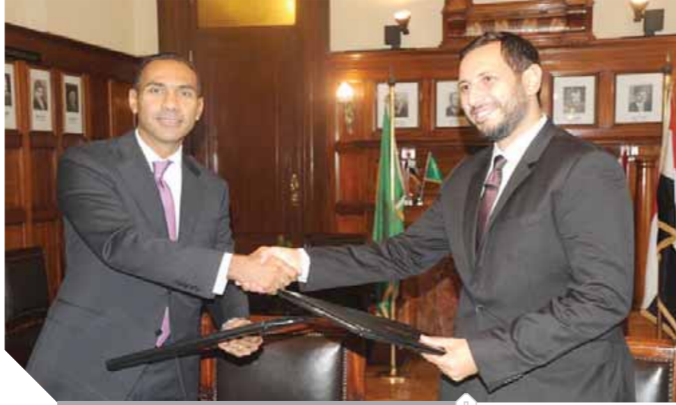
قيادات بنك مصر وجامعة سيناء خلال توقيع البروتوكول

كما يشتمل البروتوكول على توفير شاشات الدفع الإلكتروني والتي تمكن الجامعة من دفع الضرائب والتأمينات وكذلك جاري وضع الترتيبات اللازمة لإنشاء فرع داخل الجامعة لخدمة السادة أعضاء هيئة التدريس والموظفين والطلاب. وأوضح أن البنك لديه خطة للتوسع في مجال التحصيل الإلكتروني عبر شبكة الانترنت، وتفعيل خدمات الدفع والتحويل الإلكتروني، والتحول تدريجياً إلى المجتمع اللائقي من خلال نشر ثقافة التعامل ببطاقات الدفع الإلكتروني موضحاً أن البنك يستقطب الكوادر المتميزة للعمل بالبنك، وذلك تعزيزاً لتقدرته التنافسية وحفاظاً على ريادته بين البنوك بالقطاع المصرفي المصري، ويحرص البنك على تنمية وتطوير الكوادر من الشباب ممن يمتلكون الجدارات الأساسية والفنية بالمستوى المطلوب للوظائف المصرفية. موضحاً أن البنك حقق طفرة في مجال بطاقات الدفع الإلكتروني كأول بنك مصري يقدم تلك النوعية من الخدمات للعملاء، والتي عمل على تطويرها من خلال استخدام أحدث النظم العالمية في مجال تكنولوجيا المدفوعات الإلكترونية والتي أهدته للحصول على شهادة تأمين البيانات والمعلومات DSS-PCI كأول بنك مصري يحصل على تلك الشهادة، ومن ضمن المنتجات المصرفية التي توسع البنك فيها منتجات بطاقات الدفع الإلكتروني بأنواعها المختلفة.