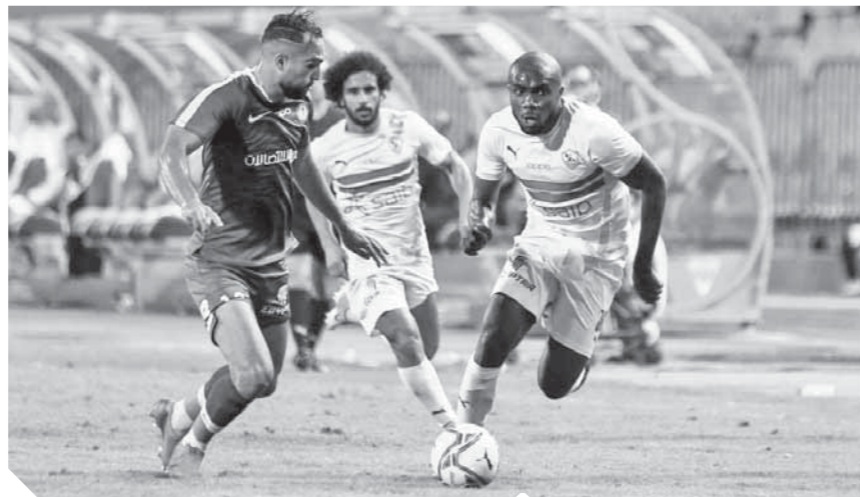
الزمالك يسعى لعبور عقبة سموحة