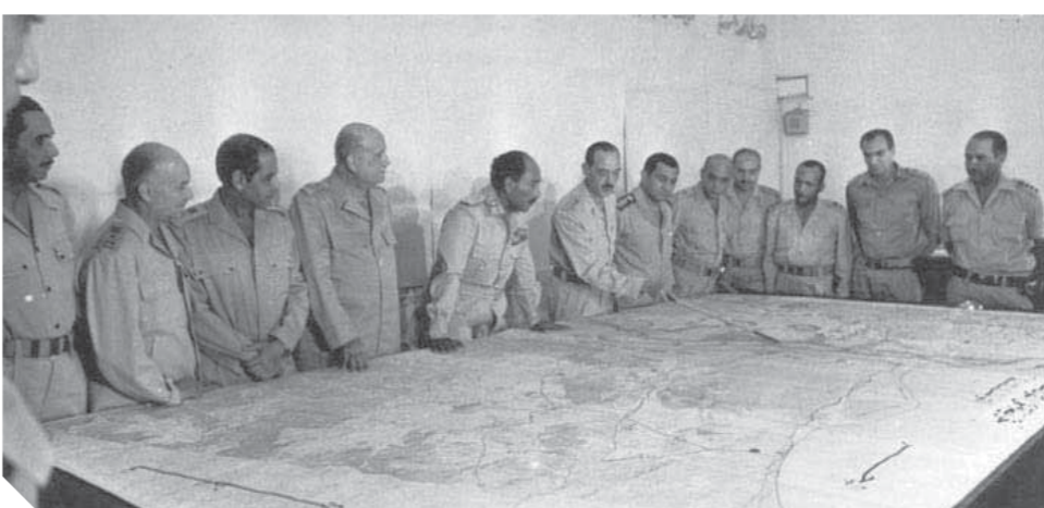
السادات بطل الحرب وسط قادة الجيش فى غرفة العمليات أثناء المعركة

هذه الملحة الوطنية التي أعادت الكرامة للجيش المصرى، وتثبيتت في خسائر فادحة للعدو وجعلته يتدقق مرارة الهزيمة والذل على يد المقاتل المصرى، نحن بحاجة إليها الآن من جديد، حتى نستطيع أن نبني وطننا، ونواصل مسيرة الإصلاح والتشبيد. وقد أكد على ضرورة التحلى بهذه الروح، الدكتور محمد مختار جمعة، وزير الأوقاف، حيث قال إن المصريين فى أكتوبر المجيد ١٩٧٣ التقوا خلف قيادتهم وجيشهم وشروطهم، فتحقق النصر المبين. وقال «جمعة»، خلال خطبة الجمعة بمسجد سيدى أحمد البدي بطنطا، «نحتاج إلى روح أكتوبر فى مواجهة أهل الشر والفساد، لاستكمال معركة التنمية فى مصر، مشدداً على ضرورة أن يضرب بيد من حديد على كل من يحاول أن يعرقل مسيرة الوطن.