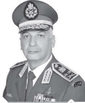
الفريق أول محمد زكى

بعث الفريق أول محمد زكى القائد العام للقوات المسلحة وزير الدفاع والإنتاج الحربى ببرقية تهنئة للرئيس عبدالفتاح السيسى رئيس الجمهورية القائد الأعلى للقوات المسلحة، بمناسبة ذكرى نصر أكتوبر المجيد، جاء فيها: السيد الرئيس عبدالفتاح السيسى رئيس الجمهورية - القائد الأعلى للقوات المسلحة يسعدنى أن أهني سيادتكم بمناسبة الاحتفال بالذكرى السابعة والأربعين لنصر أكتوبر المجيد، الذى حققه رجال القوات المسلحة فى يوم خالد سيظل فى تاريخنا الوطنى مبعث فخر واعتزاز لشعب مصر بقواته المسلحة ورجالها.