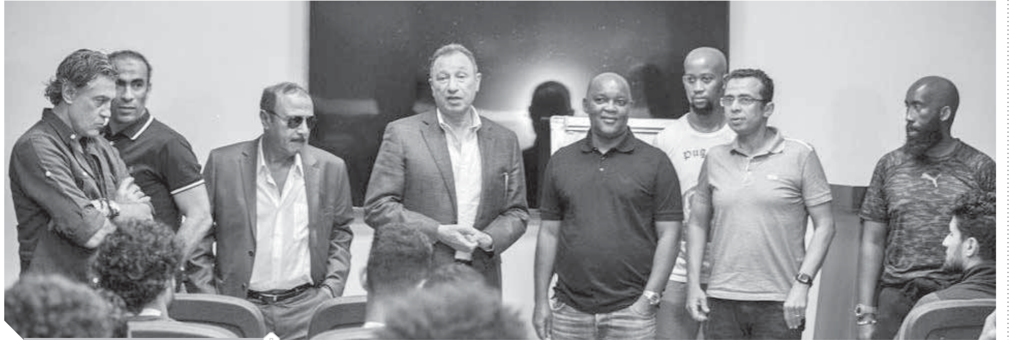
الخطيب وموسيماني في جلسة مع لاعبي الأهلي

●● وعليه ترفع لجنة الوفد بالقاهرة مطالبها للسيد محافظ القاهرة بصضرورة وأهمية إنشاء كوبري للمشاة عند ناصية المستشفى القبطي لحماية أبائنا والمواطنين وأبنائنا ومنطقة الظاهر والفجالة وحرساً على حياتهم وسلامتهم وأصبحت المنطقة بعد توسعها بالغة الخطورة في عملية العبور، وتناشده شخصياً أن يعيد مظلة محطة النقل العام أمام المستشفى القبطي ليستظل بها المواطنون آمنين محافظين على سلامتهم.. حفظ الله بلادنا وأبنائها في سلامة وأمان دائم.