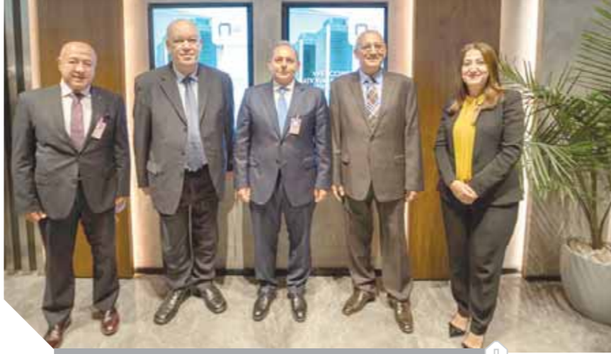
قيادات الأهلي وشركة الطيران خلال افتتاح الاستراحة