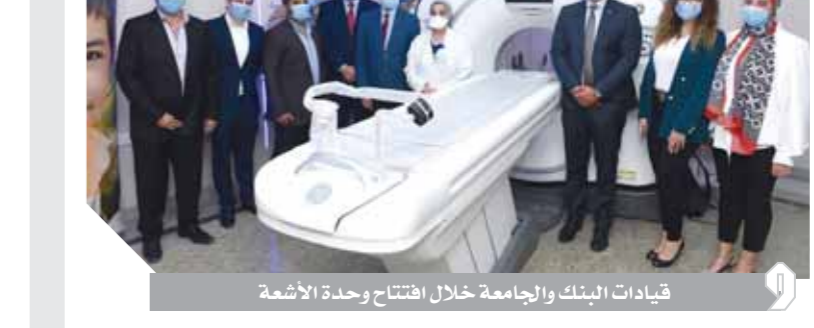
قيادات البنك والجامعة خلال افتتاح وحدة الأشعة المقطعية