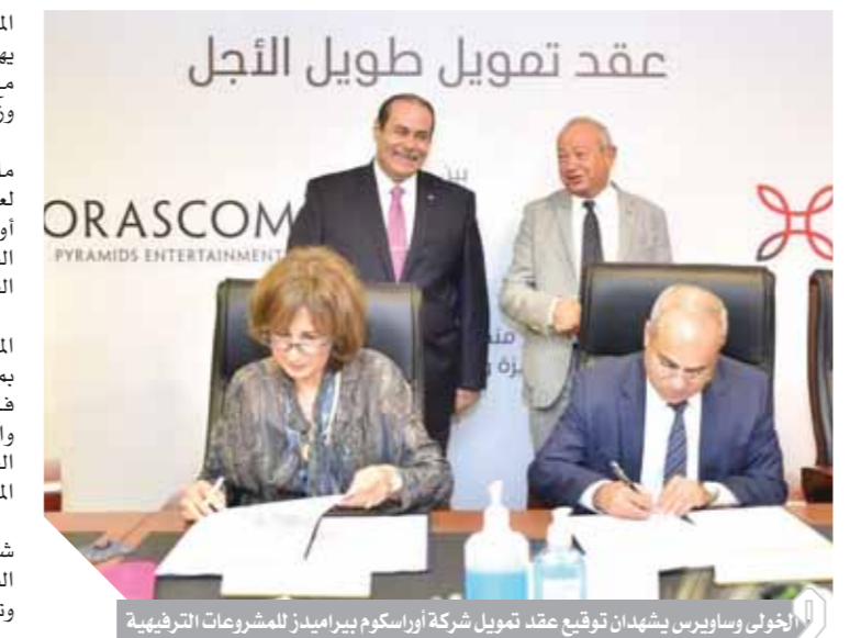
الأجلى وساوريس يشهدان توقيع عقد تمويل شركة أوراسكوم بيراميدز للمشروعات الترفيهية

المشروعات الاستراتيجية داخل السوق المصرية، حيث يهدف المشروع إلى تطوير منطقة الأهرامات لتتماشى مع استراتيجية الدولة لتطوير المقاصد السياحية وزيادة عدد السائحين في الفترة القادمة. وأوضح أن القطاع المصرفي المصري يمتلك ملاءة مالية جيدة جداً، جعلته قادراً على مساندة الاقتصاد لعبور العديد من الظروف الاستثنائية التي مر بها في أوقات مختلفة، مشيراً إلى أن البنوك المصرية تمتلك من السيولة التقديرية ما يمكنها من تمويل كافة المشروعات القومية والخاصة، حتى في أوقات الأزمات. أكد أن قطاع السياحة يعد أحد أهم القطاعات المؤثرة في الاقتصاد، وأحد أهم مصادر الدخل القومي بما توفره من عائدات دولية سنوية إذ توفر السياحة فرصاً للعمل في العديد من المجالات كالغذاء، والمطاعم، وشركات السياحة، وتعد مصر من أهم دول العالم في مجال السياحة نظراً لما تمتلكه من تلك الآثار المرموقة في العالم أجمع. أوراسكوم بيراميدز للمشروعات الترفيهية إحدى شركات مجموعة أوراسكوم للاستثمار القابضة هي الشركة المناقصة مع المجلس الأعلى للأثار على تطوير وتقديم خدمات داخل منطقة الأهرامات بالجيزة.