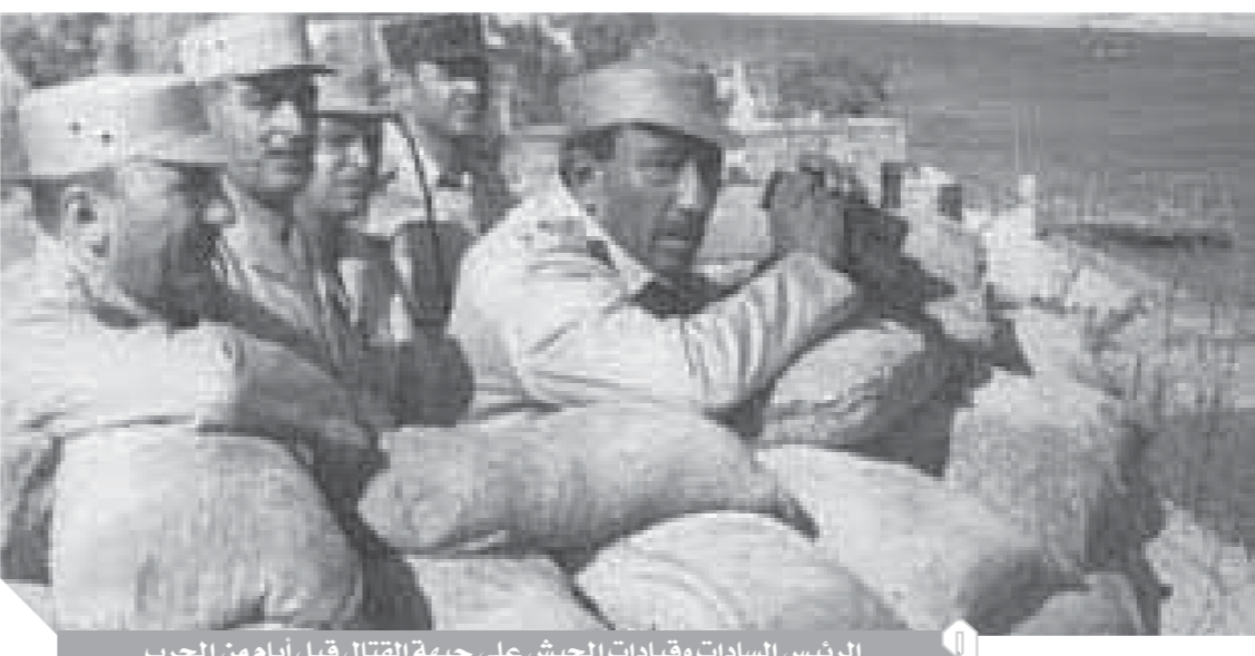
الرئيس السادات وقيادات الجيش على جبهة القتال قبل أيام من الحرب