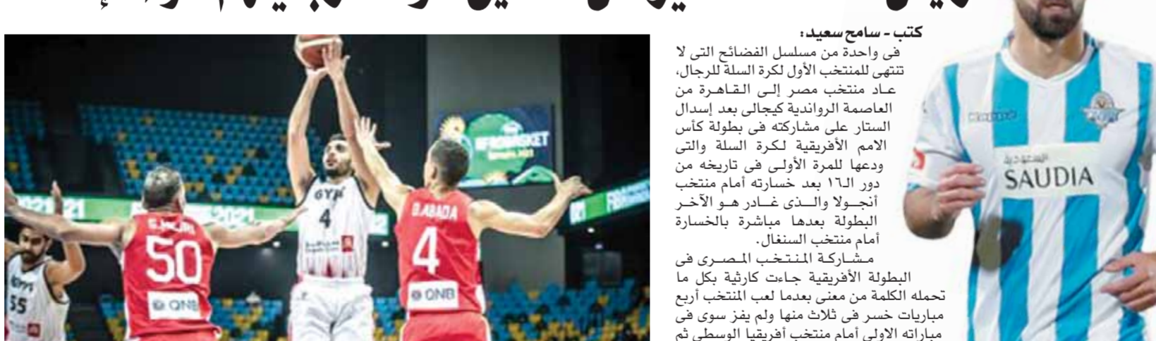
منتخب مصر لكرة السلة ضد أنجولا