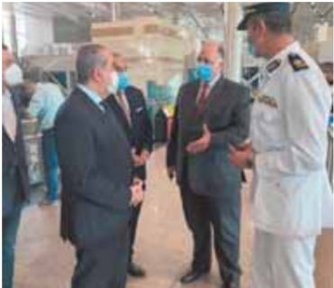
وزير الطيران يستمع لشرح حول الإجراءات الاحترازية من رئيس القابضة للمطارات

بداية من دخول المطار وحتى إنهاء إجراءات سفرهم مرورا بكابنترات المحطة والجوازات ومنطقة تجميع الحقائق وكذا الأسواق الحرة، واستراحات الخدمة المميزة ونقاط التأمين المختلفة ومكتب الحجر الصحي وغيرها.