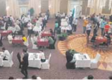
بطولة سينيت الدولية للشطرنج