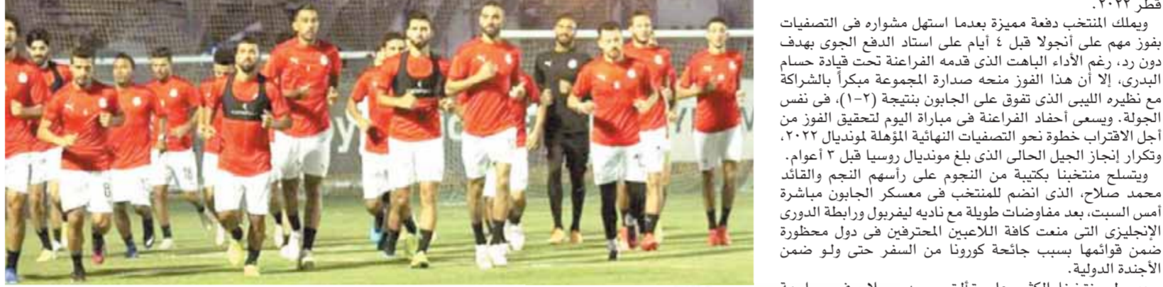
المنتخب يتسلح بروح قتالية للفوز على الجابون