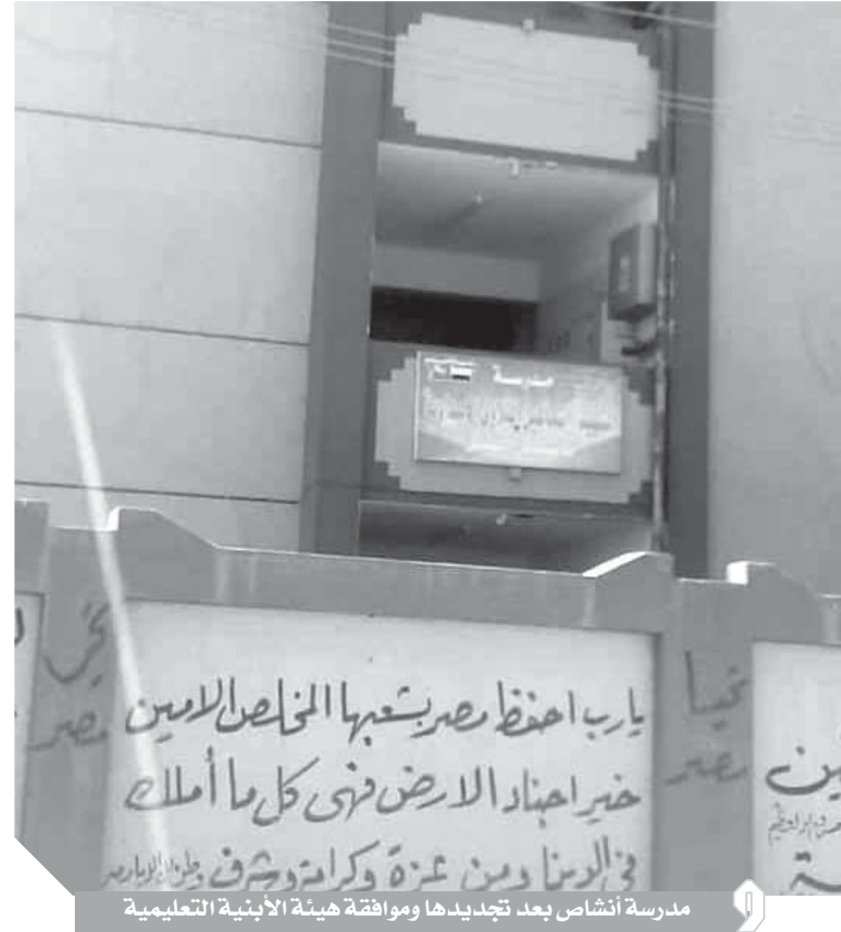
مدرسة أنشاص بعد تجديدها وموافقة هيئة الأبنية التعليمية