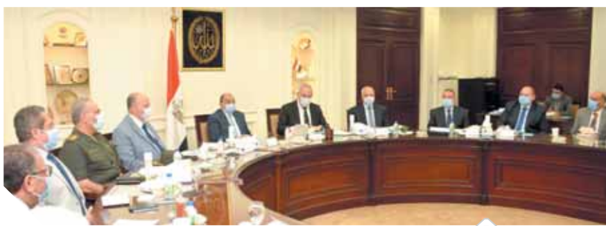
جانب من اجتماع لجنة الضبط العمراني

أكد محمود شعراوي وزير التنمية المحلية أن الدولة لا تسعى إلى وقف البناء نهائياً والإضرار بالعمالة. لكنها تهدف إلى ضبط منظومة العمران وإزالة التشوهات التي حدثت في مصر خلال السنوات الماضية. جاء ذلك خلال اجتماع موسع لمتابعة مشروعات إعداد الدراسات التخطيطية والبيئية والمخططات الاستراتيجيية المعتمدة لضبط العمران بمدن «القاهرة- الجيزة- الإسكندرية» بحضور الدكتور عاصم الجزار، وزير الإسكان والمرافق والمجمعات العمرانية، واللواء محمود شعراوي، وزير التنمية المحلية، واللواء خالد عبدالعال، محافظ القاهرة، واللواء أحمد راشد، محافظ الجيزة، واللواء محمد الشريش، محافظ الإسكندرية، واللواء إيهاب الفار، رئيس الهيئة الهندسية للقوات المسلحة وعدد من قيادات الوزارتين والمحافظات.