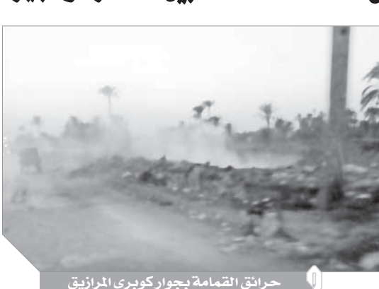
حرائق القمامة بجوار كوبري المرازيق

على طريقة أنا ومن بعدى الطوفان تعرض المنطقة الواقعة بين حدود محافظتى القاهرة والجيزة لحرائق وتلال قمامة وأدخنة تهدد الصحة العامة للمواطنين ولا أحد يتكلم، فالمنطقة التي تتحدث عنها تقع في الجهة الغربية لكوبري المرازيق الذي يربط بين محافظة الجيزة متمثلة في مركز الدبرشين وبين محافظة القاهرة متمثلة في حي التين ومساحة هذه المنطقة تصل إلى حوالي ٥٠٠ متر ويتم إلقاء القمامة بها دون النظر إلى الطرق التي سيتم بها التخلص فيها من هذه القمامة ورغم أن هذا الطريق طريق حيوي يمر من خلاله يوميا مئات السيارات المملّكة والنقل وأتوبيسات الشركات ويتعرض المارة لسحابة من الأدخنة تسبب أمراض واختلاطات خصوصا للمرضى الذين يعانون من تنقب في التنفس أو الأمراض الصدرية ولا تُدرى من هو صاحب هذه الفكرة الشيطانية والذي وقع عليه اختيار هذا المكان بالذات دون أن يحاسبه أحد، فالمكان لا توجد جهة محددة تحاسب من يقوم بإلقاء