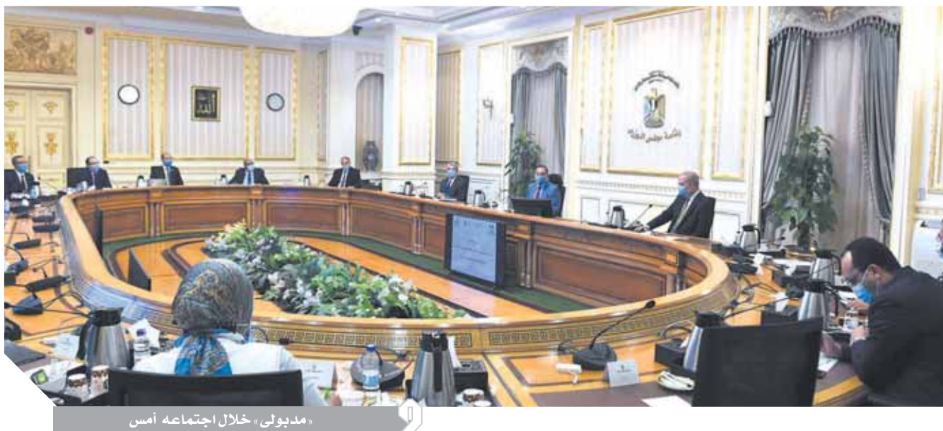
مدبولي، خلال اجتماعه أمس

ويحت مدبولي عدداً من مشروعات التعاون بين مصر والأردن والعراق، وذلك في إطار متابعة نتائج القمة الثلاثية التي استضافتها العاصمة الأردنية عمان، وشارك فيها الرئيس عبدالفتاح السيسي. وطلب «مدبولي» تكتيف الاتصالات بين الوزراء ونظرائهم في البلدان الثلاثة، الأردن والعراق ومصر، والاتفاق على عدد من المشروعات للعمل على عرضها على القيادة السياسية في مصر والأردن والعراق، لافتاً إلى أن هناك فرصة تاريخية تجسد في دعم القيادة السياسية في هذه الدول لمساعدتي تحقيق التكامل بين الدول الثلاث، من أجل الدفع قدماً بمجالات التعاون، حضر الاجتماع وزراء الكهرباء، والبترو، والتموين والتجارة، والتربية والتعليم، والزراعة والتجارة والصناعة. وقال المستشار نادر سعد، المتحدث الرسمي باسم رئاسة مجلس الوزراء، إنه تم خلال الاجتماع استعراض المشروعات المقترحة، لكي يتم المضي قدماً في تنفيذها بأسرع وقت ممكن، بهدف تعزيز