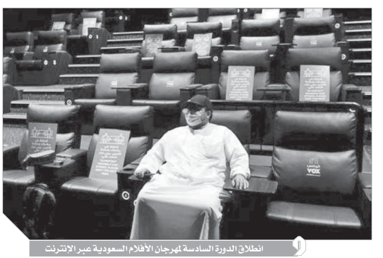
الافتتاحية للدورة السادسة لمهرجان الأفلام السعودية عبر الإنترنت