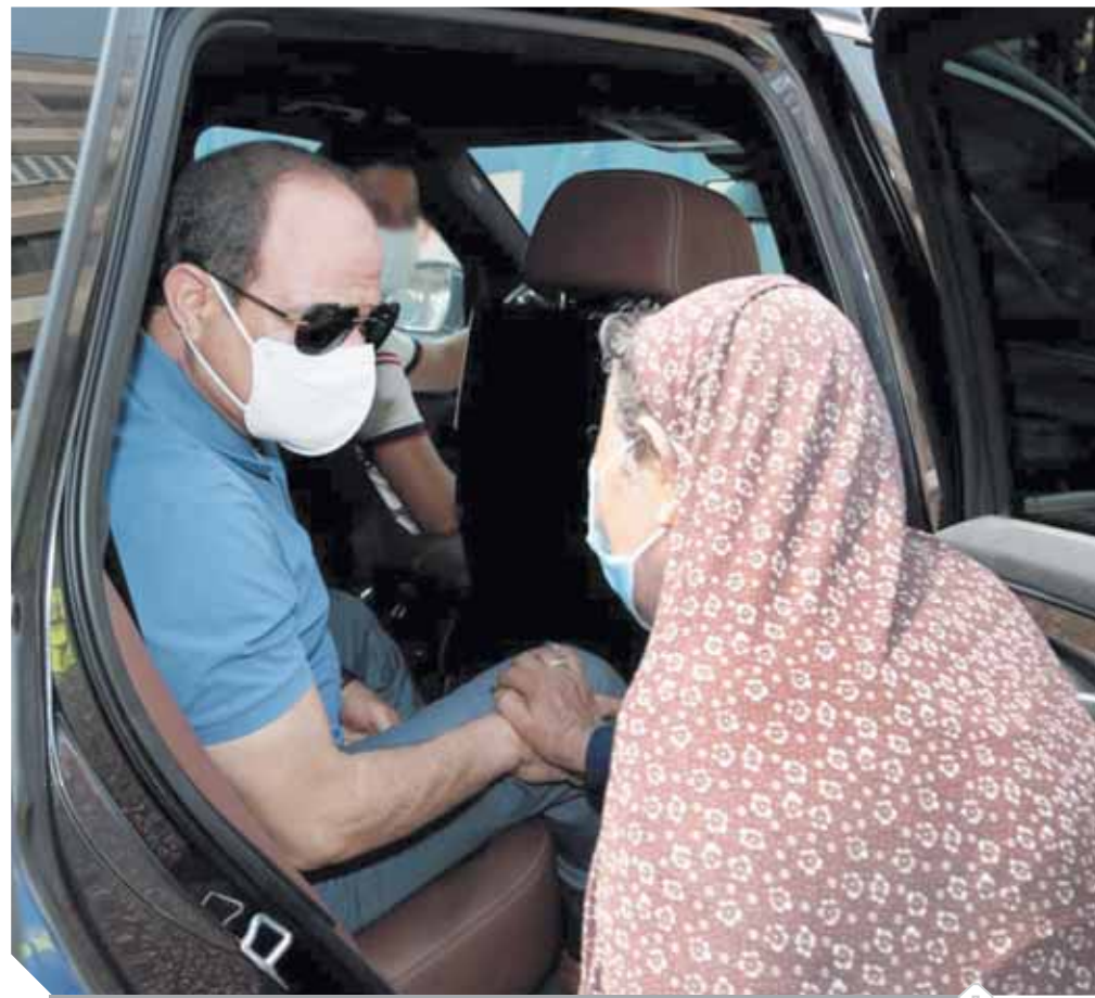
الرئيس يتحدث إلى مواطنة مسنة خلال جولته التفتيشية

لا أحد يجادل أن الهيئات الثلاث الخاصة بالإعلام وجودها طيباً للنص الدستورى ولكن التجربة أثبتت فشلها الذريع طوال الأعوام الماضية، ولم تحقق على الأرض أى إنجازات حقيقية تذكر، ولا تستطيع ملاحقة الدولة المصرية فى كل الإنجازات والإعجازات التى تحققت خلال السنوات الماضية، والحقيقة المرة أن هذه الهيئات تعمل فى إطار محور واحد وهو كل ما يتعلق بالصحف القومية أو التلفزيون الحكومية، ورغم ذلك لا تزال المشكلات والمصائب موجودة، ويوم تمت عودة وزير الإعلام،