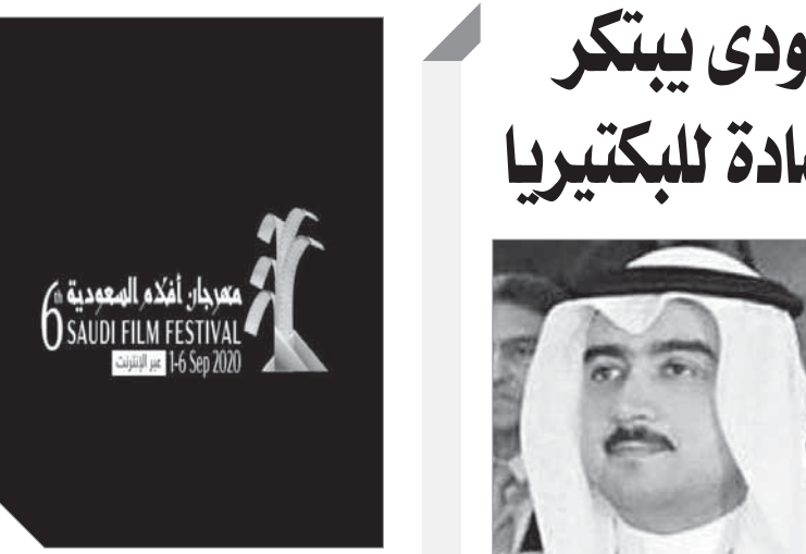
انطلاق مهرجان أفلام السعودية