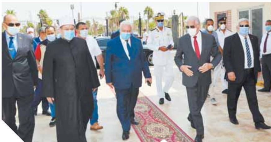
جمعة، وفودة، خلال افتتاح المساجد الجديدة

أكد الوزير أنه تم بناء أكثر من مائة مسجد بمحافظة جنوب سيناء، حتى الآن وقال إن اليوم يمثل عرساً كبيراً في محافظة جنوب سيناء، حيث يتم افتتاح سبعة مساجد جديدة، تم بناؤها على طراز معماري فريد. وأشار الوزير إلى أن خدمة بيوت الله وعقارها ضيوف الرحمن شرف لا يدانيه شرف، مشدداً على ضرورة التفاني في العمل وبدل أقصى الجهد فيه ابتغاء مرضاة الله. أشار الوزير إلى أن افتتاح المساجد يتم في إطار