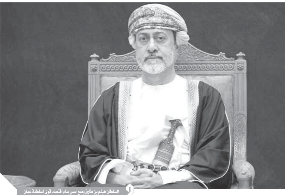
السلطان هيثم بن طارق يرفع يمينه على بناء اقتصاد قوي لسلطنة عُمان

إشادات عالمية بالجهود العُمانية لتعزيز الحرية الاقتصادية وتحسين بيئة الأعمال مؤسسة أمريكية: رؤية «عُمان ٢٠٤٠» تساعد في تطوير اقتصاد السلطنة