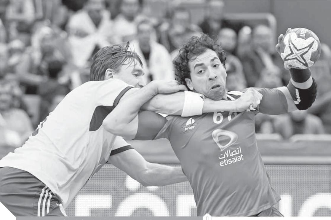
منتخب مصر جاهز لخوض المونديال

مصر مبلغ ٣ مليارات و ٢٠٠ مليون جنيه من أجل تطوير الصالات المخصصة لاستضافة مباريات البطولة. وتستضيف ٧ صالات أخرى تدريبات المنتخبات المشاركة بالمونديال، ويجري العمل على قدم وساق لتطويرها في المرحلة المقبلة، ووصلت لجنة تفتيش من الاتحاد الدولي لمتابعة سير الاستعدادات لاستضافة البطولة، وأيضاً حفل القرعة تحديداً. وأثنى الدكتور حسن مصطفى، رئيس الاتحاد الدولي، على فكرة نقل مراسم القرعة من متحف الحضارات بالقاهرة إلى منطقة الأهرامات التاريخية مؤكداً أنه واثق