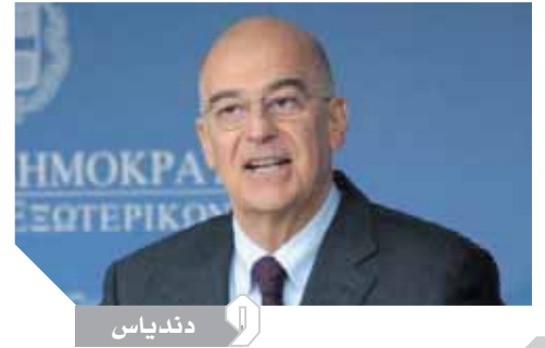
كتب - محمد شروك

والحقوق والتجارة والآداب، ومن المقرر انتهاء المرحلة الثانية للتنسيق وتبدأ بعد إعلان نتيجة المرحلة الأسبوع القادم أعمال تحويل الطلاب بين الكليات المناظرة وغير المناظرة وفقاً لقواعد التوزيع الجغرافى. ومن المقرر أن يعتمد الدكتور خالد عبدالغفار وزير التعليم العالى نتيجة المرحلة يوم الثلاثاء القادم ويعين الوزير الأعداد التى تم قبولها بالكليات والمعاهد والحد الأدنى لقبول بكل كلية ومعهد، كما يحدد الوزير موعد بدء المرحلة الثالثة والأخيرة لقبول باقى الناجحين فى الثانوية العامة بعد أدنى ٥٠٪ ومن المقرر أن تنطلق المرحلة الأخيرة بعد الانتهاء من تحويل طلاب المرحلة الأولى والثانية ويتم تأجيل إعلان نتيجة المرحلة الأخيرة لحين قبول الطلاب الناجحين فى امتحانات الدور الثانى للثانوية العامة.