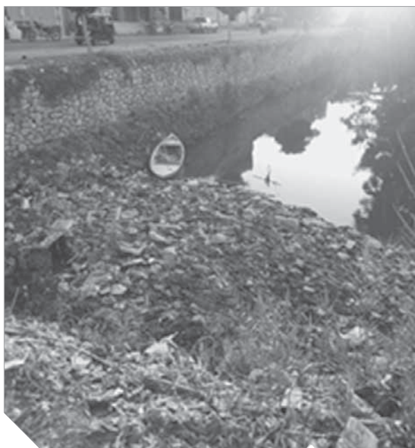
ميت سلسيل في الدقهلية تعاني الإهمال