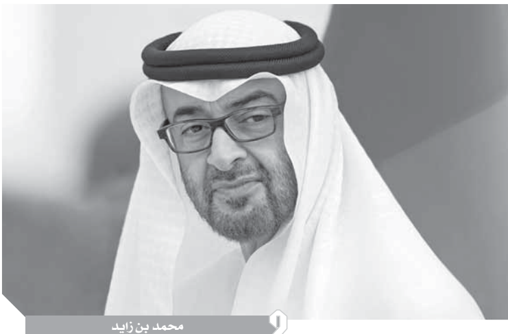
محمد بن زايد

مزايا تنافسية مثل الطاقة والبتروكيماويات والمعادن وسلاسل التوريد والخدمات اللوجستية، إضافة إلى استهداف القطاعات التي تعزز الاكتفاء الذاتي مثل المياه والزراعة والغذاء. وسنعمل أيضا على خلق القيمة من قطاعات جديدة واعدة مثل التكنولوجيا الحيوية، والصحة، والصناعات الدوائية». وأشار إلى دور جائحة كوفيد-19 في تسريع التحول الرقمي الذي يتماشى مع المهمة الأساسية للقمة العالمية للصناعة والتصنيع في الاستفادة من الإمكانيات التي يتيحها العصر الصناعي الرابع. وأشار إلى انعكاسات الجائحة على سلاسل التوريد العالمية، لافتا إلى أهمية دور التقنيات المتقدمة في حماية وتعزيز سلاسل التوريد، وشدد على أن استخدام تقنيات «الذكاء الاصطناعي» يمكن أن يسهم في إحداث نقلة نوعية كبيرة في أداء قطاعات الصناعة والتصنيع، كما يوفر وتوظيف «البيانات الضخمة» رؤى دقيقة تتيح اتخاذ قرارات فورية لمعالجة التغيرات، في