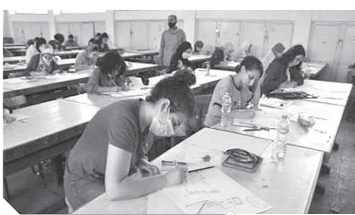
اختبارات القدرات شرط أساسي للالتحاق بالكلية من الكليات

وفي الحقيقة الواقع يؤكد أن لبنان أصبح مسرحاً دولياً للفساد، بينما يستشري، وقد نستيقظ على وضع كارثي جديد، لأن هناك خلافاً في موازين القوى، ولم يستطع أحد حسم أي صراع لصالحه بشكل كامل، ولا يمكن فصل ما يجري في لبنان عن السياق الإقليمي العام، هناك أزمات كبرى تعانيها كل مراكز القوى، إسرائيل تواجه مشكلات اقتصادية وضباباً فساد، وموسم الانتخابات الأمريكية يقرب وسط أزمات اقتصادية، واضطرابات عنصرية، والانتخابات التي فرضها انتشار فيروس كورونا، من الممكن تظلم أظافر حرب الله وحصاراً اقتصادياً، لكن المواجهة مع لن تتم، في ظل هذا الخلل، فقط تتم في حالة التسوية النهائية لكل صراعات المنطقة، أما الآن، فنحن في مرحلة المحاربين بالوكالة عن الآخرين، وبالطبع ماكرون لم كل ذلك ويستثمره ويوجد اللعب على تناقضاته.