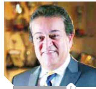
كتب - زكى السعدنى

ينتهى اليوم موعد تنسيق المرحلة الثانية لقبول الناجحين والمعاهد، يبدأ مركز الحاسب الألى بجامعة القاهرة فى توزيع طابو المرحلة على الأماكن الشاغرة أمامهم بالكليات والمعاهد وعددهم ٢٥٤ ألفاً و٥١٢ طابو وطالبة منهم ١٩٤ ألفاً و٤٤ طابو وطالبة من العلمى و٦٠ ألفاً و٦٤ طابو وطالبة من الأدبى يقف الحد الأدنى لقبول عند ٢١٧.٥ درجة بنسبة ٧٧.٤٠٪ للعلمى و٢٧٨ درجة بنسبة ٦٧.٨٠٪ للأدبى. يرشح طلاب العلمى والأدبى للقبول فى أكثر من ٣٥٠ ألف مكان خال بالجامعات والمعاهد، وأعلن السيد عطا رئيس قطاع التعليم بوزارة التعليم العالى انتظام سير إجراءات إدخال الطلاب لرغباتهم عبر موقع التنسيق الإلكتروني دون أية شكاوى، موجهاً