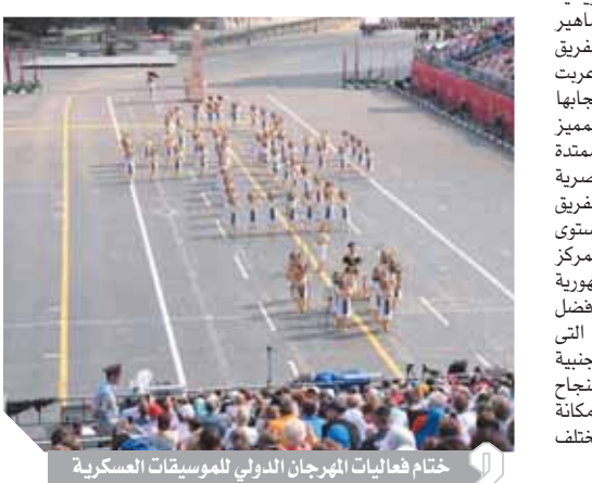
ختام فعاليات المهرجان الدولي للموسيقى العسكرية

معالم الحضارة المصرية والمقاصد التاريخية والسياحية في مصر، وصاحبها الجماهير والجاليات المصرية والعربية بموسيقى الفريق المصري خلال فعاليات المهرجان، كما أعربت الجماهير الروسية عن إعجابها بمشاركة الفريق المصري بزيه الفرعوني المميز الذي يعبر عن عراقة مصر وحضارتها الممتدة عبر التاريخ. وللموسيقى العسكرية المصرية سجل حافل يمتد عبر التاريخ، حيث حقق الفريق السيمفوني العسكري شهرة واسعة على المستوى الدولي، كما حصد الفريق المصري المركز الثاني على مستوى العالم بعد فريق جمهورية الصين الشعبية في مسابقة التصويت لأفضل فريق، وذلك نتيجة للمساندة الواسعة التي قدمتها الجماهير المصرية والعربية والأجنبية خلال فعاليات المهرجان، ما يعكس النجاح الواسع الذي حققه الفريق المصري ويؤكد مكانة الموسيقى العسكرية المصرية في مختلف المحافل الدولية.