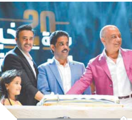
قيادة مرسيليا خلال الاحتفال وبيدو شريف حليو في المنصف

كتب- الأمير يسرى- ياسمين سعيد بدأ من اليوم، تبدأ البنوك عمليات رد شهادات قناة السويس لأصحابها البالغ قيمتها نحو ٦٤ مليار جنيه وذلك بعد انتهاء أمد هذه الشهادات الذي كان محدوداً بـ ٥ سنوات. وتبدأ البنوك الأربعة المصدرة للشهادة وهي الأهلي المصري، ومصر، والقاهرة، وقناة السويس، في رد قيمة الشهادات مع استحقاقها من يوم الخميس المقبل وعلى مدار أسبوعين من الشهر الجاري بحسب موعد إصدار كل شهادة. قبل ٥ سنوات وتحديداً في سبتمبر ٢٠١٤ تم طرح شهادات قناة السويس بفائدة ١٢% قبل أن يتم زيادتها إلى ١٥.٥% في نوفمبر ٢٠١٦ «إبان تحرير سعر الصرف» مقسمة على ثلاث شرائح بواقع ١٠ جنيهات لطلبة المدارس، و١٠٠ جنيه، والف جنيه، وذلك لتلبية لدعوة الرئيس عبدالفتاح السيسي بمشاركة المصريين في المرحلة الأولى من حفر قناة السويس الجديدة. القيمة النقدية للشهادات التي حان وقت استحقاقها تبلغ نحو ٦٤ مليار جنيه وهو الأمر الذي يطرح تساؤلاً مفاداه: (أين ستذهب هذه المليارات ولائ قناة استثمارية ستجده؟) بطبيعة الحال، إن العقار سيكون إحدى المنصات