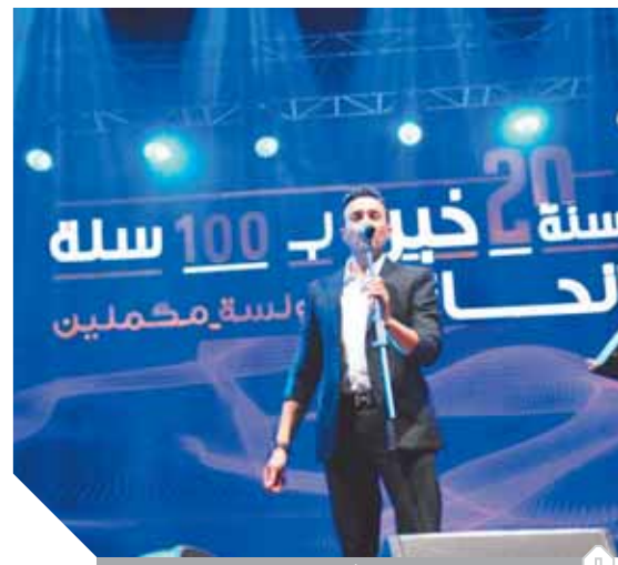
الفنان صابر الرباعي متألقا في احتفالية مرسيليا