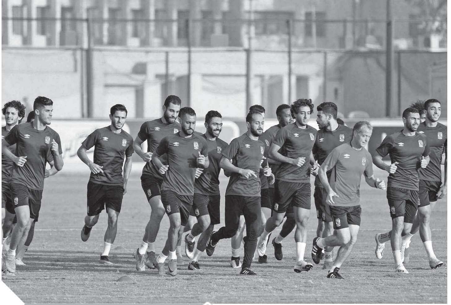
الأهلى يستعد لمواجهة كانو سيورت بطل غينيا الاستوائية