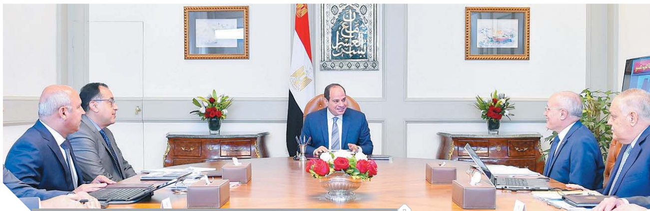
الرئيس السيسى خلال اجتماعه مع رئيس الوزراء ووزى الإنتاج الحربى والنقل

التفديتى لعدد من المشروعات المشتركة الجارى تنفيذها، التى تشمل تطوير المزلقات ومحطات السكة الحديد، وتصنيع وتوريد عربات سكة حديد للركاب ونقل البضائع وتوليد القوى.