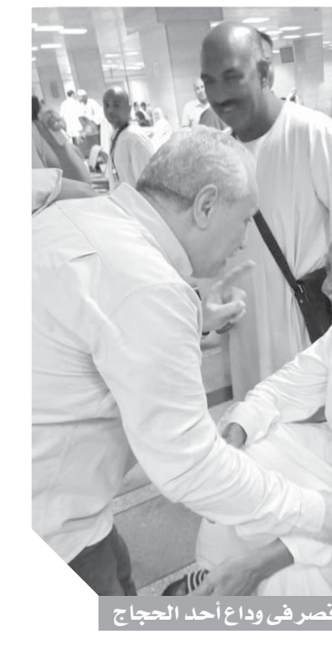
محافظ الأقصر فى وداع أحد أفواج الحجاج

ودع المحافظ مصطفى أهم محافظ الأقصر، أمس، آخر أفواج رحلات حجاج بيت الله الحرام المغادرين من مطار الأقصر الدولى إلى مطار جدة الدولى، لأداء مناسك الحج فى الأراضي المقدسة بالملكة العربية السعودية.