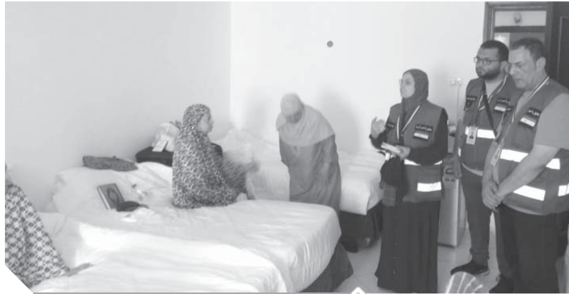
افتتاح أول عيادتين للبيحة الطبية لتقديم الخدمات للحجاج

كتب- هشام الهلوتى ونرمين حسن ونغم هلال وأحمد جمال: