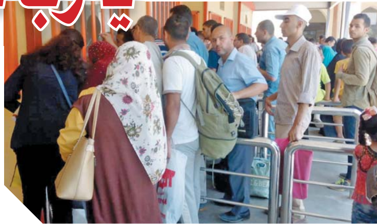
رفعت هيئة سكك حديد مصر درجة الاستعداد عند درجتها القصوى مع بدء العد التنازلى لإجازة العيد، أصبح الأمل في