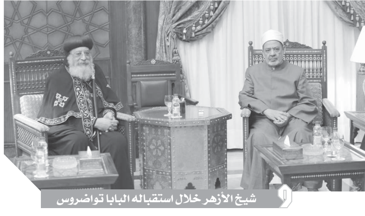
شيخ الأزهر خلال استقباله البابا تواضروس

أكد الإمام الأكبر الدكتور أحمد الطيب شيخ الأزهر أن العلاقة بين الأزهر والكنيسة تمثل نموذجاً يجب استنساخه فى نشر القيم والأخلاق النبيلة ومواجهة العادات والتقاليد الاجتماعية السيئة.