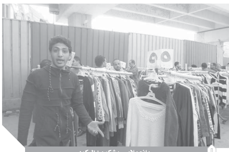
بائع ملابس يشكو من الركود