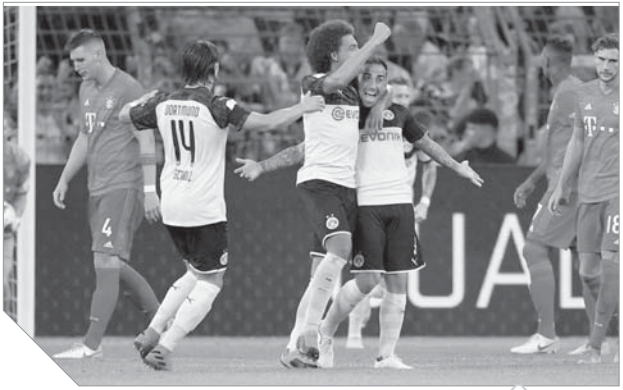
احتفالات لاعبي بوروسيا دورتموند باللقب