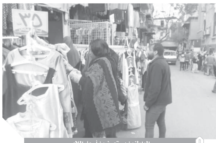
المواطنون يستعرضون أسعار الملابس