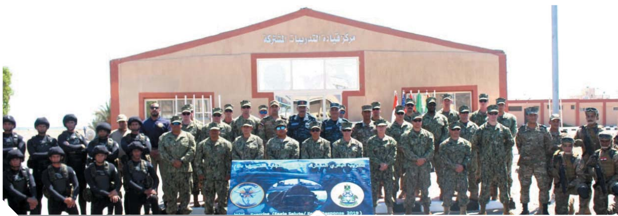
جانب من المشاركين في التدريب البحري المصري - الأمريكي

وإشتمل تدريب «استجابة النسر ٢٠١٩» على العديد من الأنشطة التي بدأت بتطعيم معرض للأسلحة للقوات المشتركة والمعدات الطبية لأطقم القوات الخاصة، كذلك تنفيذ بيان عملي على اقتحام السفن المشتبه بها، والتي لم تتمثل للتعليمات الصادرة لها. كما تم التدريب على تبادل النداءات بين السفن، كذلك عقد محاضرات نظرية وعملية توضيحية دور أطقم الإسعافات الأولية والإسعافات التكتيكية القتالية أثناء العمليات. كما نفذت عناصر القوات الخاصة البحرية تدريبات مشتركة تضمنت حق الزيارة والتفتيش