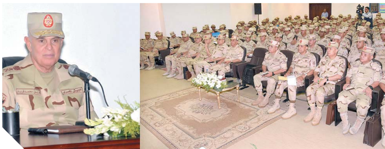
رئيس الأركان خلال المشروع التكتيكي «فجر ٣»

أظهر المشروع المستوى الراقى الذي وصلت إليه العناصر المشاركة من مهارات ميدانية وقتالية عالية، والسرعة في اكتشاف وتحديد الأهداف الميدانية والتعامل معها ونقل الفريق محمد فريد تحيات وتقدير الرئيس عبدالفتاح السيسي رئيس الجمهورية القائد الأعلى للقوات المسلحة، والفريق أول محمد زكي القائد العام للقوات المسلحة وزير الدفاع والإنتاج الحربي لرجال المنطقة المركزية العسكرية، وتناشد رئيس أركان حرب القوات المسلحة العناصر المشاركة بالمشروع في أسلوب تنفيذ المهام المكلفين بها، وكيفية اتخاذ القرارات في المواقف التكتيكية الطارئة التي يمكن التعرض لها أثناء إدارة العمليات. حضر المرحلة عدد من كبار قادة القوات المسلحة.