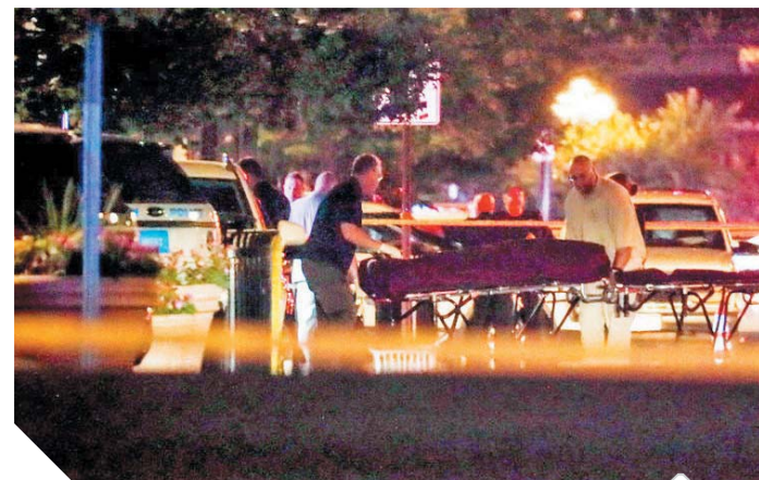
نقل جثث ضحايا مذبحه منطقة دايوتون بولاية أوهايو

المجزة المتحدة الأمريكية، وأسر الضحايا، سائلاً المولى عز وجل أن يلهمهم الصبر والسلوان، وأن يُعِنَّ على المصابين بالشفاء العاجل.