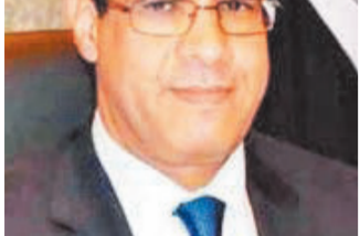
بدر عبد العاطى

أكد بدر عبد العاطى وزير الخارجية والهجرة وشؤون المصريين بالخارج أن استئناف عمل معبر رفح يتوقف على توفير الإدارة الإسرائيلية للانسحاب من المعبر والقبول بعودة السلطة الفلسطينية لإدارته، وكذلك تدمير قواعد لفض الاشتباك لتسهيل عمل المنظمات الأممية وتوفير الحماية للعاملين فى المجال الإنسانى. وأكد د. عبد العاطى على ضرورة الضغط على إسرائيل لفتح المزيد من المعابر الإسرائيلية مع القطاع فى إطار تحمل مسؤولياتها باعتبارها القوة القائمة بالاحتلال، مشدداً على أهمية الوقف الفورى لإطلاق النار والالتزام بقرارات الشرعية الدولية واحترام القانون الدولى والقانون الدولى الإنسانى، مع استمرار الجهود الدولية لدخول أكبر كميات من المساعدات الإنسانية لسكان قطاع غزة.