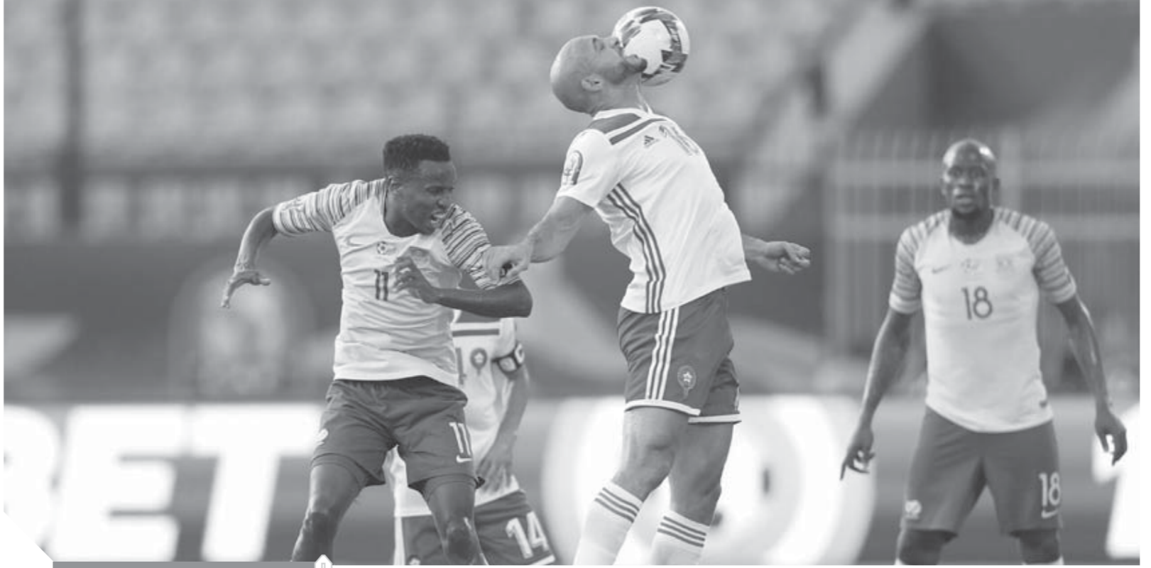
المغرب يبحث عن الانتصار الرابع له