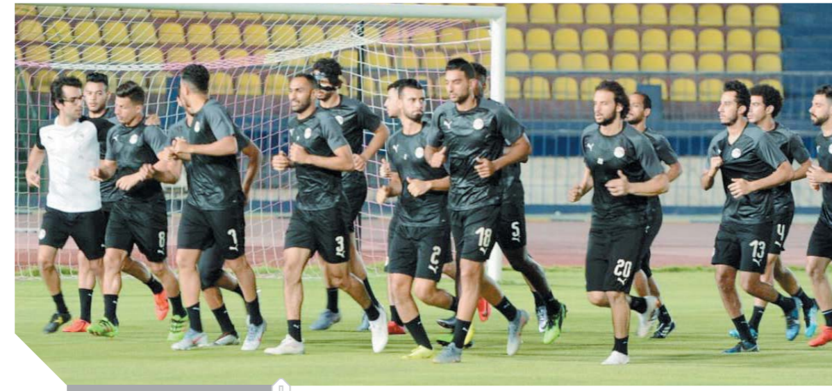
تدريب منتخب مصر

الليلة.. «الأسود» تتأهب لافتراس «السنجاب» .. والسنغال يخشى مفاجآت أوغندا