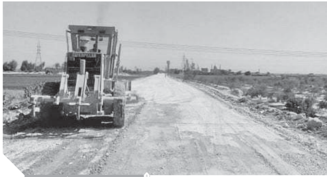
الاهمال يضرب شبكة أسيوط