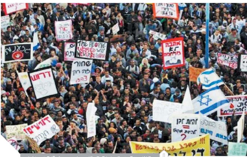
تظاهرات واعتصامات تتجاذب مبادئ وطرقات إسرائيل

الاعتداء على جندي من أصل إثيوبي، وكذلك اللقاء أحد المراكز الطبية الإسرائيلية بدم تبرعت به نائبة من أصل إثيوبي في الكنيسة في القمامة. ووفقاً للمسئول في الوكالة اليهودية يعقوب ويتشتاين، الذي زار إثيوبيا عام ١٩٤٩، ومطالب بالاستعجال بهجرة