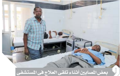
بعض المصابين أثناء تلقي العلاج في المستشفى

رفعت وزارة الخارجية الألمانية الحظر عن السفر إلى منطقة طابا بمحافظة جنوب سيناء كما حدثت إرشادات السفر والسلامة بالنسبة إلى مصر. وقالت السفارة الألمانية إن هذا التحديث يأتي في إطار المراجعات المنتظمة لإرشادات السفر والسلامة التي تقدم للمواطنين الألمان على أساس البيانات والمعلومات المتوافرة لدى أجهزة الأمن الألمانية، وأوضحت السفارة في بيان إنه لم يعد هناك تحذير من السفر إلى منطقة طابا.