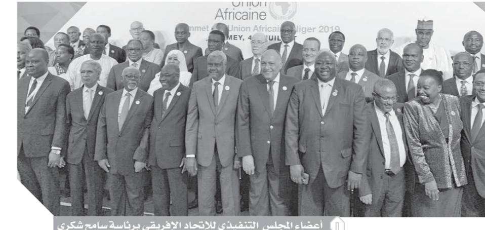
اعضاء المجلس التنفيذى للاتحاد الإفريقى برئاسة سامح شكرى

كتب: تهانى شعبان أكد وزير الخارجية سامح شكرى، أن الدول الإفريقية سوف تحتفل بإطلاق منطقة التجارة الحرة القارية الإفريقية، باعتبارها مشروعاً قارياً رائداً بكل ما يحمله من طموحات وتحديات، وما يفتح من آفاق جديدة للتكامل والتنمية فى ربوع القارة، وشدد على أنه لا خيار أمام الدول الإفريقية سوى تحرير التجارة إذا ما أرادت تحقيق نقلة نوعية فى معدلات التنمية. جاء ذلك خلال الكلمة التى ألقاها فى الجلسة الافتتاحية للمجلس التنفيذى للاتحاد الإفريقى.