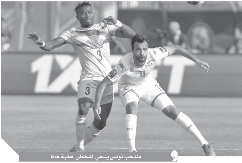
منتخب تونس يسعى لتخطي عضة غانا