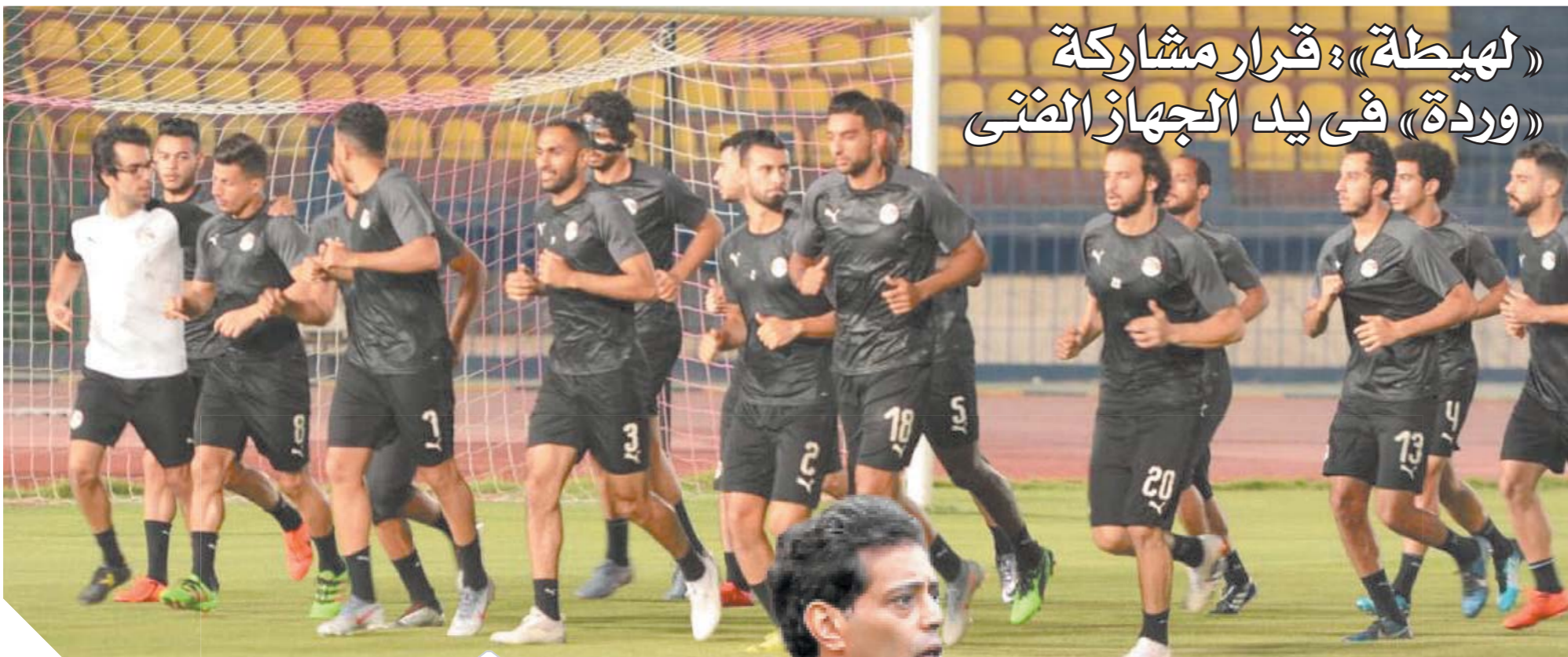
استعدادات جادة لمواجهة منتخب الأولاد