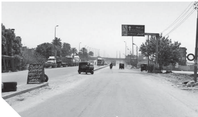
بني سويف اعتمد بالطرق الرئيسية وأهمها الفرعية