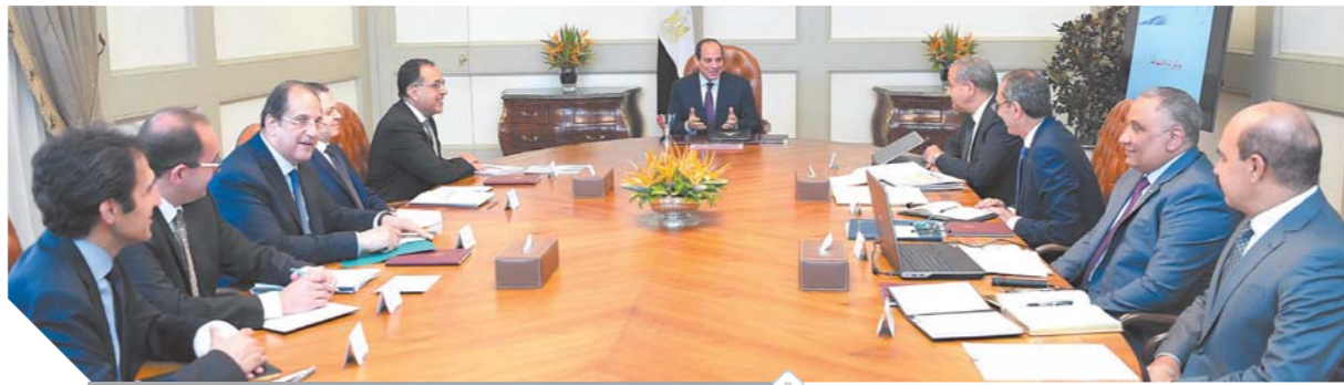
السيسي خلال رئاسته لاجتماع وزاري مصغر برئاسة الجمهورية أمس

طالب الرئيس عبدالفتاح السيسي الأجهزة المعنية، بمواصلة بذل الجهد لتوفير السلع الأساسية، وتلبية احتياجات المواطنين بالكميات والأسعار المناسبة، وإتاحتها في مختلف محافظات الجمهورية، وذلك من خلال تعزيز جهود ضبط الأسواق، وتشديد الرقابة على منافذ البيع، لمكافحة الممارسات الاحتكارية وضبط الأسعار، فضلاً عن تعزيز دور أجهزة حماية المستهلك، لضمان توفر مختلف السلع للمواطنين بوجود عالية. جاء ذلك خلال الاجتماع الوزاري الذي عقده الرئيس السيسي أمس برئاسة الجمهورية، حضره الدكتور مصطفى