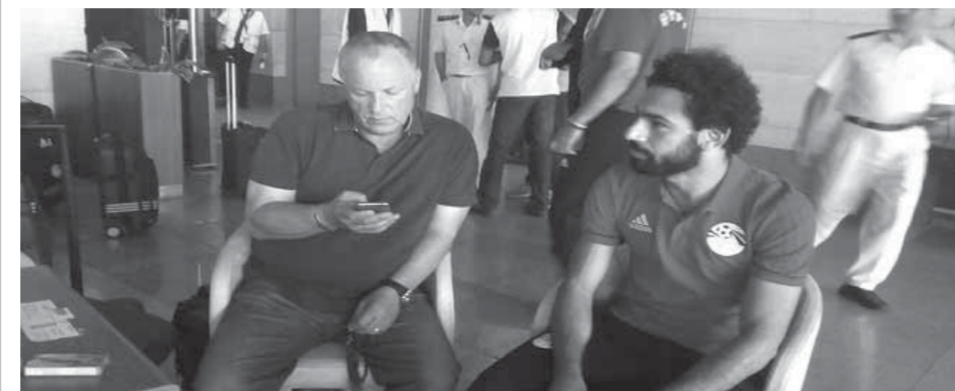
أبوريدة ومحمد صلاح

يكن منطقيًا رفض دعوته، وفى النهاية صلاح لاعب محترف وصاحب عقلية رافعة تمكته من الفصل بين ما يحدث داخل الملعب وخارجه، ولن يتأثر بهجوم الإعلام الإنجليزي عليه، واتحاد الكرة سيسانده بقوة حتى يعبر الأزمة. الغريب أن اللاعب كتب تغريدة على تويتر قال خلالها إن الأمر لم ينته وهو ما يؤكد أنه يسعى لكشف الأخطاء التي تعرض لها المنتخب رغم الضغوط التي يتعرض لها، والدليل الرد على التغريدة من جانب العاملين فى الاتحاد وبعض رجال أبوريدة والتي نالت سخم الجماهير على مواقع التواصل الاجتماعى.