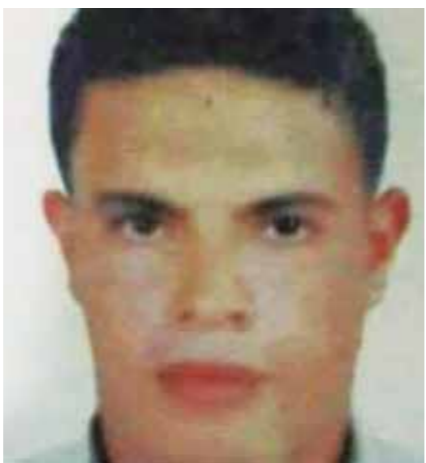
قاتل فتاة كفر الزيات