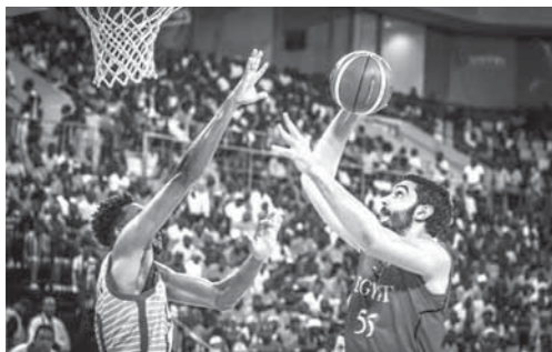
منتخب السلة تأهل للتصفيات النهائية المؤهلة لكأس العالم