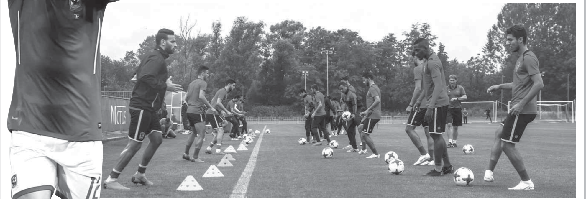
الأهلى يخوض تدريباته فى معسكر كرواتيا