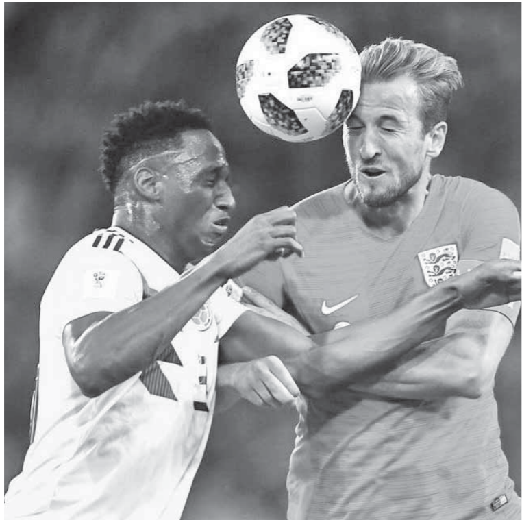
هاري كين تألق في المباراة

صدارته لقائمة هدافي بطولة كأس العالم بتسجيله هدف الافتتاح في شباك كولومبيا من ركلة جزاء في الدقائق العشر الأولى من الشوط الثاني. وأصبح في رصيد هاري كين ستة أهداف بعد هدفه في كولومبيا، ويلحق به مهاجم منتخب بلجيكا روميلو لوكاكو بأربعة أهداف مشاركاً مع كريستيانو رونالدو نجم منتخب ألب البرتغال بأربعة أهداف أيضاً قبل أن يودع البطولة. وحقق «كين» أرقاماً مميزة بهذا الهدف، حيث يعتبر أول لاعب إنجليزي يسجل ستة أهداف في نسخة واحدة من كأس العالم هو وجاري لينيكير، بجانب أول لاعب يسجل في ست مباريات متتالية لمنتخب الأسود الثلاثة منذ تومي لاوتون عام 1939. وحصل هاري كين على جائزة رجل المباراة من الاتحاد الدولي لكرة القدم «فيفا».