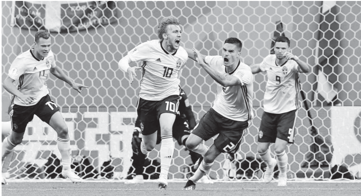
السويد يبحث عن مفاجأة جديدة أمام إنجلترا

وأضاف مدرب سويسرا: «منتخب السويد كان جيداً للغاية، وتمكن من الصمود حتى تغلب علينا».