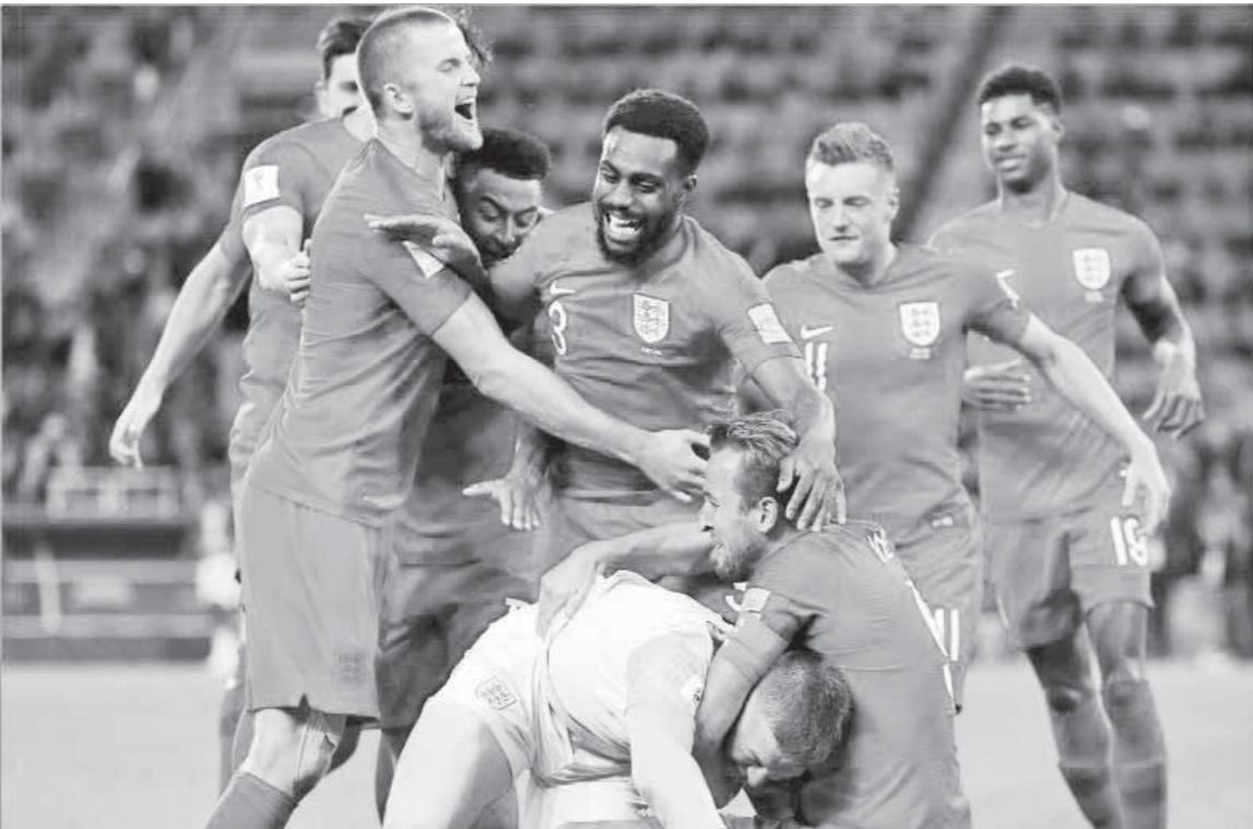
فرحة لاعبي إنجلترا بالفوز على كولومبيا

صدارته لقائمة هدافي بطولة كأس العالم بتسجيله هدف الافتتاح في شباك كولومبيا من ركلة جزاء في الدقائق العشر الأولى من الشوط الثاني. وأصبح في رصيد هاري كين ستة أهداف بعد هدفه في كولومبيا، ويلحق به مهاجم منتخب بلجيكا روميلو لوكاكو بأربعة أهداف مشاركاً مع كريستيانو رونالدو نجم منتخب ألب البرتغال بأربعة أهداف أيضاً قبل أن يودع البطولة. وحقق «كين» أرقاماً مميزة بهذا الهدف، حيث يعتبر أول لاعب إنجليزي يسجل ستة أهداف في نسخة واحدة من كأس العالم هو وجاري لينيكير، بجانب أول لاعب يسجل في ست مباريات متتالية لمنتخب الأسود الثلاثة منذ تومي لاوتون عام 1939. وحصل هاري كين على جائزة رجل المباراة من الاتحاد الدولي لكرة القدم «فيفا».