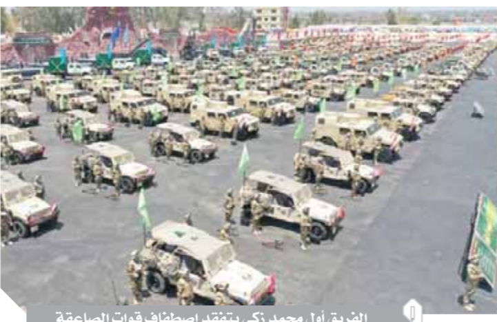
الفريق أول محمد زكى يتفقد اصطفاف قوات الصاعقة

فى أعلى درجات الاستعداد القتالى من أجل حماية حدود مصر فى ظل ما تواجهه من تحديات خلال الفترة الحالية. وقام الفريق أول محمد زكى بالمرور على القوات المصطفة للاطمئنان على مدى جاهزيتها وقدرتها على تنفيذ كل المهام والوقوف على مستوى الكفاءة الفنية والقتالية للأسلحة والمعدات، كما تقدم معرضاً لمهمات ومعدات الوقاية من فيروس كورونا فى إطار استراتيجية الوقاية التى تنفذها القوات المسلحة على كل الأفرع والتشكيلات والوحدات.