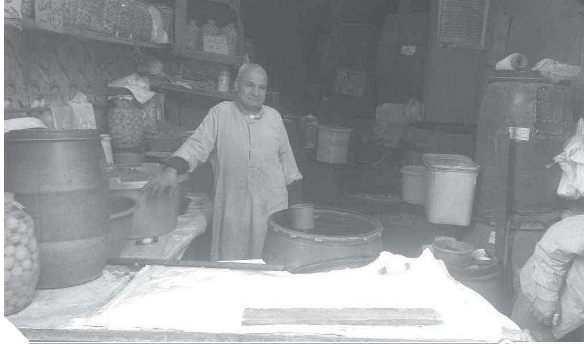
الإقبال على شراء «المخلل» يزداد خلال فترة أيام شهر رمضان الكريم

يقول معندكش طرشي الماية بتاعته مش مألحة؟، لذا وفي رمضان الماضي بدأ الحل بيع مياه الطرشي قليلة الملح «دى لمرضى الضغط بتبقى كويسة». وأشار إلى أن الإقبال على شراء «المخلل» يزداد خلال فترة أيام شهر رمضان الكريم، أكثر من الأيام العادية بمختلف أنواعها، فهناك من يطلب ليمون وزيتون ومخلل مشكل وهناك من يشتري بالبريق كيلو، أو شطبة بـ ١٠ جنيهات، مشيراً إلى أن المشكلة التي أصبحت تواجهه هذه المهنة هي وجود بعض الخدلاء عليها الذين أصبحوا يفتنون في غش المخللات خاصة في شهر رمضان وذلك من أجل الربح السريع مشيراً إلى أن المخللات صناعة لها قواعد وأصول.