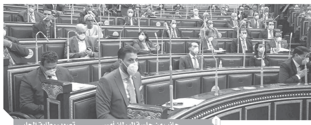
جانب من جلسة البرلمان أمس