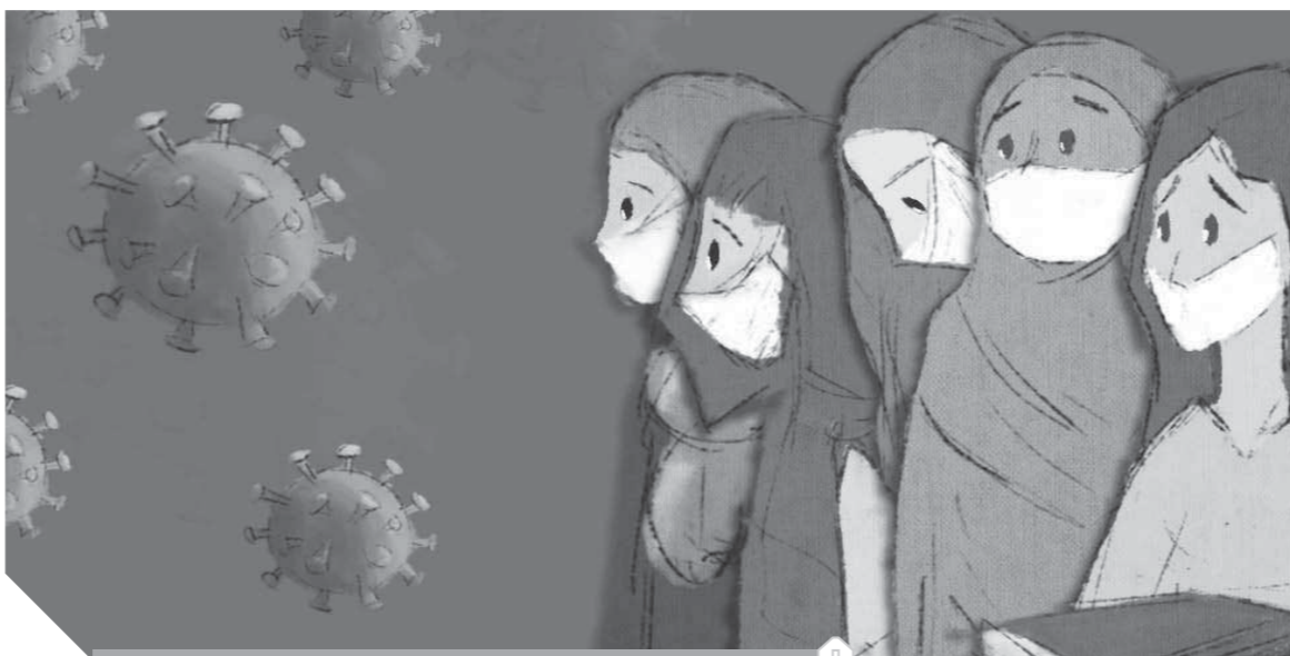
إجراءات احترازية في مواجهة كورونا

حياة وموت ● العكس- وفي محيطها ترى الدكتورة هدى زكريا أستاذة علم التربية والاجتماع بجامعة عين شمسش كورونا جمع بين أفراد الأسرة الواحدة بل وفئات المجتمع ككل عندما آمن الجميع أن مواجهة كورونا مسألة حياة أو موت وأنها لا تفرق بين رجل وسيدة وطفل ولا بين فقير وغنى ولا فقير، فالك مستهدف من قبل عدو لا تراه العين المجردة ولا توجد وسائل دفاعية تجاهه سوى التوحد والتعاون والتكافل والحب فيما بين الجميع، فالخطر المشترك جعل كل واحد وكل شريكين لعلمان أنهما لبعض فقط... فالتفت الأسرى وقيل زمن كورونا وما بعد زمن كورونا موجود وسيتكون، والصدام والخلافات الأسرية والاجتماعية مع استمرار أسبابها ستنزل، والعنف قد يتصاعد، ولذلك فالتلاحم في زمن الأزمات والكوارث ضرورة حتمية... والخطر الحقيقي يأتي من أهل الشر وبما يستغل مثل هذه الكوارث والأزمات لتضرب المجتمع المصري وإشغال التيران فيما بين أفراد الأسرة الواحدة عماد المجتمع وعماد الدين... ولذلك التلاحم المجتمعي مطلوب وضروري وهدف وسلاح قد يقضي على كورونا وغيرها ولكن مع العزل المنزلي شريطة ألا يكون فرصة للعنف الأسري عن طريق الاستغلال الأمثل لوقايتها وإعادة التفكير في شئون الأسرة والحياة والتهدد بعدم الوقوع في أخطاء صفت والاستفادة من الأزمة في البناء من جديد.