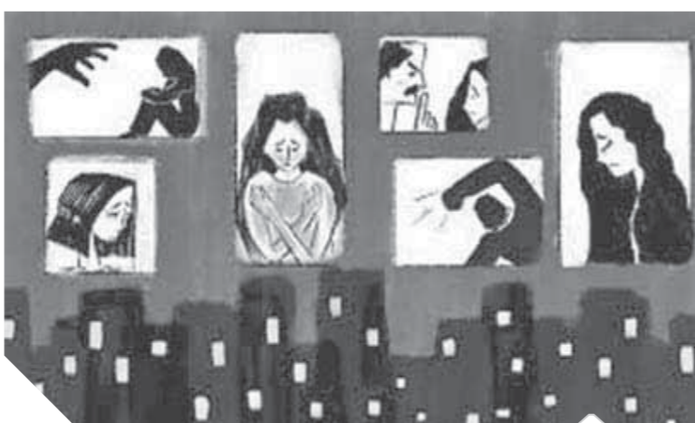
صعود وتيرة الخلافات العائلية بعد تقشي المرض

وفي العاصمة التركية إسطنبول ارتفعت معدلات الجرائم المتعلقة بالعنف داخل الأسرة بنسبة ٣٨.٢٪ مقارنة بنفس الفترة من العام الماضي بحسب