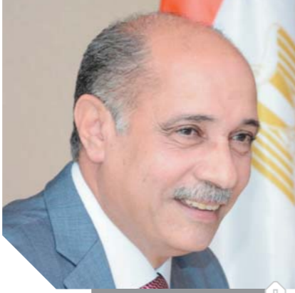
الفريق يونس المصري

الطيار وأائل النشار رئيس الشركة المصرية للمطارات والواء نبيل الملاح مدير مطار الغردقة. وفي نهاية الجولة توجه وزير الطيران بالتهنئة للمسافرين بمناسبة عيد القيامة المجيد وأعياد الربيع وشم النسيم، وتمنى لهم قضاء أوقات سعيدة بمصر ودعوتهم بسلامة الله إلى بلادهم، كما توجه بالتحية للعاملين بالمطار ورجال الشرطة على جهودهم ودورهم المشرف وتعاونهم المستمر لتقديم أفضل الخدمات للمسافرين.