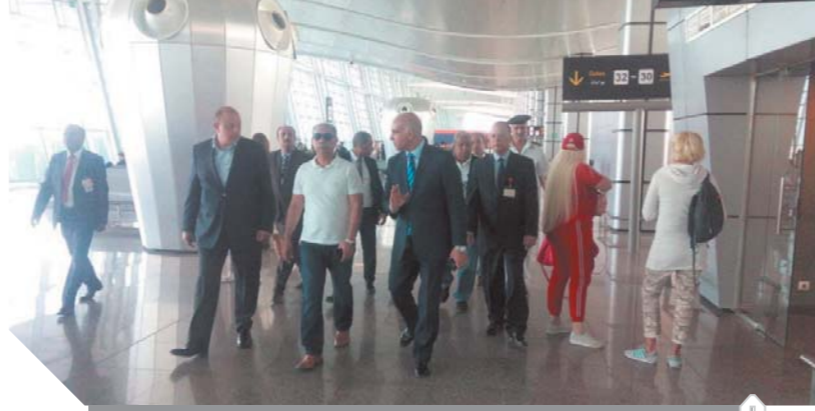
المصري، خلال تفقده مبنى الركاب ٢ بمطار الغردقة

كتب - عبد الخالق خليفة وأمانى سلامة، قام الفريق يونس المصري وزير الطيران المدني، بجولة تفقدية بمطار الغردقة الدولي، حيث تفقد مبنى الركاب رقم 1 متباعدة حركة التشغيل بالمطار، والتي تشهد كثافة عالية بمناسبة أعياد الربيع فضلاً عن زيادة حركة السياحة الوافدة إلى مدينة الغردقة. كما تابع آخر المستجدات وأعمال التطوير بمبنى الركاب رقم 2 وذلك تمهيداً للتشغيل التجريبي خلال الفترة القادمة، وقد رافق سيادته خلال الجولة