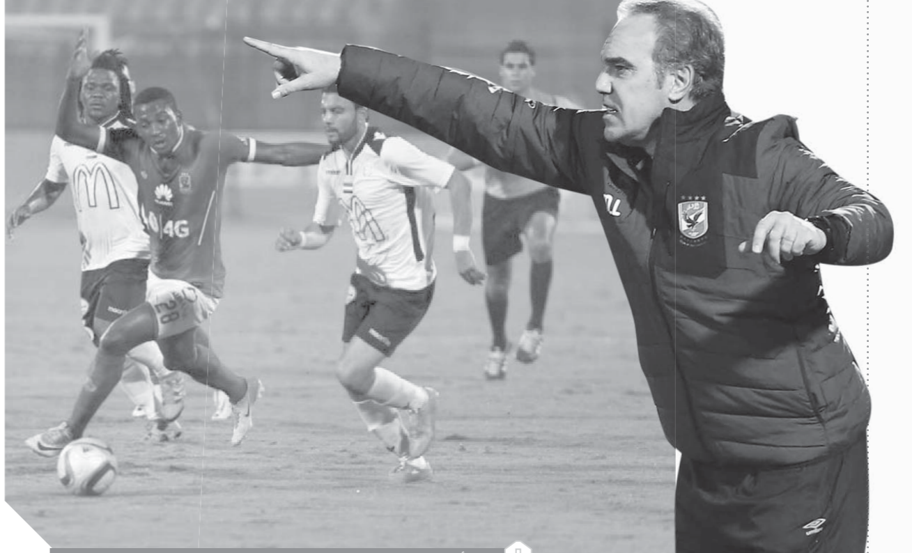
الأهلى يطعم في حصد النقاط الثلاث للمنافسة على الدرر