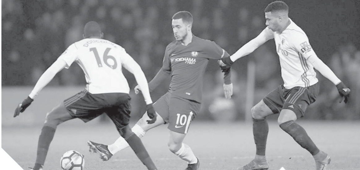
تشيلسى يبحث عن الفوز أمام واتفورد

دوري أبطال أوروبا بدور الـ١٦ والخسارة بنتيجة ٤-١ أمام أياكس في مقر داره، وتتويج برشلونة بلقب الدوري. ويحتل ريال مدريد المركز الثالث برصيد ٦٥ نقطة، متبعداً عن برشلونة بفارق أكثر من ١٧ نقطة، واتليكو مدريد صاحب المركز الثاني بفارق أكثر من ٩ نقاط. مواجهة قوية بين ريال مدريد وبياربال، في الرابعة والربع، على ملعب «سانتياجو بيرنابيو» ضمن منافسات الجولة الـ٣٦ من «الليجا». ويدخل الملكي المباراة وعينه على الثلاث نقاط من أجل إنهاء الموسم بافضل شكل ممكن، بعدما عاش الفريق موسمًا صعبًا، بعد الخروج من بطولة كأس ملك إسبانيا وفي الدوري الإسباني، يتربص عشاق الليجا