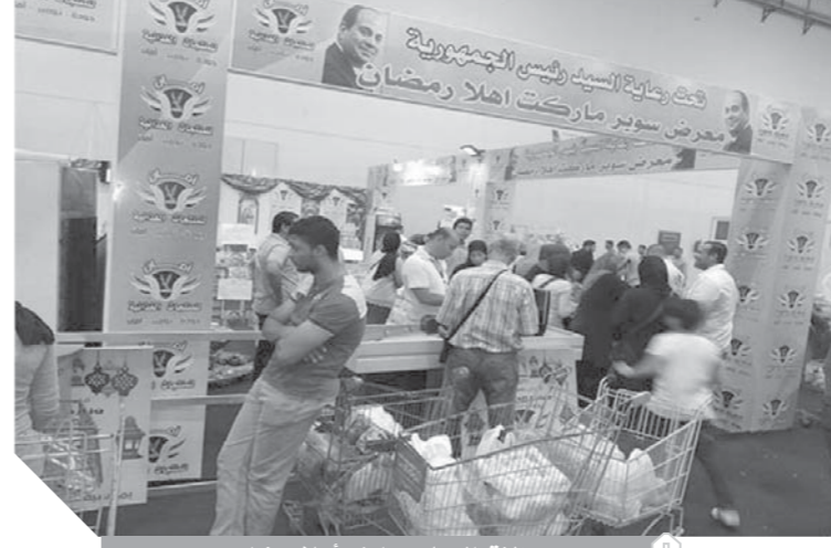
الإقبال على معارض أهلا رمضان

استمرار الإقبال على الشراء، ويشارك في المعرض كبار موردي ومنتجي السلع الغذائية من القطاع الخاص، إضافة إلى ممثلي الشركة القابضة للصناعات الغذائية التابعة لوزارة التموين. وأكد المصليحي على الدور الهام للاتحاد العام للغرف التجارية في التنسيق مع وزارة التموين، لإقامة هذه المعارض وزيادة العروض من السلع، تأسيسا على الشراكة الناجحة بين القطاع العام والخاص. وأضاف الوزير أن الشركة القابضة