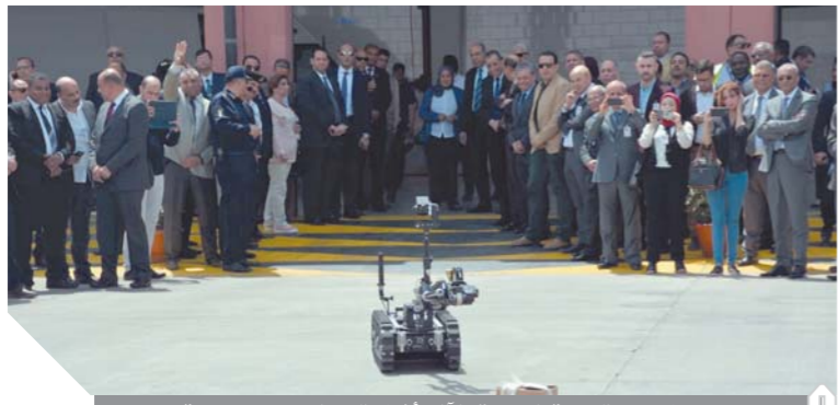
.. ويتابعون تجربة الريبوت الألى أثناء تفكيك عبوة وهمية