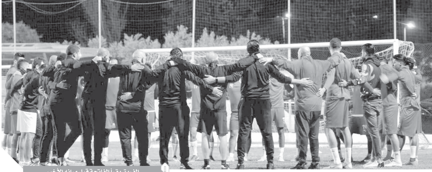
الفريق يقرأ الفاتحة قبل مرانته الأخير

يخوض فريق الزمالك لكرة القدم فى التاسعة مساء اليوم الأحد بتوقيت القاهرة، مواجهة صعبة ومصيرية أمام النجم الساحلى التونسى فى إياب دور نصف نهائى لبطولة الكونفيدرالية الإفريقية المقرر بملعب المركب الأولمبى بمدينة سوسة.