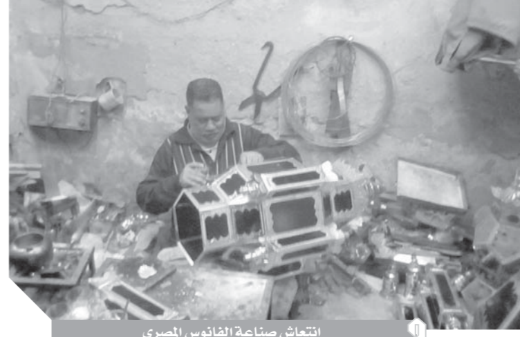
التعاش صناعة الفانوس المصري

وظلت هذه الصناعة تتطور حتى ظهر الفانوس الكهربائي الذي يعتمد في إضاءته على البطارية واللمبة بدلا من الشمعة، وأخيرا ظهرت الفوانيس المصنوعة في الصين والتي تضيء وتكلم وتتحرك. «الوفا» انتقلت إلى منطقة بركة النيل بالسيدة زينب، والتي تعد مقبل صناعة الفوانيس في مصر، لرصد أبرز استعدادات الورش والمصانع لوسم رمضان وأكد عدد من الصناع أن الإنتاج هذا العام ضعيف بسبب ارتفاع أسعار الخامات المستوردة من الخارج