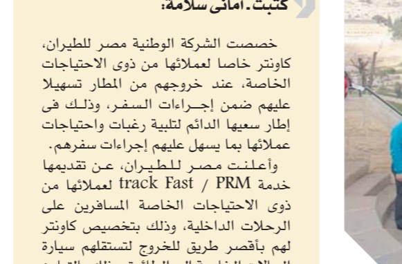
ممر خاص بالعماقين

خصصت الشركة الوطنية لمصر للطيران، كاوتنر خاصاً لعملائها من ذوى الاحتياجات الخاصة، عند خروجهم من المطار تسهيلاً عليهم ضمن إجراءات السفر، وذلك في إطار سعيها الدائم لتلبية رغبات واحتياجات عملائها بما يسهل عليهم إجراءات سفرهم. وأعلنت مصر للطيران، عن تقديمها خدمة track Fast / PRM لعملائها من ذوى الاحتياجات الخاصة المسافرين على الرحلات الداخلية، وذلك بتخصيص كاوتنر لهم بأقصى طرق للخروج لتستلمهم سيارة الحالات الخاصة إلى الطائرة، وذلك بالتعاون مع شركة ميناء القاهرة الجوية وسلطات تأمين المطار. وتحرص شركة مصر للطيران، دائماً على توفير كافة وسائل الراحة لعملائها من ذوى الاحتياجات الخاصة، تيسيراً عليهم لإجراءات السفر والوصول. ممر خاص بالعماقين