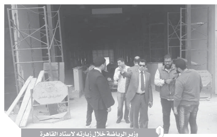
وزير الرياضة خلال زيارته لاستاد القاهرة