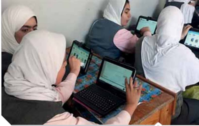
الطلاب متحمسون بعد سقوط السيستم