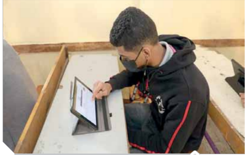
سقوط السيستم أزمة لطلاب الثانوية

«سقوط السيستم» في امتحانات الصفوف الأولى من الثانوية العامة، منع عددا كبيرا من الطلاب من دخول بعض الامتحانات التيرم الأول، ما أدى إلى دحر أولياء الأمور خشية تكرار «السقوط» في امتحانات الثانوية العامة المقبلة. إلا أن خبراء الاتصالات أكدوا أن المشكلة من الممكن تداركها وحلها من خلال وسائل سريعة حالها وأخرى مستقبلا، أبرزها تقسيم دخول الطلاب على المنصات التعليمية لأداء الامتحانات، لتخفيف التحميل على الشبكة، وكذلك تغيير البنية التحتية وتصميم الشبكة حتى تستوعب عددا أكبر من الطلاب المقيدون في المدارس. وحسب وزارة التربية والتعليم، فإن ٦٢٠ ألفا و١٣٣ طالبا وطالبة بالصف الأول الثانوي، من إجمالي ٦٥٤ ألفا و٨٢٤ طالبا وطالبة على مستوى الجمهورية، خاضوا اختبار مادتى اللغة العربية والأحياء، مطلع الأسبوع الحالى، على موقع منصة الاختبارات الإلكترونية من خلال أجهزة التابلت فى أول أيام امتحانات الفصل الدراسى الأول للعام الدراسى ٢٠٢٠/٢٠٢١، والتي تستمر حتى ٨ مارس ٢٠٢١.