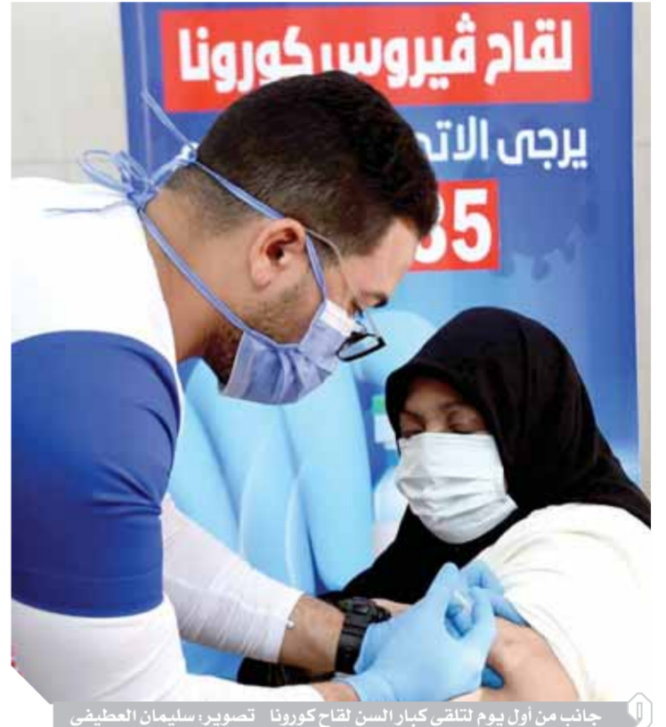
جانب من أول يوم لتلقى كبار السن لقاح كورونا

كتب- عبدالرحيم أبوشامة: أكد الدكتور مصطفى مدبولي، رئيس مجلس الوزراء، أن الدولة تقوم حالياً بتأمين أكبر قدر من جرعات لقاح فيروس كورونا من جميع المصانع والشركات التي تم اعتماد الحمل الخاص بها من هيئة الدواء المصرية. جاء هذا خلال بدء إطلاق حملة تطعيم المواطنين من أصحاب الأمراض المزمنة وكبار السن بالجرعة الأولى من لقاحات فيروس كورونا بالمركز الطبى في منطقة القمامية بالقاهرة، بحضور وزيرة الصحة والسكان، ومحافظ القاهرة وممثل منظمة اليونيسيف في مصر. وأشار «مدبولي» إلى أن الدولة تتحرك في اتجاه تأمين جرعات لقاح كورونا بأسلوب علمي بدءاً من اختبار اللقاحات من خلال هيئة الدواء المصرية، ثم التعاقد مع الشركات المنتجة لها، ثم تأتي مرحلة توزيع اللقاحات وفق الأولويات المطلوبة. وأعلن رئيس الوزراء أنه سيتم العمل على زيادة أعداد المواطنين الذين سيحصلون على اللقاحات خلال الفترة المقبلة، حيث أطلقت وزارة الصحة والسكان موقعاً إلكترونياً لتسجيل المواطنين الراغبين في الحصول على اللقاحات، وبموجب التسجيل يتم