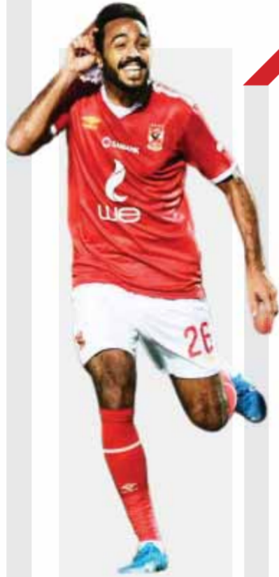
«كهربا» على أبواب الرحيل عن الأهلى P.7

كتب- ناصر فياض: أكد المركز الإعلامي لمجلس الوزراء والجهاز المركزي للتنظيم والإدارة أنه لا صحة لصدور أى قرارات بتسريح عدد كبير من العاملين بالجهاز الإدارى للدولة تزامناً مع قرار تحديث الملفات الوظيفية الخاصة بهم، مشدداً على أن المشروع القومى لتحديث الملف الوظيفى يهدف إلى الوصول لقاعدة بيانات دقيقة وشاملة للعاملين، وإعداد ملف إلكترونى لكل موظف على حدة، إلى جانب وضع خريطة للطاقات البشرية الموجودة بالجهاز الإدارى، من أجل تحقيق الاستخدام الأمثل لتلك الطاقات والعمل على تطوير ورفع كفاءتهم. وانتهى الجهاز من المرحلة الأولى من المشروع، التي تشمل داووين عموم الوزارات والأجهزة والهيئات العامة، وقطع شوطاً كبيراً في مرحلتين الثانية والثالثة بالتوازي، وتستهدف تحديث ملفات العاملين في الجهات التابعة للوزارات والجامعات، والمحافظات، حيث يتم تنفيذ المشروع حالياً في ١٦ محافظة، وأعلن الجهاز مؤخراً عن تحديث جميع بيانات العاملين بالحكومة في محافظة الوادى الجديد، ومن المقرر أن تلحق بها ثلاث محافظات أخرى يعلن عنها الجهاز خلال الفترة التالية تباعاً.