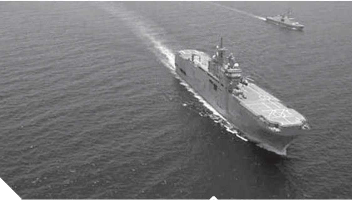
تشكيلات الوحدات البحرية المشتركة أثناء المشاركة فى التدريب

كتب- محمد صلاح وأبو زيد كمال وسامية فاروق: