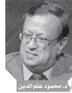
د. محمود علم الدين