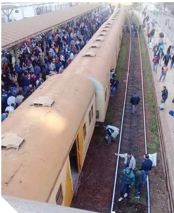
إحظة خروج قطار أبو قير عن القضبان

أكد شاهد عيان وأحد ركاب القطار، أنه فوجئ فور انطلاق القطار من محطة سيدى جابر باهتزازه بشدة وتوقفه تماماً، وهو الأمر الذى أحدث حالة من الذعر بين ركابه، ليضطروا إلى النزول؛ لمعرفة سبب الحادث والذين تبين خروج العجلات عن القضبان، وتسبب ذلك في انهيار جزئى برصيف الركاب، كما أصدرت هيئة السكك الحديدية بيانا أعلنت فيه اعتذارها لتأخر قطار رقم 4015 ركاب أبوقير نتيجة سقوط عجلة البوجى من إحدى العربات بمحطة سيدى جابر وبوجى عربة البار من قطار 900 ركاب، وأكدت هيئة السكك الحديد في بيان أنه على الفور تم التئيم بالاستعداد بالآلات الرفع لرفع عجلة البوجى والاستعداد بالسكك الحديدية. مضيفة أن حركة القطارات لم تتأثر وتعمل بصورة طبيعية.