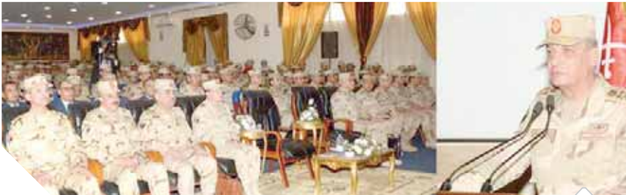
وزير الدفاع خلال لقاءه أمس بهيئة التدريس والضباط الدارسين بمعاهد القوات المسلحة

والتقى الفريق أول محمد زكي أعضاء هيئة التدريس