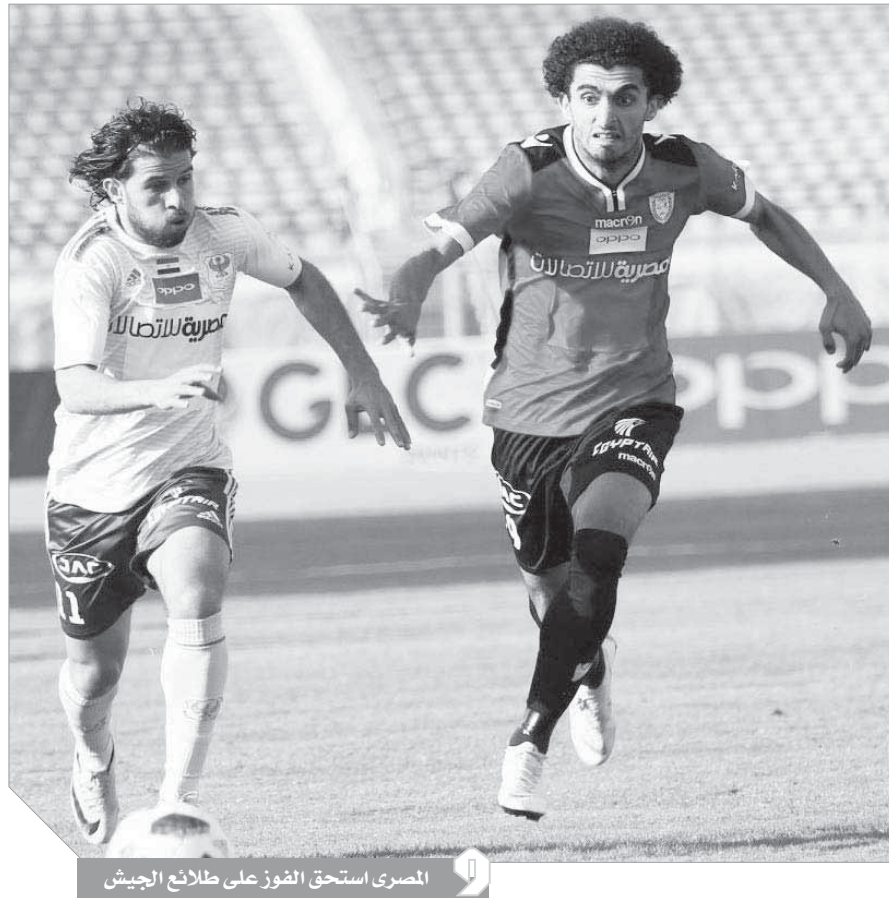
المصرى استحق الفوز على طلائع الجيش

من جانبه أعرب إيهاب جلال المدير الفنى للمصرى عن سعادته بالفوز فى مباراة طلائع الجيش والحصول على ثلاث نقاط غالية حافظت على مكانة