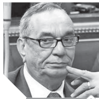
اللواء يحيى الكدوانى

قال اللواء يحيى الكدوانى، وكيل لجنة الدفاع والأمن القومي بالبرلمان، إن الشائعات نوع من أنواع الحروب التي كانت تمارسها البشرية منذ قدم التاريخ، تستهدف النيل من المعنويات، ونشر الفوضى والفرع بهدف تحقيق أهداف معينة، لصالح مطلق هذه الشائعات، ويكون الملقى عنده قابلية لتصديق هذه الشائعات حتى تحقق أهدافها. وأوضح أن الشائعات تكثر وتلقى مردوداً إيجابياً في الدول التي تقتصر إلى الثقافة والعلم، وينتشر فيها الجهل والأمية، وبالتالي يكون تأثيرها قوياً، ويحقق أهدافه، مؤكداً أن مصر تتعرض في الوقت الحالي إلى حملة شائعات شرسة، منظمة من قوى دولية وداخلية متربصة بمصر، تستهدف قتل الأمل داخل المصريين في مستقبل أفضل ويعكس توالى تلك الشائعات وجود ثوابية ضد المصريين، نافية زعم أصحاب الشائعات أن هناك زيادة في سلع معينة، لدفع المواطنين لشراؤها وتخزينها خوفاً من ارتفاع أسعارها، فتحدث أزمة فعلياً في تلك السلعة، نتيجة تهاوت المواطنين على شراؤها وتخزينها، بعدما كانت متوفرة بشكل عادى. وأضاف «الكدوانى» أن هناك أنماطاً مختلفة من الشائعات تستهدف إحداث نوع من الاضطرابات والخوف في نفوس المواطنين، كما أن هناك شائعات تستهدف تشويه صورة المشروعات التي تتم على أرض الواقع، التي تقوم بها الدولة، وتصويرها للمواطنين على أنها ليست ذات جودة أو منفعة، مؤكداً أن كل هذه الشائعات تصب في مصالح قوى معادية لمصر، وأوضح وكيل لجنة الدفاع والأمن القومي بالبرلمان أن من يقوم بنشر