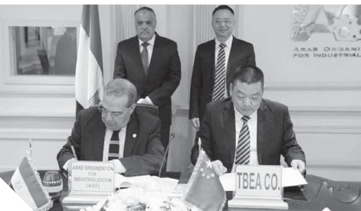
توقيع مذكرة تفاهم بين العربية للتصنيع وشركة «تبيا»

كتب- محمد صلاح وأبو زيد كمال وسامية فاروق: