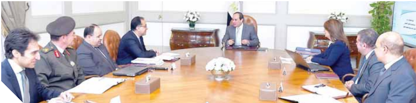
السياسي خلال رئاسته اجتماع وزاري لبحث برامج الحماية الاجتماعية

وأضاف المتحدث الرسمي أن الرئيس اطلع خلال الاجتماع على الإجراءات الخاصة بتفعيل قانون ذوي الاحتياجات الخاصة، وما تم إنشاء صندوق استثماري