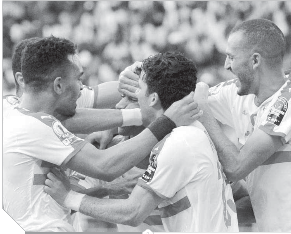
فرحة لاعبي الزمالك بالفوز

وأكد المدير الفنى، لا يزال لدينا مباراتان ب6 نقاط وحظوظ الفريق قائمة وبكل قوة، مشيراً إلى أن 5 نقاط لا تصعد بالفريق، والمبارتين المقبلتين فى غاية الأهمية من أجل التأهل لدور ال8.