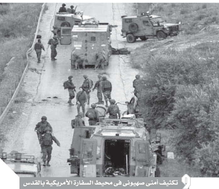
كتيبت أمنى صهيونى فى محيط السفارة الأمريكية بالقدس

مسلسل الإعدامات الميدانية، والقول خارج القانون على «صائد الموت» الثابتة والمتحركة، التي تشهدها قوات الاحتلال، التي تعرض حياة المواطن الفلسطيني لخطر القتل والموت بمجرد أن يخرج من منزله.