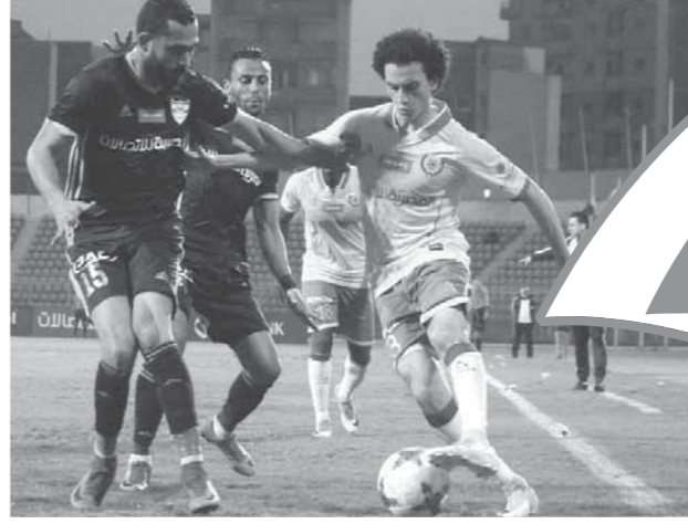
الإسماعيلي حقق فوزًا مستحقًا على الإنتاج الحربي