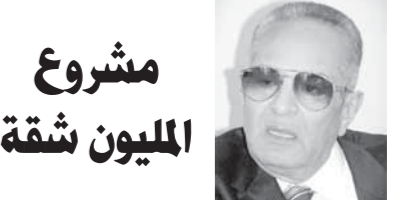
مشروع المليون شقة

بهاء الدين أبو شقة من الإنجازات العظيمة التي حققتها ثورة 30 يونيو المشروعات السكنية في المدن الجديدة، وأبرزها على الإطلاق مشروع المليون شقة، وهو مشروع يهتم بالطبقات الفقيرة التي لا تقوى على شراء وحدة سكنية. وبالفعل تم إنشاء عدد من الوحدات، وقامت الدولة بتسليمها إلى عدد من المستحقين، ولا تزال عمليات الإنشاء مستمرة لإبقاء الشقق، وتحدد لها مواعيد للتسليم. وليس مشروع المليون شقة الذي تم بعد ثورة 30 يونيو فحسب، بل هناك مشروعات إسكان متعددة تتم، حالياً، إنما هناك مشروعات أخرى تهتم بالإسكان الاجتماعي للطبقات المختلفة؛ حيث هناك مشروعات إسكان اجتماعي للطبقات المتوسطة والفقيرة، والتي يتم إنشاؤها في المدن الجديدة، مثل السادس من أكتوبر، والعاشر من رمضان، والشروق، والمستقبل وغيرها. ولم يعد المواطن يشقى في الحصول على شقة كما كان في السنوات الماضية.