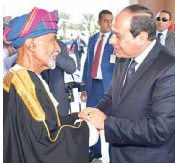
لقاء المودة والحب بين السيسى وقابوس فى مسقط