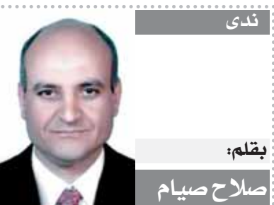
يقلم: صلاح صيام

العمل مع صديقى المخرج الكبير خالد يوسف دائماً يترجم إلى إبداع، فيعد النجاح الكبير خلال موسم دراما رمضان من خلال مسلسل «سره الباتع»، فكل من الشخصيتين لهم شكل مختلف وفى زمن مختلف عن الآخر تماماً يمكن التشابه فى الشخصيتين أن لكل منهم رسالة ومشتريكين فى حب مصر بالرغم من أوصولهم الأجنبية، فاهم رسالة أريد تقديمها دائماً هو سحر بلدنا وقدرته تأثيرها وجذبها لكل من يعيش على أرضها حتى ولو من أصل وثقافة مختلفة، وهذا ما سطرته كتب التاريخ عن مصر العظيمة.