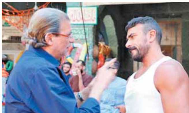
خالد يوسف وأحمد العوضى خلال كواليس الفيلم

للسينما المصرية بشكل عام وتسلف الضوء على الثقافة الفنية المصرية. وأضاف: تسلف الضوء على عادات وتقاليد مدينة الإسكندرية وأهلها، وروح المحافظة بكلها، وهى صورة واقعية، وتناقش قضية هامة لتعرف الناس كيف كان التاريخ وما يمكن الاستفادة منه فى بناء المستقبل. وعن صداقته بالنجم الكبير حسين فهمى، قال: حسين فهمى نجم كبير وموهوب وأشكره على تواجده لأنه إضافة كبيرة لى عمل، واستطعنا من خلاله تحقيق المعادلة الصعبة بتواجد ثقافة الأجيال فى الفيلم، فحفظنا نجاح كبير من خلال مسلسل «سره الباتع» والإسكندرانى.