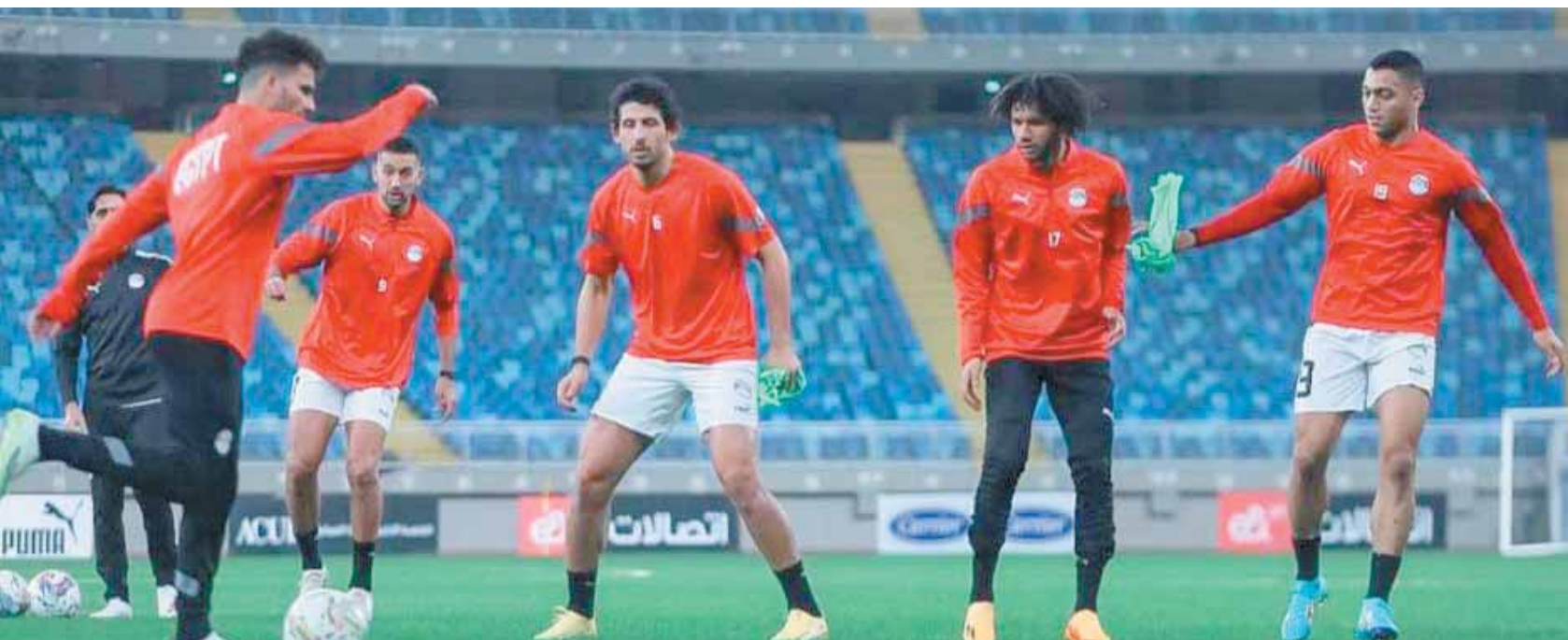
المنتخب يستعد بقوة لكأس الأمم الإفريقية