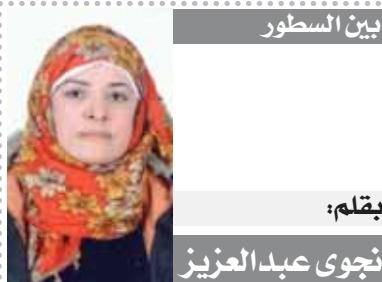
بين السطور بقلم: نجوى عبد العزيز