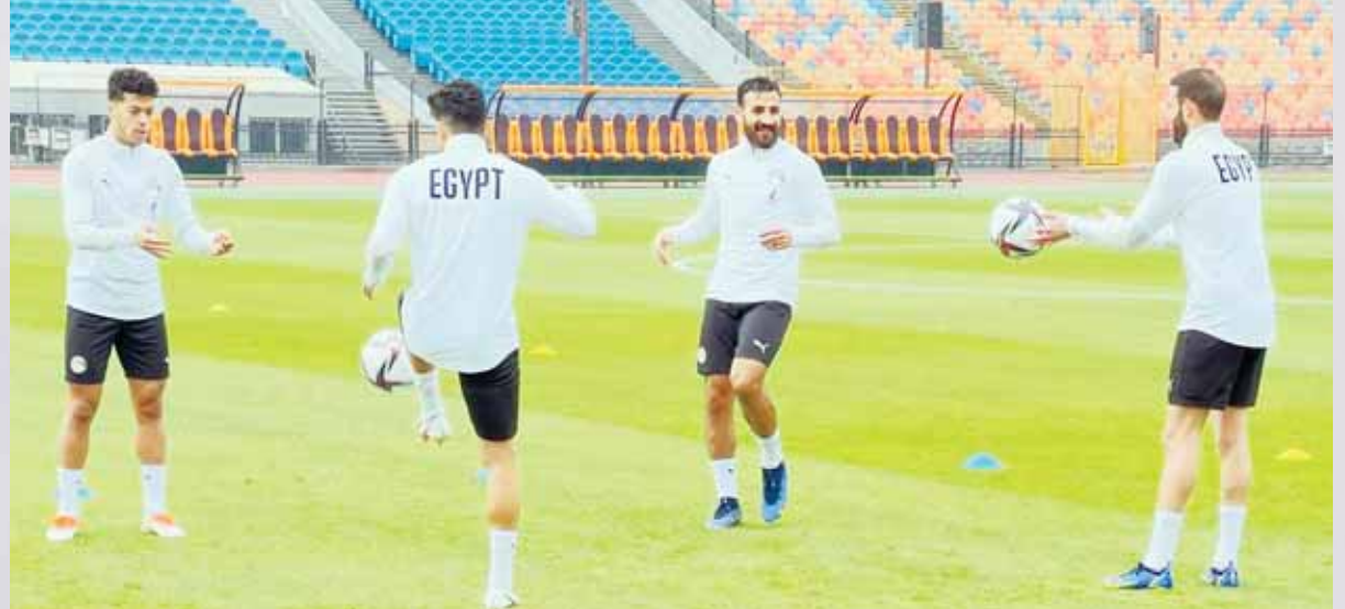
السولية يواصل التأهيل