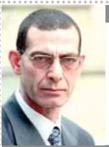
بقلم: د. وحدى زين الدين