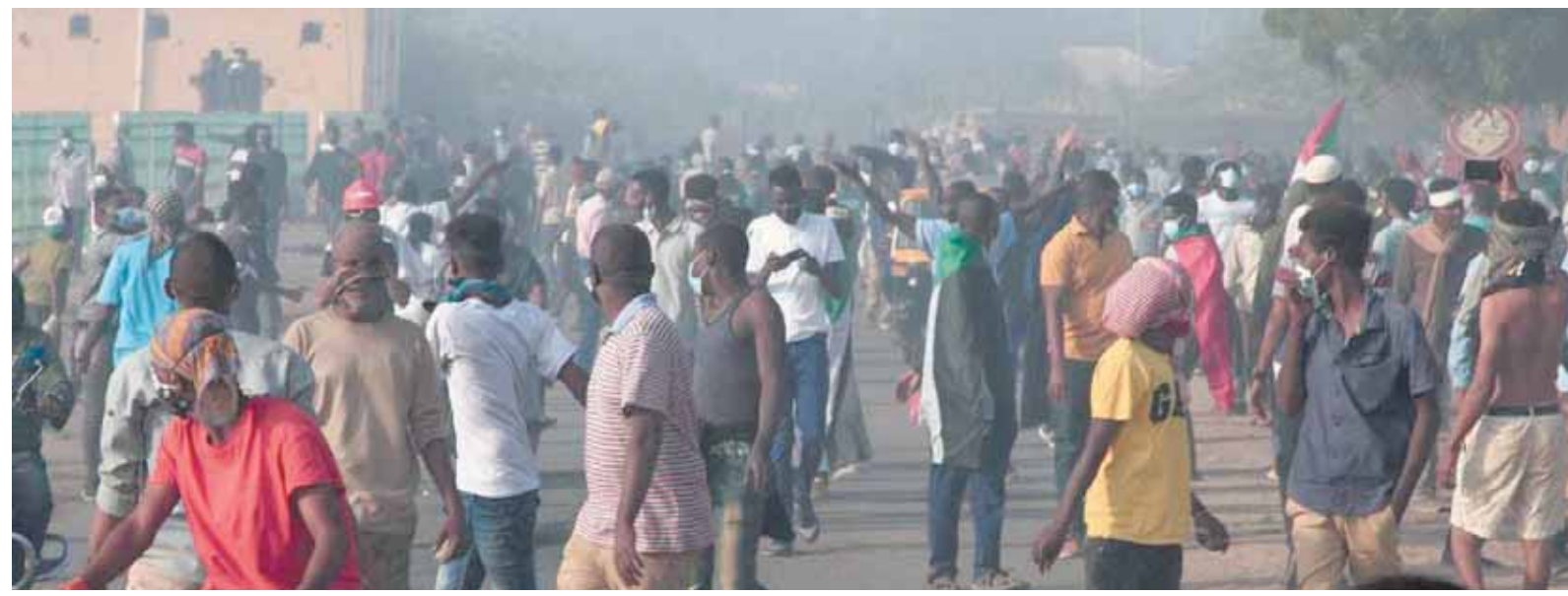
مظاهرات الغضب تجتاح السودان.. والسلطات ترد بقنابل الغاز

الجديد. ومع ذلك، فإن القيام بذلك يتطلب خطة حركة كانوا يقفون إليها تاريخياً. ورأت أن الدبلوماسيين والجهات الخارجية الأخرى ليس لديهم خيار تجاهل أولئك الذين يمتلكون السلطة الآن، وأكدت أن المظاهرات السودانية يريدون خروج الجيش، لكنهم لا يملكون خطة لكيفية تحقيق ذلك.