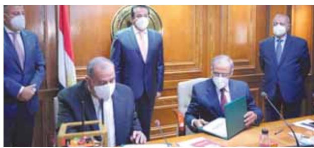
كتب- زكى السعدنى،

شهد د. خالد عبدالغفار وزير التعليم العالى والبحث العلمى، أمس، احتفالية تسليم ٣ أقمار صناعية تعليمية، لمعامل كليات علوم جامعة حلوان، وهندسة جامعة عين شمس، والأكاديمية العربية للعلوم والتكنولوجيا بفرع شبراخين بالقاهرة، لتكون نواة لمعامل ابتكار الفضاء فى (٢٢) كلية هندسة وعلوم فى مختلف جامعات مصر، وتمويل مشترك من أكاديمية البحث العلمى والتكنولوجيا ووكالة الفضاء المصرية. حضر الاحتفالية د. محمد القوصى الرئيس التنفيذى لوكالة الفضاء المصرية، ود. محمود مسقر رئيس أكاديمية البحث العلمى والتكنولوجيا، ود. إسماعيل عبدالغفار رئيس الأكاديمية العربية للعلوم والتكنولوجيا والنقل البحري، ود. محمود المنبى رئيس جامعة عين شمس، ود. محمود مهدى القائم بعمل رئيس جامعة حلوان، ود. عادل عبدالغفار المستشار