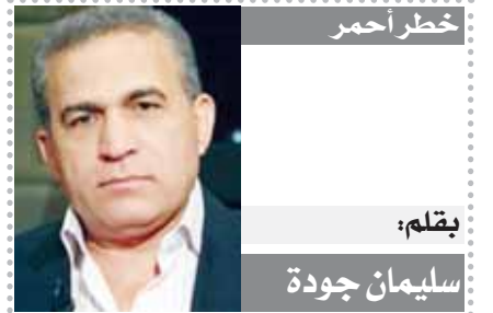
خطر احمر بقلم: سليمان جودة