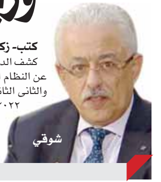
كتب- زكى السعدنى،

كشفت الدكتورة طارق شوقي، وزير التربية والتعليم، عن النظام الجديد لامتحانات التيرم للصفين الأول والثانى الثانوى للفصل الدراسى الأول لعام ٢٠٢١-٢٠٢٢.