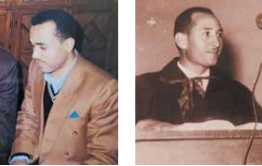
خلال مناقشة رسالة الدكتوراه