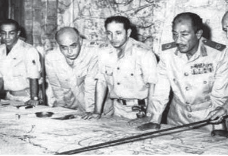
الرئيس حافظ الأسد أدار المعركة في سوريا من غرفة عمليات بالهايكستب!

لم أشغل نفسي بهذا الأمر- كما قلت- ولكن ربما كان المشير أحمد إسماعيل هو المتخذ هذا القرار، فلقد كانت تربطني معرفة سابقة بالمشير قبل الحرب، فإني أكان طالبين بكلية طب قصر العيني، وكان