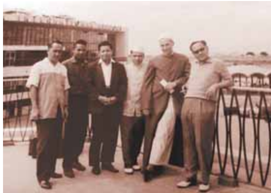
خلال زيارة في إحدى الدول الآسيوية