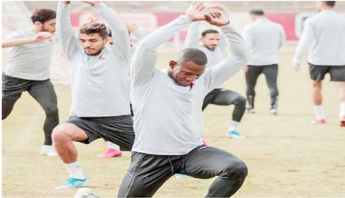
الأهل جاهز لمباراة القمة