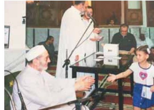
أثناء تكريم حفظة القرآن في مسجد حراء بالمقطم