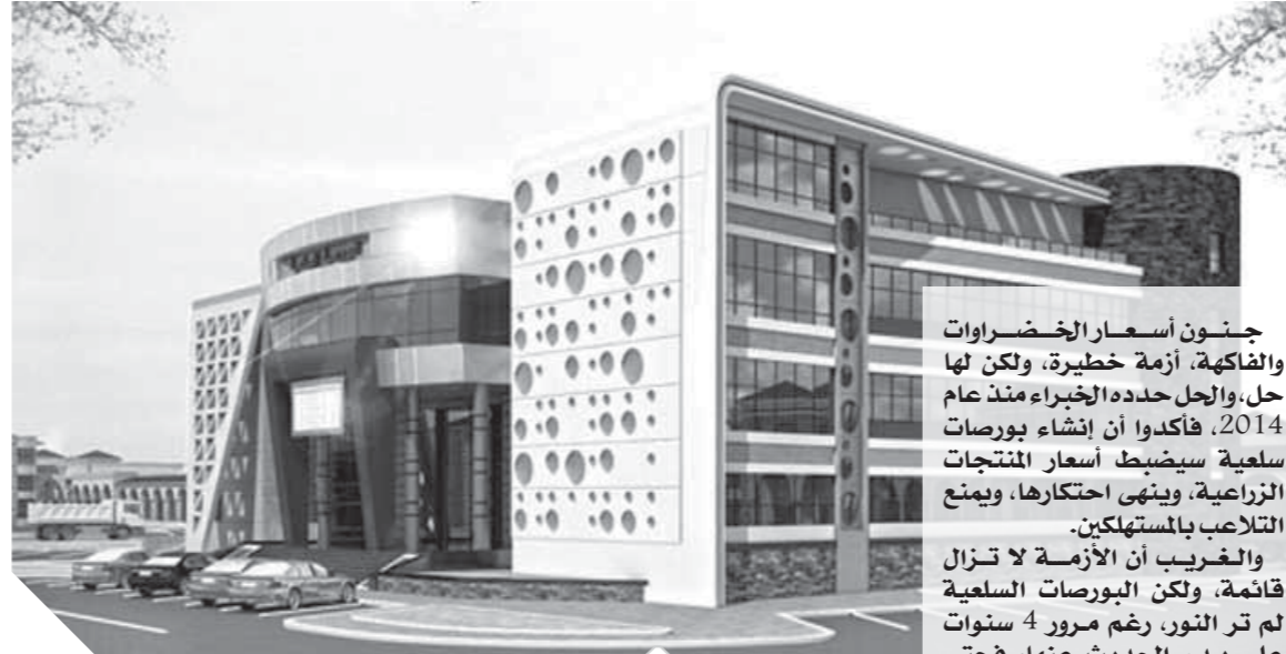
إنشاء البورصات السلعية ضرورة لضبط أسعار المنتجات الزراعية

جنون أسعار الخضراوات والفاكهة، أزمة خطيرة، ولكن لها حل، والجل حدهم الخبز منذ عام 2014، فأكفروا أن إنشاء بورصات سلعية سيضبط أسعار المنتجات الزراعية، وينهي احتكارها، ويمنع التلاعب بالمستهلكين. والغرب أن الأزمة لا تزال قائمة، ولكن البورصات السلعية لم تر النور، رغم مرور 4 سنوات على بدء الحديث عنها، فحتى الآن لم يتم البدء سوى في بورصة سلعية واحدة في البحيرة فقط، ووصل التجاهل لدرجة أن رئيس شعبة الخضراوات والفاكهة بغرفة القاهرة أكد أن الغرفة لا تعلم شيئاً عن تلك البورصات، فلم يستشرها أحد من المسؤولين بشأنها حتى الآن! ويبقى السؤال، لماذا تأخرت إقامة البورصات السلعية حتى الآن؟