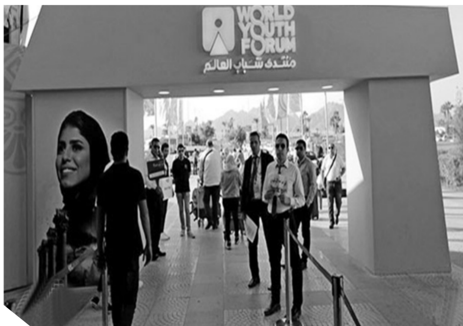
توافد الشباب للمشاركة في فعاليات منتدى شباب العالم، بشرم الشيخ.