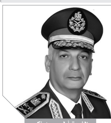
الضيق أول محمد زكي

والرؤية المبرهة للمجتمع المصري الذي استطاع على مدار عصور طويلة أن يكون مركزاً للتواصل بين مجتمعات عدة، والأعمدة السبعة هي: انتشاء مصر الفرعونى وانتشاء مصر اليونانى الرومانى، وانتشاء مصر القبطي ، وانتشاء مصر الإسلامى ، وانتشاء مصر العربى، هذا فضلاً عن انتشاء مصر للبحر المتوسط ، وانتشاء مصر الأفرى. وكان الرئيس السيسى، قد حضر مساء أمس الأول فعاليات مسرح شباب العالم الذي يقام على هامش فعاليات منتدى شباب العالم وتستمر عروض المسرح وفقراته على مدار 3 أيام تعكس رسالة ثقاه وسلام بين شعوب العالم، وتؤكد تكامل الحضارات من خلال العروض والفقرات التي تقام على خشبة المسرح كالفن والموسيقى والتتمثيل، بالإضافة إلى الأحاديث التحفيزية، إذ يستضيف المسرح عددًا من الشخصيات المهمة حول المحاور عرض تجاربهم وخبراتهم. واختتمت فعاليات المسرح الفنية الأمريكية زوريل أدول ذات الأصول الأفريقية، وهي أصغر صاعدة أفلام في العالم، وتشتهر بأفلامها التي تهدف إلى الدعوة لتعليم الفتيات في أفريقيا، وحقق نجاحات واسعة في هذا المجال، والنقت أكثر من 20 رئيس جمهورية ورئيس وزراء، وأدرجت في قائمة مجلة «New African Magazine»، ضمن أكثر 100 شخصية مؤثرة في أفريقيا.