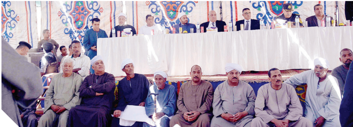
مراسم الصلح بين آل سليم والمطاعنة