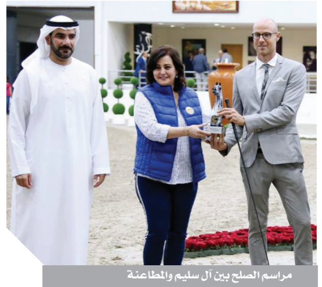
مراسم الصلح بين آل سليم والمطاعنة

أعلنت الدكتورة منى محرز نائب وزير الزراعة لشئون الثروة الحيوانية والسلمكية والداجنة، عن اتفاق مع الجانب الإماراتي تقوم المشاركة بموجبه ببناء مستشفى للخيول بمصر، وكذلك مركز للإخصاب حرصاً منها على أهمية الحفاظ على سلالة الخيول المصرية الأصيلة لما تمثله من قيمة تاريخية وتراث مصري وعربي أصيل.