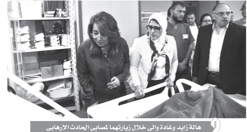
هالة زايد وغادة والى خلال زيارتهما لمصابى الحادث الإرهابى

حياتهم وزعزة الأمن والاستقرار فى مصر. وأكد البيان أن تلك الأعمال الجبانة لن تستطيع أن تتال من نسج الشعب، بل تزيينا إصراراً على تقوية روابط اللجنة الوطنية المصرية التى أثبتت صلاحيتها وقوتها، ولن تشيئا هذه المحاولات اليائسة عن محاربة الإرهاب صفياً واحداً حتى يقضى عليه وعلى جميع أشكاله، وستظل مصر باقية آمناً وأماناً بعون الله ويتماسك شعبها ووقوفه كالثبات المرصوص، أمام هذا الإرهاب الأسود، لرد كيد نوابه الخبيثة ومقاصده الشريرة وقررت غادة والى، وزيرة التضامن الاجتماعى، بناء على توجيهات رئيس مجلس الوزراء تعويضات لأسر ضحايا حادث المنيا الإرهابى بقيمة 100 ألف جنيه لأسر المتوفين ومعاملتهم معاملة الشهداء، وصراف معاش استثنائى 1500 جنيه لأسر المتوفين، وكذلك المصابين بعجز كلى يقرره القوميون الطبي، كما تقرر صرف مبلغ 50 ألف جنيه للمصابين بإصابات تستدعى العلاج أكثر من 72 ساعة و2000 جنيه لمن أصيب بإصابة طفيفة. كما وجهت وزيرة التضامن فرق الإغاثة بالهلال الأحمر المصرى بالتواجد إلى جوار أسر الشهداء والمصابين وتقديم جميع أنواع الدعم الطبي والطبى والمادى لهم، كما وجهت العاملين بمديرية التضامن الاجتماعى بحفاظة المنيا بسرعة إنهاء الأبحاث الاجتماعية الخاصة بأسر المتوفين والمصابين لإنهاء إجراءات صرف التعويضات.