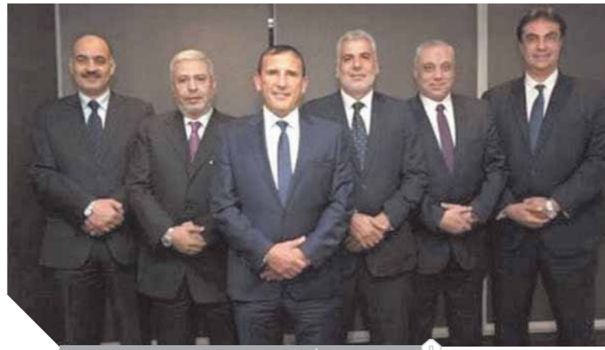
فوز كاسح لأول قائمة معلنة فى تاريخ انتخابات الغرف