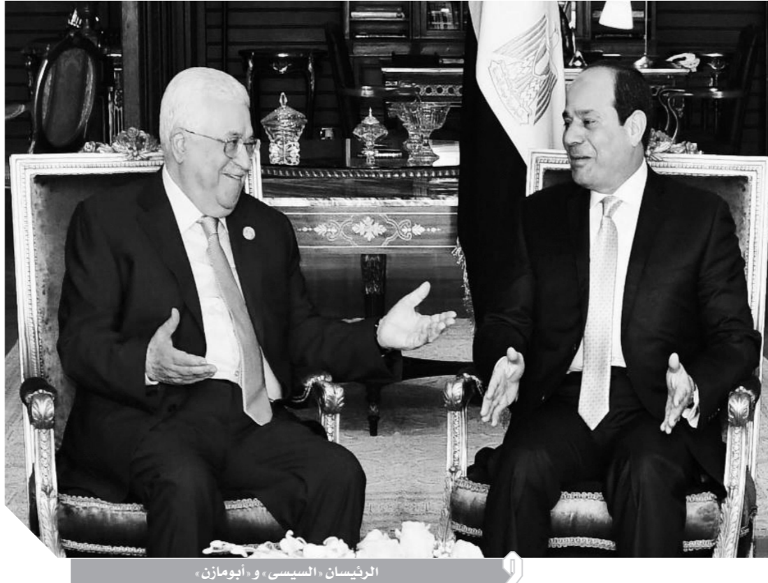
الرئيسان «السيسي» و «أبومازن»

إن عدم حماية الطبقة الفقيرة والمتوسطة من قرارات الزيادة سيؤدي إلى نتائج كارثية ومنها الكراهية و الغاء بين المستهلك والتجار ان مافات به هيئة الرقابة الادارية من محاربة الفساد بصفة عامة ومحاربة فساد الاحتكار في كل مرة عقب قيام بعض المتحررين وتعطيل السوق من أهم السلع الغذائية وهي اقوات المواطنين كان اخرها ضبط اطنان من البطاطس ومصادرتها أمر يستحق الاشادة به ورفع القيمة لرجال الرقابة الادارية ، بعد ان ارتفع انين المواطنين من ظلم المحتكرين. ولكن يبقى السؤال اين دور وزارتي التميمون والزراعة في رصد والقيام بحصر للمزارعين والتعاقد معهم اثناء الزراعة على شراء المحصول ايا كان نوعه من خلال المشرفين الزراعيين ومباحث التميمون قبل ان يلتقمهم بعض المتلاعبين محترضن تجويع وتعطيل الأغنياء والفقراء وفي وطننا ، إن الفساد وباء اجتماعي وهو لا يقل ضراوة عن الأرهاض فيجب على جميع طوائف الشعب وجميع الأجهزة ان تتضافر جهودهم لمحاربة الأرهاض والفساد بكافة صورهم وجهان لعملة واحدة وهي الجريمة:رب الاجل هذا بلدا أمنا.