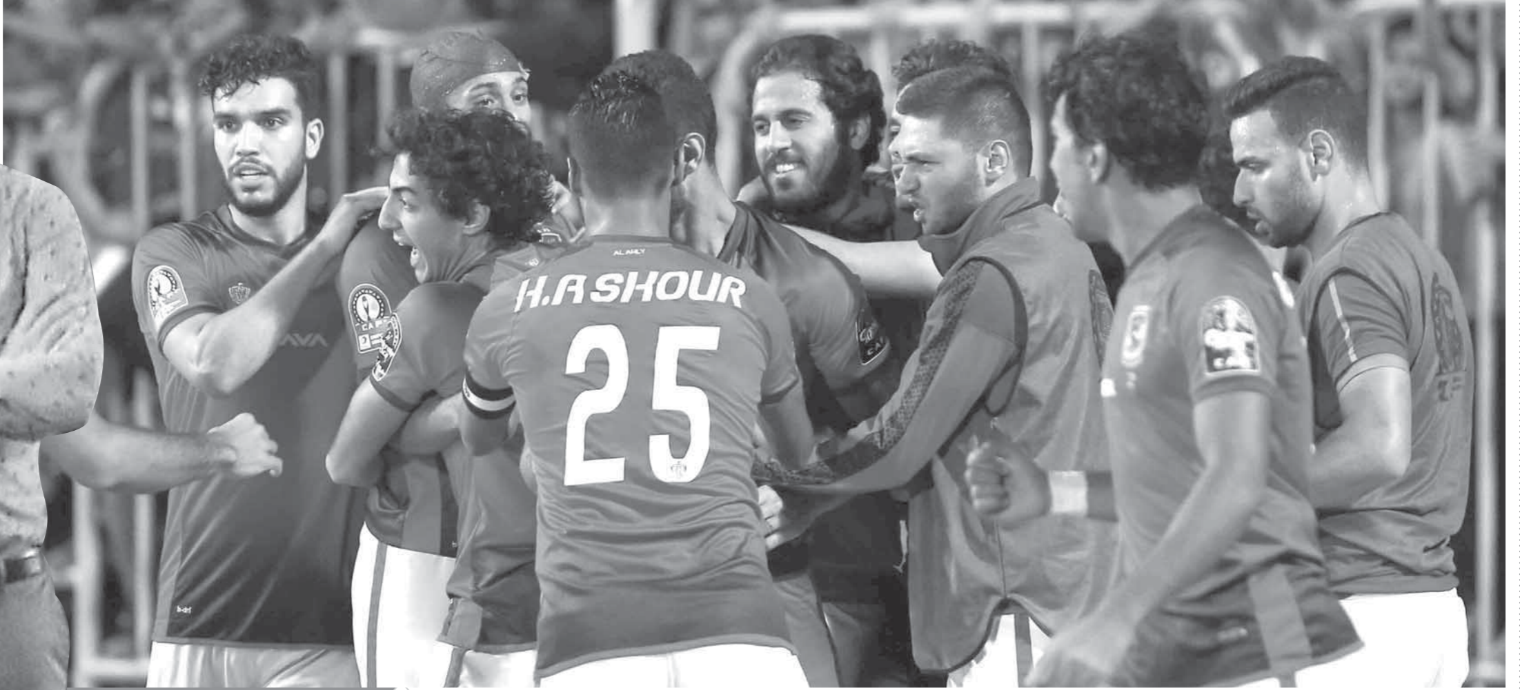
فرقة لاعبي الأهلي بالفوز الكبير