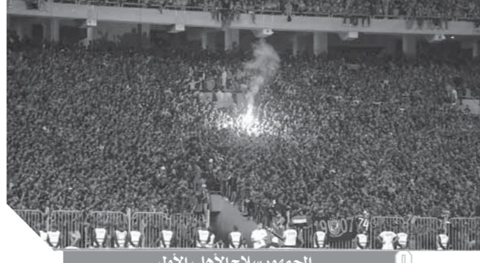
الجمهور سلاح الأهلي الأول