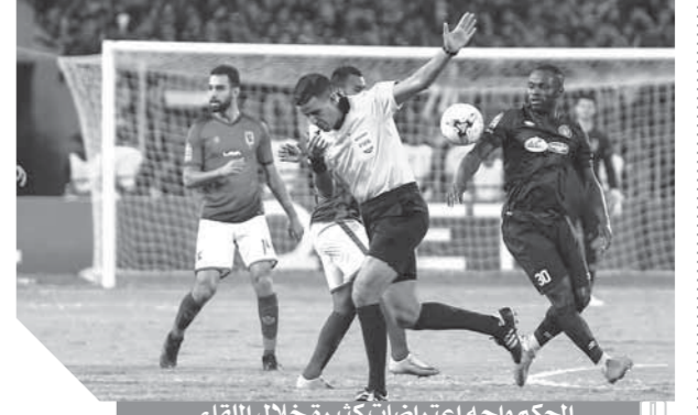
الحكم واجه اعتراضات كثيرة خلال اللقاء