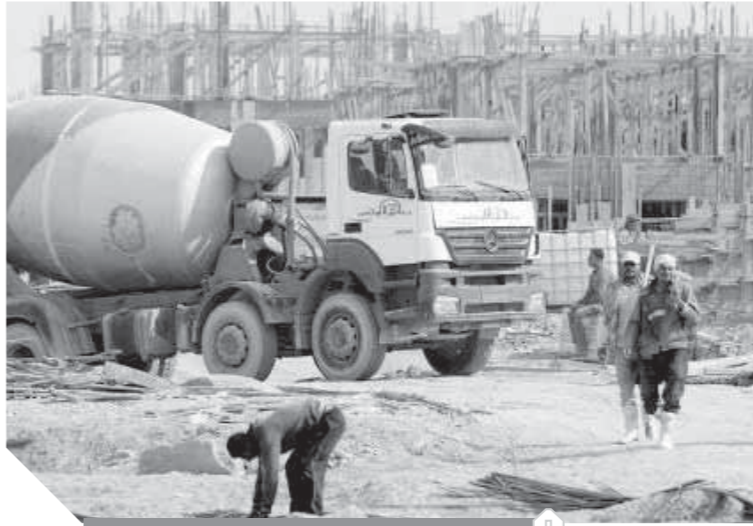
أعمال إنشاء البورصة السلعية بالبحيرة

البورصة السلعية عبارة عن أسواق تباع فيها المنتجات الأساسية بالجملة، بالإضافة إلى تخزين الخضراوات والفاكهة بشكل صحى وآمن بدلاً من الأسواق التي تتعرض فيها البضائع للتلّف، فهى مشروع متكامل به جزء صناعى وآخر تجارى.