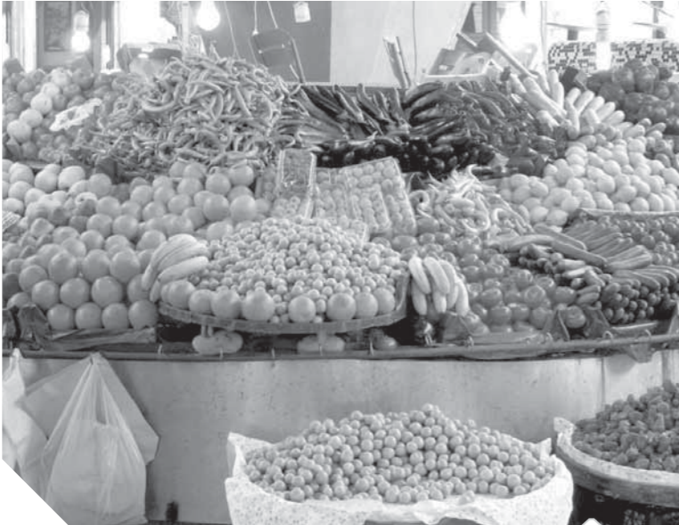
الاحتكار سبب الارتفاع الجنوني في أسعار الخضروات والفاكهة