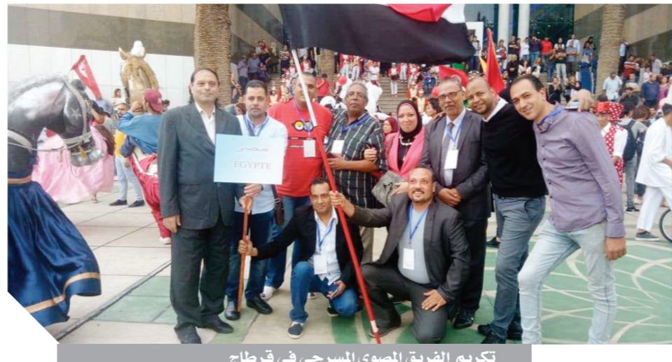
تكريم الفريق المصري المسرحي في قرطاج

حظيت المسرحية «كان في مكان» التي قدمتها فرقة الأراجوز المصري، ضمن عروض الدورة الأولى لمهرجان أيام قرطاج لفنون العرائش، بحضور لافت من قبل الجمهور التونسي، واهتمام كبير من قبل أعضاء الفرق المشاركة ومنظمي المهرجان، الذي شهد تقديم 29 عرضاً للعرائش، لفرق من 20 دولة عربية وأجنبية.