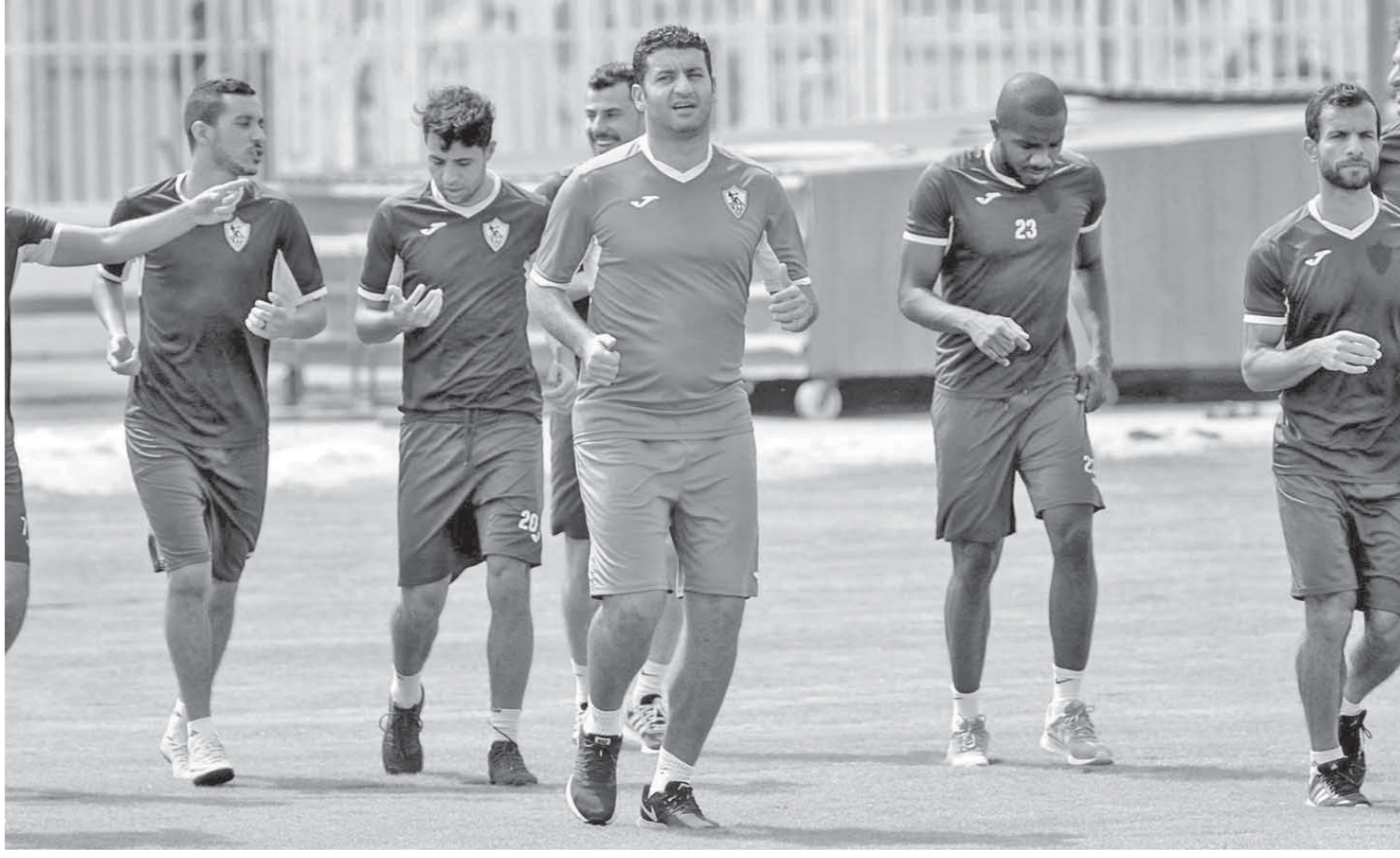
الزمالك جاهز للسوبر أمام الهلال السعودي