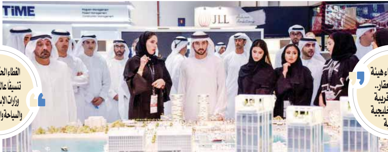
معرض سبتي سكيب دى يتبدو البداية لتصدير العقار المصرى

الغطاء الحكومى يتطلب تسييقاً عالي المستوى بين وزارات الإسكان والهجرة والسياحة والعدل والبنوك