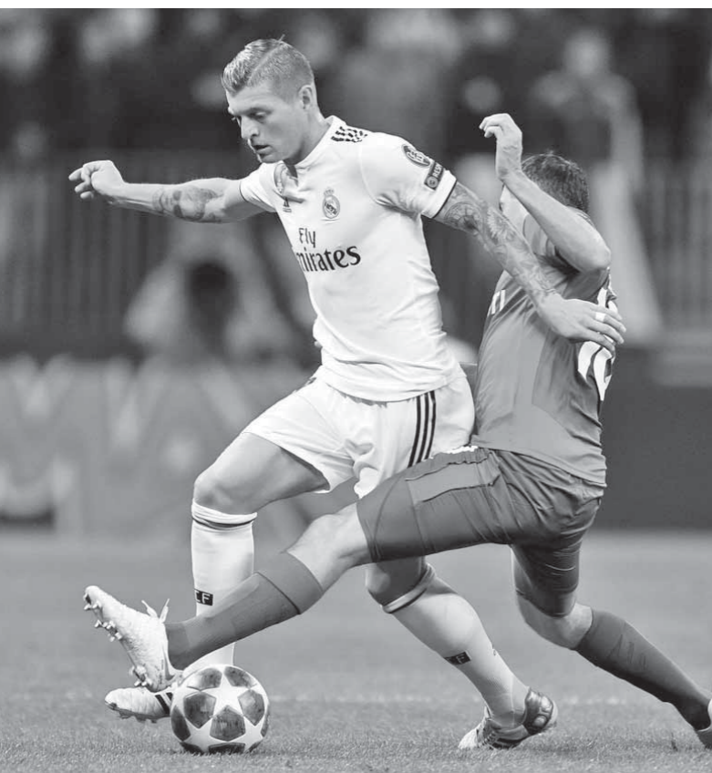
ريال مدريد تلقى خسارته الأولى في دوري الأبطال

ولم يسبق أن يتذوق ريال مدريد الخسارة في أول مواجهتين بدورى أبطال أوروبا، منذ الهزيمة أمام ليون بهدفين دون رد، في موسم 2006-2007. كما توقفت سلسلة ريال مدريد، عند 29 مباراة سجل فيها بشكل متتال بدورى الأبطال، منذ التعادل السلبى مع مانشستر سيتي، في موسم 2016-2015. ووضعت الصحافة الإسبانية الريال ومدريهم، في مرمى التيران حيث عنونت صحيفة «ماركا» على غلافها وقالت «حطام سفينة ريال مدريد مع لوبتيجي.. 5 ساعات و19 دقيقة بدون هز الشباك»، وأضافت: «سبب توني كروس في استقبال