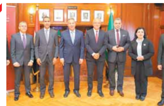
قيادات البنك واتحاد الصناعات خلال توقيع البروتوكول