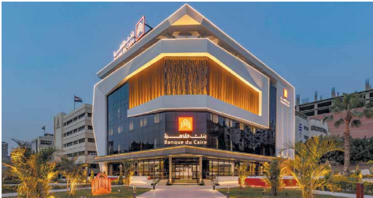
بنك القاهرة يواصل التوسع ويحقق أرباحاً قياسية