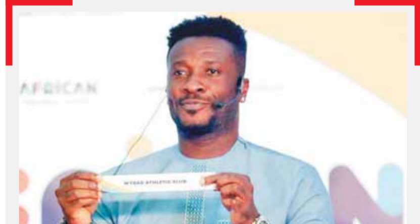
جانب من قرعة دورى السوبر ليج