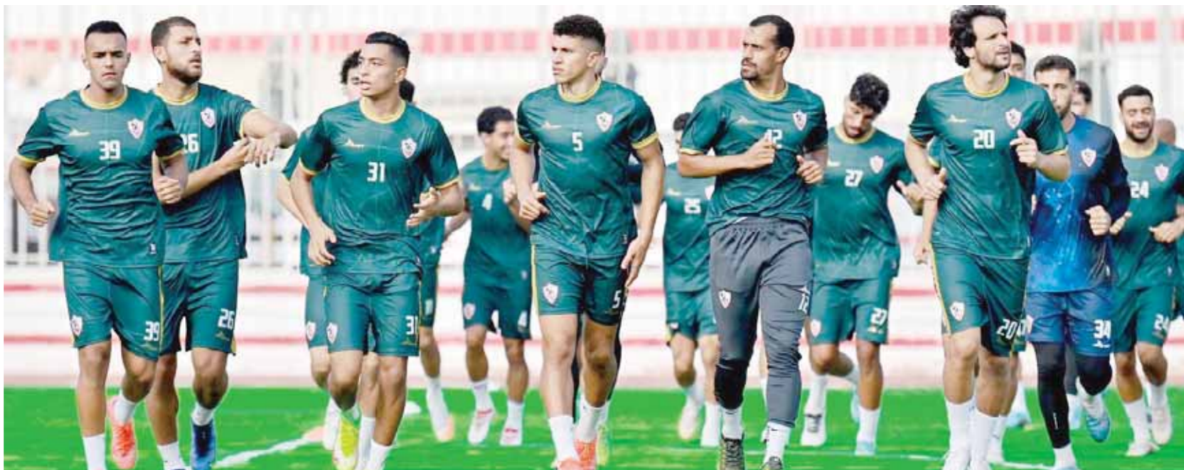
الزمالك يستعد بمعسكر مغلق لانطلاق الموسم

على صعيد آخر، يدخل الزمالك معسكراً مغلقاً اليوم الاثنين بأحد فنادق مصر الجديدة بالقاهرة استعداداً لخوض مباراة أرتا سولار بطل جيبوتي في ذهاب دور الـ٣٢٧ ببطولة كأس الكونفدرالية الأفريقية. ويخوض الزمالك تدريباته باستاد الكلية الحربية، ويخوض مباراتين وديتين أمام السكة الحديد على ملعب الأخير يوم الخميس المقبل وعند سيراميكاً كيو باترا يوم الاثنين المقبل. ويحصل الفريق على راحة لمدة ٢٤ ساعة قبل السفر فجر يوم ١٢ سبتمبر الجاري لمواجهة بطل جيبوتي المقررة يوم ١٦ من الشهر الحالي.