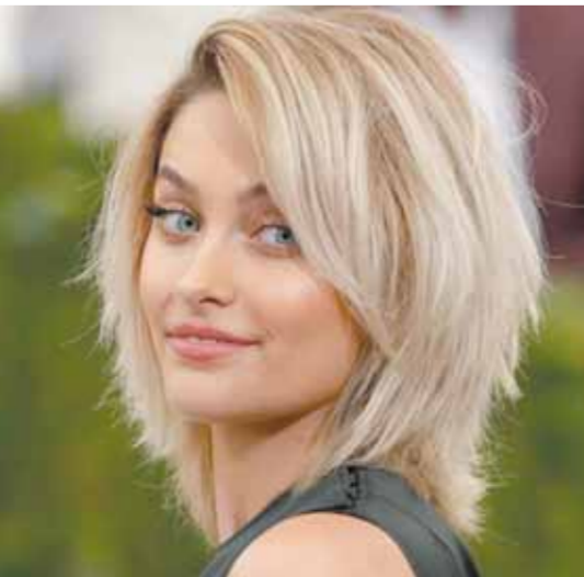
بها عبر الإنترنت. وأوضحت باريس جاكسون صاحبة ٢٥٥ عامًا أن والدها الذى توفي فى يونيو ٢٠٠٩ فى عمر يناهز ٥٠ عامًا، بسبب سكتة قلبية ناجمة عن جرعة زائدة من المخدرات، لم يحب أبداً الاحتفال بعيد ميلاده، وأن عدم نشرها أى شىء فى عيد ميلاد والدها يعتبر تكريمًا له. وكانت حلت منذ يومين ذكرى عيد ميلاد ملك البوب مايكل جاكسون، والذى اشتهر بأغانيه المميزة، والتى حازت العديد من الجوائز ملك البوب مايكل جاكسون من المغنين المميزين فى عالم الغناء، فى عيد قديم العديد من الأغاني المميزة، والتى غيّرت مسار الغناء، الأغاني فى جميع أنحاء العالم، وطرح العديد من الألبومات المميزة، أبرزها ألبوم «Thriller»، والذى كسر من خلاله جميع الأرقام القياسية، ولم يستطع أى مغن فى وقتنا الحالى كسر أرقامه المميزة.

كثيبت - أسماء خالد: كشفت باريس جاكسون، ابنة نجم البوب مايكل جاكسون، أن هناك مجهولاً ظل يطاردها لعدة سنوات عبر الإنترنت، وطلب منها أن تقتل نفسها فى عيد ميلاد والدها الراحل مايكل جاكسون، وتسمى حاليًا باريس للحصول على أمر تقييدى ضده. وقالت باريس إن الرجل المتهم تسلل إلى منزلها بعد شق السياح المحيط به ونظر من خلال نوافذها الأسبوع الماضى، وعلى الرغم من عدم معرفتها به، إلا أنه تم القبض عليه، وفقًا لموقع «بلى ميل» البريطانى. وأكدت «جاكسون» أن الواقعة تعود لعام ٢٠١٩ عندما أرسل إليها شخص مجهول رسائل غير مرحب بها، ثم بدأ مطاردتها حتى الآن، مضيفة أن ظهور الرجل المجهول فى ممتلكاتها جعلها متوترًا وتخشى البقاء بمفردها فى المنزل، وترغب من منعه من الاتصال