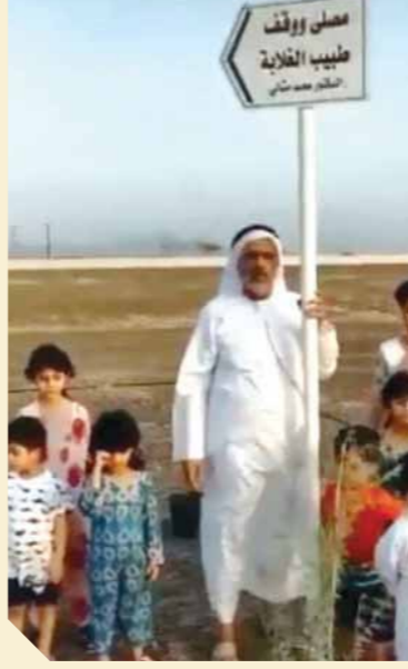
جزاء الله خير.. ونتمنى أن يتحلى الجميع بالشء هذا، لأن فعلاً الرجل رجل عظيم ما شاء الله عليه وسوى المستحيل جزاء الله خير وغفر الله له ولوالديه».

في موقف إنساني يعكس مدى الترابط بين الشعوب العربية، وبقاء عمل الخير لأصحابه، تكفل رجل إماراتي، ببناء مصلى ووقف باسم طبيب الغلابة الدكتور محمد مشالى، في شارع خليفة، بالإمارات العربية المتحدة. نشر الرجل مقطع فيديو ظهر فيه ويحيط به أطفال عائلته، ليعلن عن تخصيص قطعة أرض لتصبح مصلى ووقفاً باسم الدكتور المصري الراحل. نشر مروان مشالى، حفيد طبيب الغلابة صورة قديمة جمعت مع والده وجدته الراحل الدكتور محمد مشالى، عبر حسابه الشخصي على موقع التواصل الاجتماعي «فيس بوك»، ليعتدما صوراً لحسابه الشخصي، وفي المقابل تقاعد عدد كبير من أصدقائه ومتابعيه مع الصورة والذين كثفوا الدعاء بالرحمة للدكتور الراحل محمد مشالى. وقال الرجل الإماراتي في مقطع الفيديو الذي انتشر بكثافة عبر منصات التواصل الاجتماعي، «السلام عليكم ورحمة الله وبركاته.. بسم الله والحمد لله والصلاة والسلام على رسول الله.. رويتنا هذه الأشجار وزرعناها وسويتنا مصلى وأطلقنا عليه مصلى طبيب الغلابة.. اللهم اجعلها صدقة عنه وعن والديه وعن المسلمين الأحياء والأموات.. وهذا على شارع الشيخ خليفة.. ويتكون اللوحة هذه موجودة ويتطلب ذكرى». وأضاف: «حقيقة الرجل إحد ما عرفناه إلا بعد ما وفاته أيام، وبغينا نسوي المبادرة هذه تقديراً للرجل هذا والأعمال التي قام بها