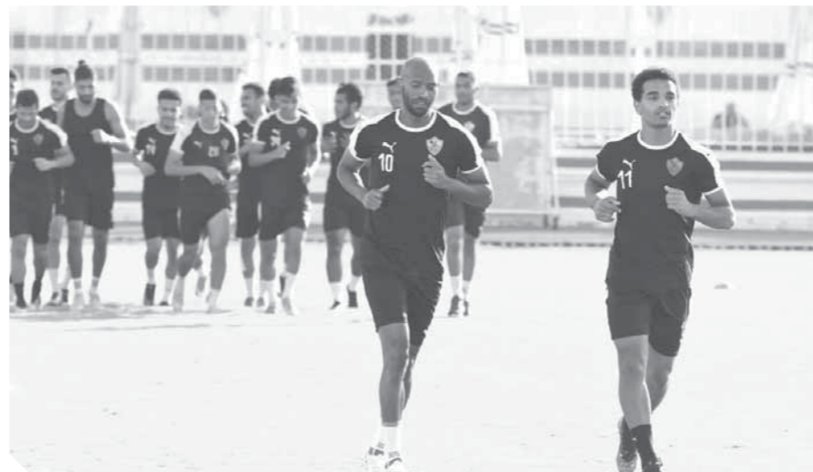
جدية في تدريبات الزمالك استعداداً للمصري

من ناحية أخرى عقد المدير الفني للفريق جلسة مع اللاعبين الناشئين المتواجدين في معسكر الفريق بوجه خاص والفريسي باتريسي كارتيرون المدير الفني للفريق على عقد أكثر من جلسة مع لاعبي الفريق طالبيهم خلالها بالتركيز في الفترة الحالية استعداداً لاستئناف الدوري.