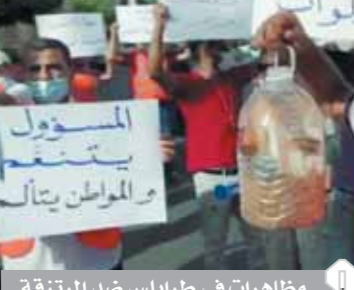
مظاهرات فى طرابلس ضد المرتزقة

اندلعت بالعاصمة الليبية طرابلس مظاهرات عارمة ضد حكومة فايز السراج المدعومة من أفرقة، ندد المظاهرون بانتشار المرتزقة وتعرض حياة المواطنين للخطر على ايدى الميليشيات المسلحة والمرتزقة الذين أرسلتهم تركيا إلى البلاد، والتنديد بزيارات المرتزقة والميليشيات المسلحة لعمليات سرقة ونهب واستنزاف ضد المواطنين، كما ندد المظاهرون بتدننى الخدمات العامة للمواطنين على غرار أزمة انقطاع كهرباء غير مسبوقة والتي لم تشهد بالبلاد من قبل، بجانب تدهور وانهاير الخدمات فى كافة القطعات الاقتصادية الأخرى التى تمس المواطنين، والتي تزيد حداثها حاليا مقارنة بما كانت عليه البلاد منذ فبراير ٢٠١١. وكشفت مصادر السورى لحقوق الإنسان، عن أن عدد المرتزقة السوريين فى ليبيا، ارتفع إلى ١٧ ألفاً، من بينهم ٣٥٠٠ مطلقاً وأن قرابة ٦ آلاف من المرتزقة الموالين لتركيا، عادوا من ليبيا إلى الأراضى السورية لأن عقودهم انتهت، حيث حصل بعضهم على عقود لمدة ٣ أشهر، وتم التمديد لبعضهم لمدة شهر، لكن البقية عادوا إلى سوريا عبر تركيا، وبدء بعضهم بالفعل بتسجيل اسمائهم للعودة مجدداً إلى ليبيا مع تجديد عقود أعمالهم كمركزية لصالح ليبيا، وأشار المرصد إلى أن المرتزقة السورى المشارك فى القتال الليبى، يصل راتبه إلى الفى دولار شهريا، بالإضافة لإمكانية حصوله على الجنسية التركية، وتوعيات فى حال إصابته، ووفقا لجريدة الموقف الليبى، فإن المرصد السورى لحقوق الإنسان وثق سقوط