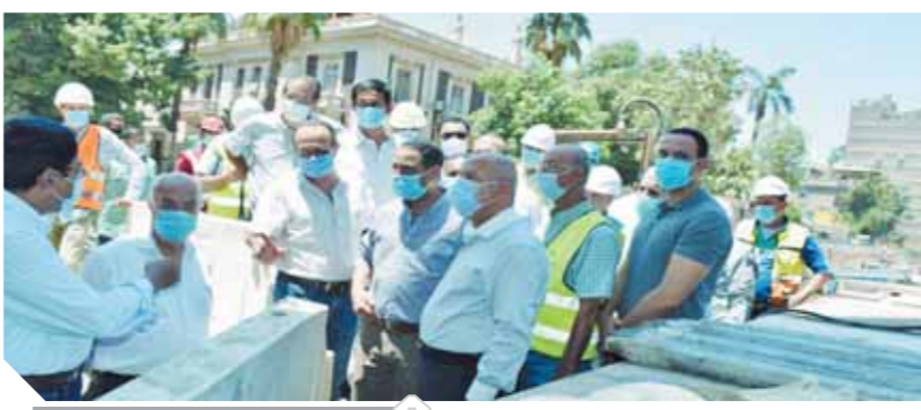
الوزير يتابع ترميم عمارة الزمائل

أكد المهندس كامل الوزير، وزير النقل، أن محطة عدلى منصور فى الخط الثالث لمترو القاهرة ستكون محطة مركزية تبديلية كبيرة تضم مجمع نقل متكامل والخدمات ومنطقة تجارية استثمارية على مساحة ١٥ فدانا، سيتم تبادل الخدمة بين خمس وسائل نقل مختلفة حيث تشمل محطة مترو الخط الثالث ومحطة للقطار الكهربائى (عدلى منصور - العاصمة الإدارية - العاشر من رمضان) ومحطة للسكك الحديدية (القاهرة/السويس) ومحطة للسوبرجيت بالإضافة إلى الأتوبيس السريع BRT والأتوبيس الترددى، وأضاف أنه للمرة الأولى فى تاريخ مشروعات مترو الأضفاق