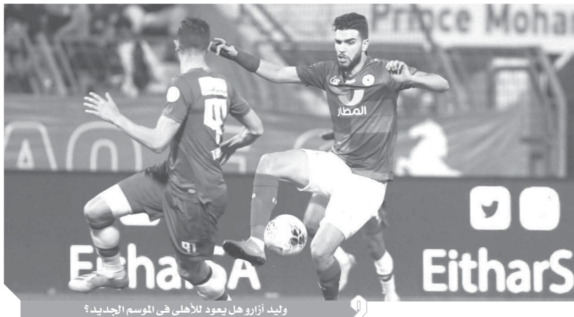
وليد أزارو هل يعود للأهلّي في الموسم الجديد؟