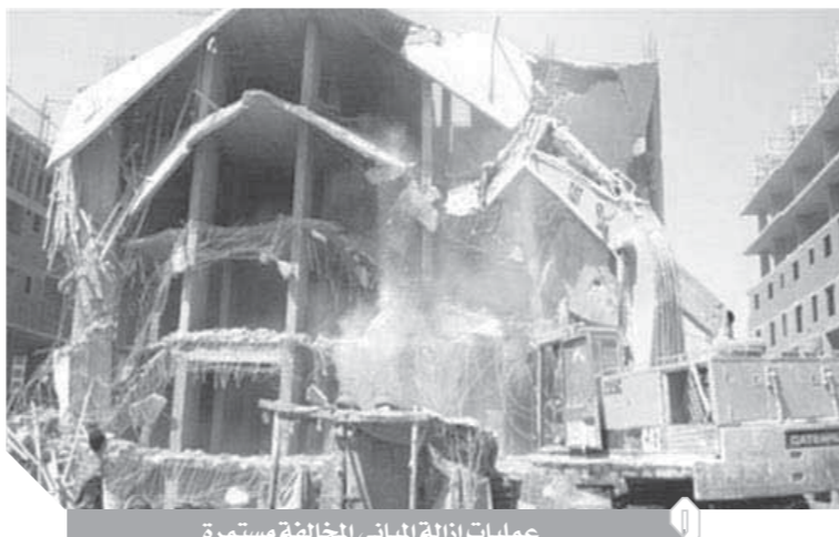
عمليات إزالة المباني المخالفة مستمرة

١٠ ساعات متوسط انقطاع المياه في المناطق الشعبية