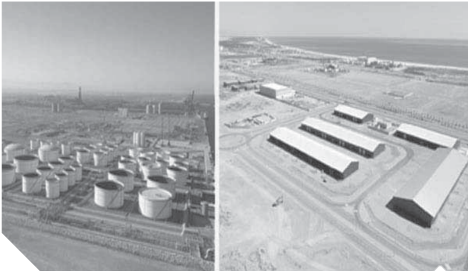
المناطق الحرة بسلطنة عُمان رائد حيوي للاقتصاد الوطني