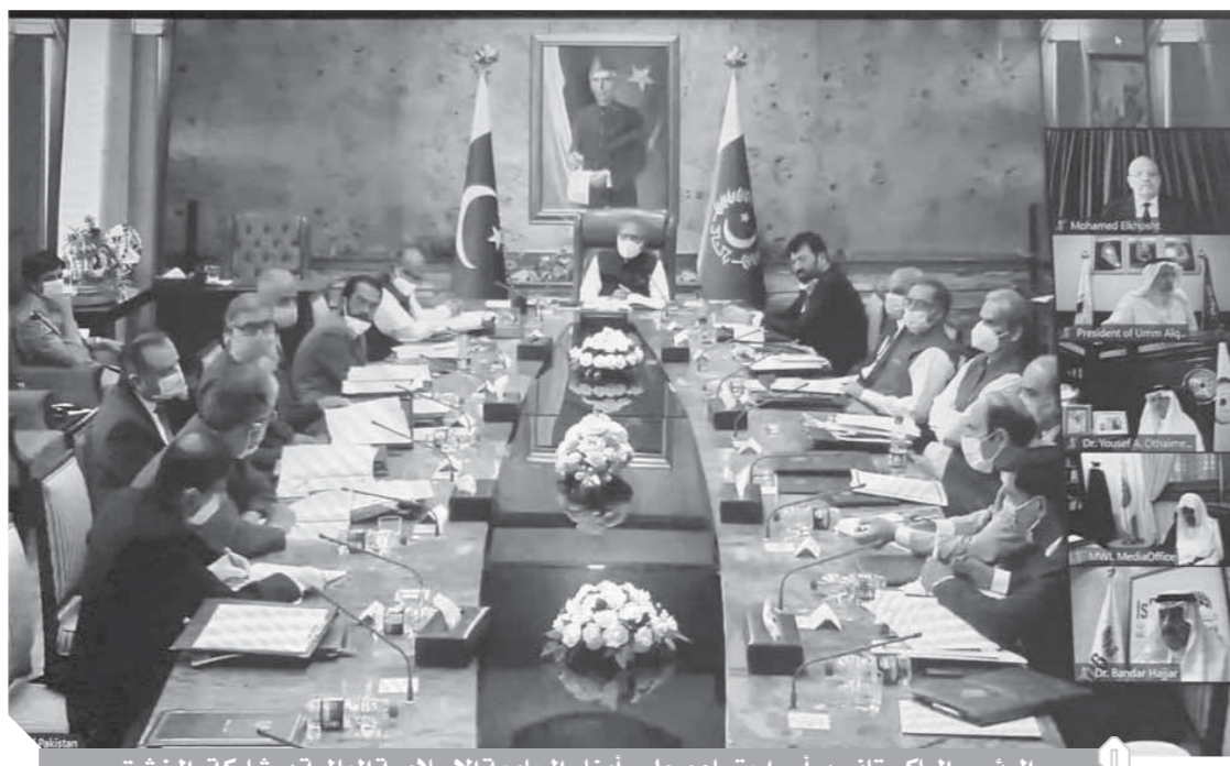
الرئيس الباكستاني يرأس اجتماع مجلس أمناء الجامعة الإسلامية العالمية بمشاركة «الخشث»

أكد الدكتور محمد عثمان الخشت رئيس جامعة القاهرة أنه يتطلع إلى ازدياد دور الجامعة الإسلامية العالمية بباكستان ونشر روح الإسلام السمحة ومواجهة الفكر المتطرف وتخريج خريجين وعلما قادرين على تقديم رؤى إسلامية جديدة لإشكاليات وتحديات العصر، بعيداً عن التعصب والأفكار المغلوطة.