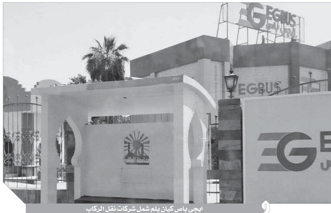
إيجى باص كيان يلم شمل شركات نقل الركاب

انتهاء إجراءات الدمج والبحث عن إدارة تشغيل محترفة من القطاع الخاص