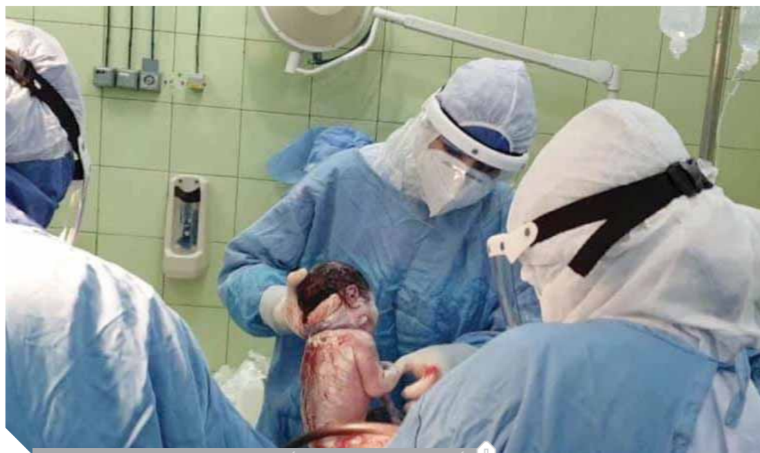
أطباء مستشفى كفر الدوار أثناء إجراء إحدى العمليات القيصرية