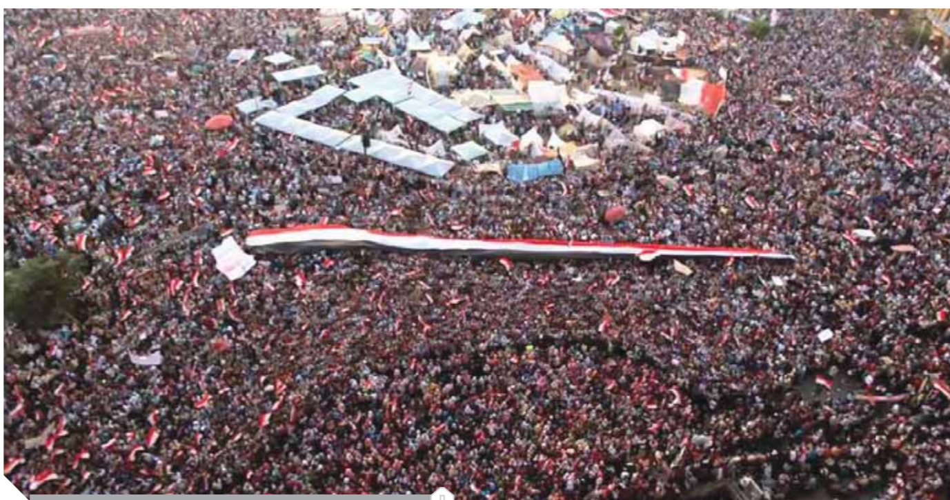
المصريون خرجوا إلى الميادين لاسترداد الوطن يوم ٣ يوليو