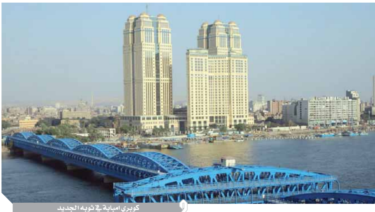
كوبرى إمبابة في ثوبه الجديد