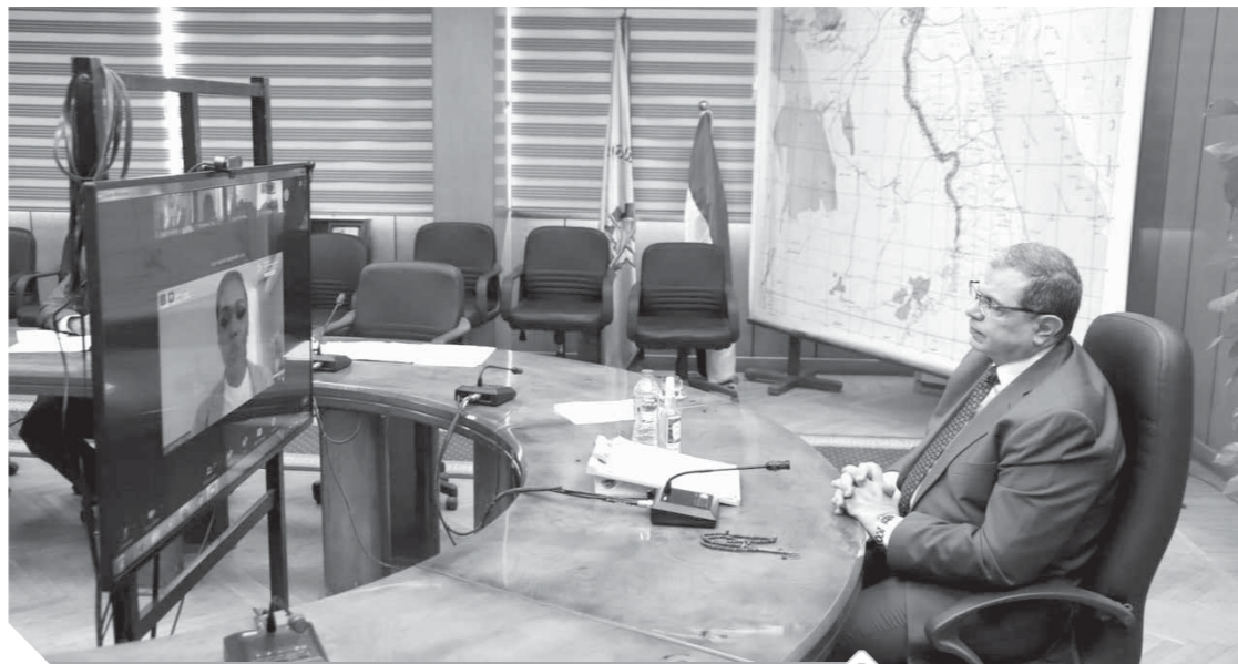
وزير القوى العاملة خلال اجتماع منظمة العمل الدولية بالفيديو كونفرانس

تستأنف منظمة العمل الدولية القمة العالمية الافتراضية رفيعة المستوى بشأن كوفيد-١٩ وعالم العمل وذلك على مدى ثلاثة أيام، ابتداء من يوم الثلاثاء من خلال تقنية «الفيديو كونفرانس»، وتعتبر هذه القمة الأوسع بين العمال وأصحاب العمل والحكومات، والتي ستكون بمثابة مؤتمر العمل الدولي الذي تم إرجاء دورته ١٠٩ التي كان مقرراً عقدها خلال الفترة من ٢٥ مايو إلى ٤ يونيو الماضي في جنيف إلى يونيو ٢٠٢١ وذلك بسبب انتشار فيروس كورونا «كوفيد - ١٩». وتشارك في القمة مصر و١٨٦ دولة.