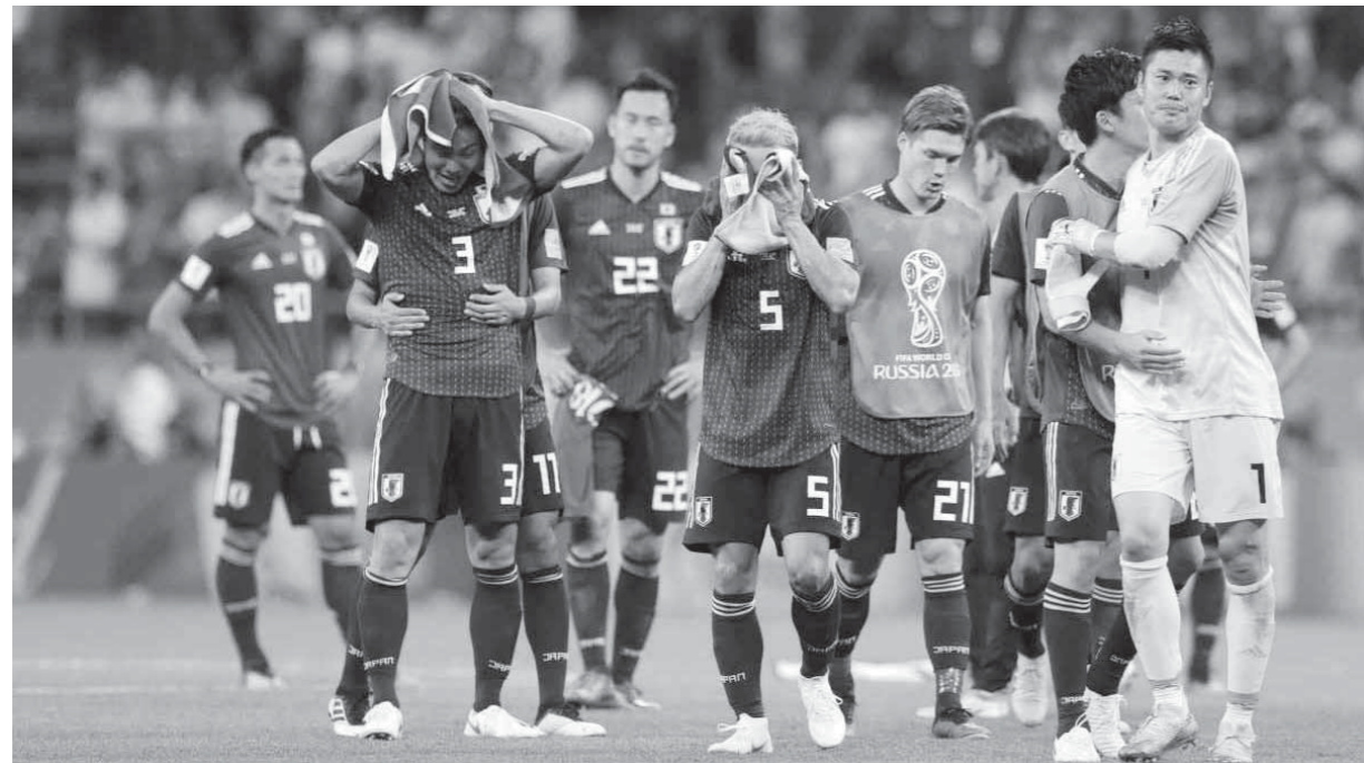
حزن ويكاء لاعبو اليابان بعد الخروج أمام بلجيكا

وحيد خليلوفيتش، أنه هو الذي يتحمل مسؤولية الإخفاق في اللحظات الأخيرة، وليس اللاعبين مضيئاً: «أعتقد أن اللوم يجب أن يقع على وليس اللاعبين وجهت اللوم إلى نفسي وشككت في خلطي». واختتم: «أردت أن تكون للاعبين فريقاً، عقلية مختلفة عن المنتخبات اليابانية في الماضي، أعتقد أننا نجحنا في أن تكون لنا عقلية مختلفة، لكن شيئاً ما كان مفقوداً في مهارتنا».