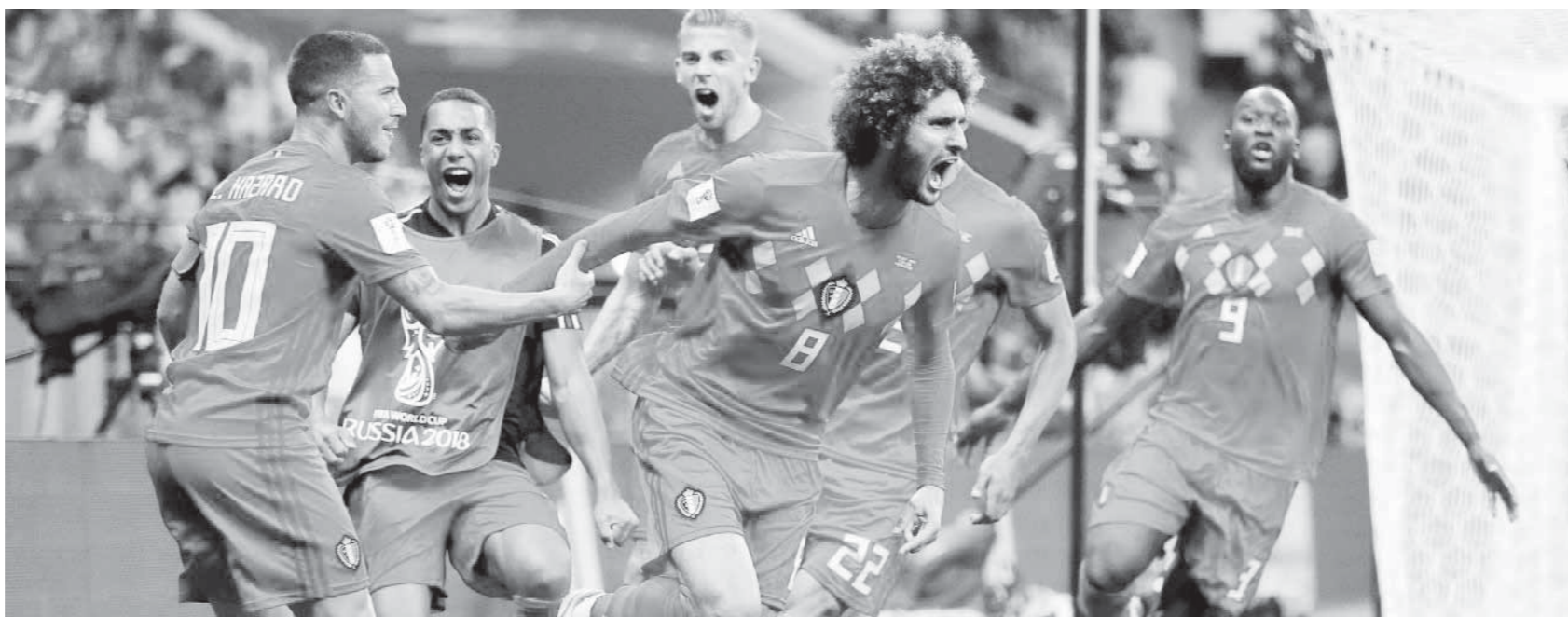
فرحة لاعبي بلجيكا بهدف الفوز على اليابان في الدقيقة الأخيرة

اجتاز اختباراً صعباً أمام اليابان لقوة شخصيته، بأداء عبر فيه عن روح قتالية حقيقية تبشر بالخير قبل مواجهة البرازيل في دور الثمانية. وأضاف المدرب الإسباني: «في كأس العالم ترغب في أن تكون متالياً.. لكن الأمر يتعلق بالتأهل وتحقيق الفوز، السر في الشخصية والتركيز والرغبة وعدم الاستسلام من هذه المجموعة من اللاعبين». وتابع: «كان اختباراً لشخصية الفريق ويمكنكم رؤية رد فعل البلاد عندما شاركوا لنفوز بالمباراة، هذا يشرح كل شيء عن هذه المجموعة من اللاعبين، استمروا في الإيمان بمنتهى بلجيكا». وعن مواجهة البرازيل في ربع النهائي، قال «مارتينيز» إن فريقه سيتعلم من دروس مباراة روستوف التي بدأها بهزيمة تامة في الشوط الأول قبل أن يتجه للهجوم من أجل العودة للمباراة «وليس لدينا ما نخسره». في نفس السياق، قال القائد إيدن هازارد إن فريقه كان يرى لمحات من هزيمته المذلة أمام ويلز قبل عامين في كأس أمم أوروبا حين كانت النتيجة 2-0، موضحاً: «لكن رد الفعل هذه المرة كان مدهلاً، قد تكون هذه نوعية المباريات التي كنا في حاجة إليها، الآن مواجهة البرازيل مثل الحلم».