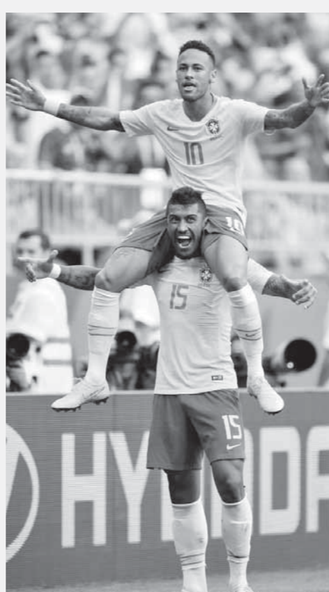
باوليتو يحمل نيمار بعد هدف التأهل لدور الثمانية