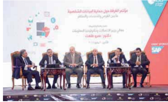
جانب من مؤتمر حماية البيانات الشخصية

الأوروبي يقوم على تعديل تشريعاته بناءً على اللائحة الأوروبية الخاصة بحماية البيانات الشخصية GDPR. ولقد كانت وزارة الاتصالات وتكنولوجيا المعلومات على إدراك ووعي بالتطورات العالمية على صعيد الأطر التنظيمية لصناعة تكنولوجيا المعلومات والاتصالات، ولهذا قامت الوزارة بإعداد مسودة مشروع قانون حماية البيانات الشخصية الذي تم إرساله لمجلس الوزراء، ووزارة العدل لمراجعته وإقراره قبل إرساله إلى مجلس النواب لمناقشته من أجل ضمان مستوى مناسب من الحماية القانونية، والتقنية للبيانات الشخصية المعالجة إلكترونياً، ووضع آليات كفيلة بالتصدي للأخطار الناجمة عن