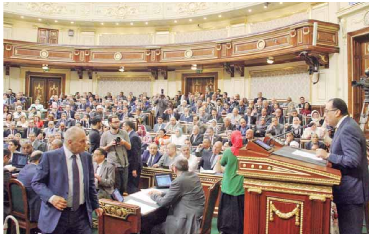
الدكتور مصطفى رئيس مجلس الوزراء يلقي بيان الحكومة أمام مجلس النواب

وأضاف «مدبولي»: أن التكليف الأساسي الذي كلفه به رئيس الجمهورية هو العمل بأقصى جهد وفي أسرع وقت، للدخول في مرحلة مراعاة الفئات الكادحة والصابرة وكل فئات الشعب، من الاستفادة من نتائج برنامج الإصلاح الاقتصادي خلال عامين.