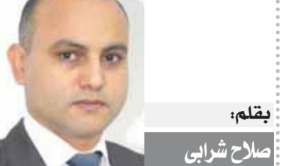
بقلم: صلاح شرابى