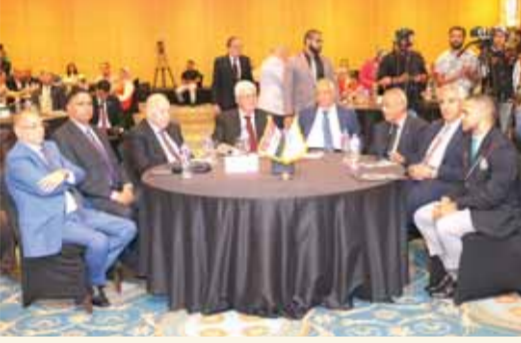
جانب من احتفال الجامعة باستلام شهادة جينيس