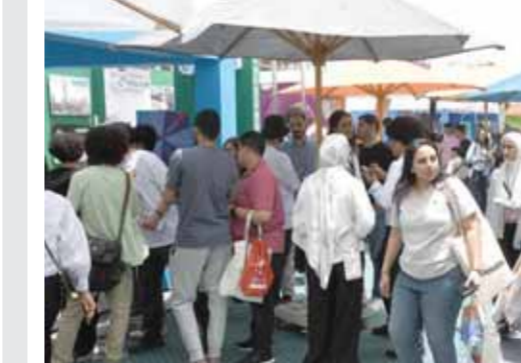
جانب من فعاليات الملتقى