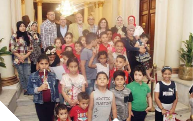
جانب من الأطفال المكرميين