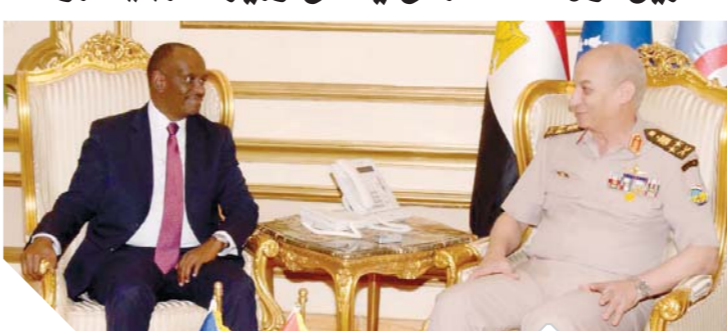
الفريق أول محمد زكي خلال لقائه بوزير خارجية رواندا

من جانبه أشاد وزير خارجية رواندا بدور مصر الفاعل في المنطقة وجهود القيادة السياسية المصرية الرامية لدعم الانتاج في القارة الإفريقية خاصة في ظل رئاسة مصر للاتحاد الإفريقي عام ٢٠١٩. وأعرب القائد العام عن اعتزازه بالعلاقات التاريخية الراسخة والقوازم المشتركة التي تربط بين مصر ورواندا، وتطلعه إلى أن تشهد المرحلة المقبلة مزيداً من التعاون المشترك في مختلف المجالات. حضر اللقاء عدد من قادة القوات المسلحة وسفير رواندا بالقاهرة.