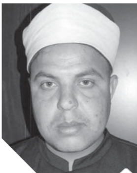
الشيخ شعبان عبدالحكيم

النوازل يصليان قبل الخليفة بغير أذان ولا إقامة ينوي بهما صلاة العيد ويستحب الإكثار من التكبير لقول النبي صلى الله عليه وسلم «زيئوا أعيادكم بالتكبير، ويستحب في يوم العيد الذهاب من طريق العودة من طريق آخر ومن السنة في يوم العيد أن يغتسل وأن يتطيب، وأن يلبس ويرتدي أحسن ما عنده من ثياب ومن السنة التهنئة في يوم العيد لما ورد عن النبي صلى الله عليه وسلم أنه قال يقول لأصحابه تقبل الله منا ومنكم صالح الأعمال. وختاماً قال صلى الله عليه وسلم «لصائم فرحتان يفرحهما فرحة حين يفطر فرح يفطره وفرحة حين يلبس ربه عز وجل، ومن السنة صيام ست من شوال: قال صلى الله عليه وسلم «من صام رمضان لم يدره، فيصام شهر رمضان يعدل عشرة أشهر في الأجر والشواب وصيام ست من شوال يعدل شهرين فهنيئاً للأمة المحمدية بهذا العطاء الرباني من جاء بالحسنة فله عشر أمثالها، كل عام والأمة الإسلامية مباركة على مصر وعلى رئيسها الرئيس عبدالفتاح السيسي وحفظ الله مصر وجيشها وأمنها واستقرارها وجعلها واحة للأمن والأمان والسلام والرخاء والاستقرار وسالكل يا رب العرش والأمان والرخاء والضيامننا لحضرتنا وجيشنا وحفظ الله علينا ديننا ووطننا.