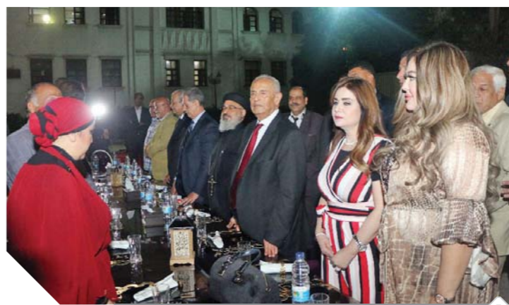
أبوشقة وقيادات الوفد في سحور لجنة الوفد بالجيزة