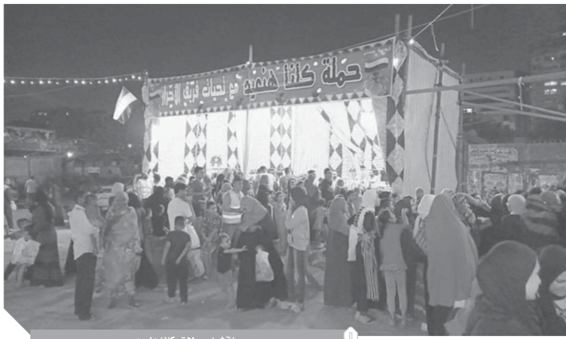
حملة شباب بولاق، كلنا هنعيد

مشيراً إلى أن المحتاج عندما يشعر بأن الفنى سد له حاجته الضرورية من الطعام والكساء والدواء والتعليم، وقدم له ما يغنيه عن السؤال يزداد شعور الثقة والمحبة والمودة بينهما، درأ للحقد الطبقي والجريمة، وحماية للمجتمع. وطالب أستاذ علم الاجتماع السياسي بضرورة الإكثار في العطاء بحيث يستمر طوال العام. فالصفقات التطوعية ليس التي تحدثنا عنها كثيراً لمعرفةنا بمسألة بعض وقت عندما يشعر الفرد بحاجة الآخرين، مع أهمية تعزيز وتشجيع المبادرات الفردية المجتمعية، لإحداث الألفة والتعاطف والتماسك الاجتماعي، وحفظ كرامة الفقراء وأصحاب الحاجات، وتقديم المساعدات المالية أو العينية لمن يحتاجونها، والإنفاق على الأطفال في التعليم.