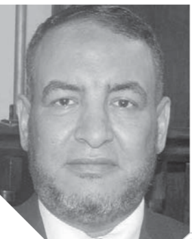
الشيخ محمد ربيع

للعيد في الإسلام قيمة متميزة لذلك الأمة الإسلامية تميزت في أسلوب الاحتفال به وبمقاصده، لكونها أمة متميزة في كل شيء، فالعيد في الإسلام يأتي بعد موسم عبادة والإسلام باعتباره ديناً ربانياً شمولياً يدرك أن النفس البشرية بعد موسم الطاعة تحتاج للشيء من الترويح، ومن صور الترويح تحريم صيام يوم العيد حرصاً على الإبقاء على البهجة والسرور والتخفيف المشروح عن النفس. ومما لا شك فيه أن للعيد قيمة اجتماعية فالعيد يقوى العلاقات الاجتماعية حيث يجدد النشاط والهمة لدى أفراد المجتمع المسلم وأيضاً الزيارات الأسرية في العيد تحقق صورة من صور التواصل الاجتماعي الإيجابي بين أفراد المجتمع وما يتبع ذلك من إنشاء روح التهادن بالعيد بين الجميع. أيضاً تبرز القيمة الاجتماعية للعيد بلم شمل الأمة وتماسكها وقوتها من خلال التكافل الاجتماعي سواء بزيارة الفقراء أو الذبح في عيد الأضحية، مما يفضي على المجتمع صورة من صور الأمن الاجتماعي وما يتبع ذلك من لم شم الأمة وتقوية عزيمتها وتجديد روحها وإفشاء روح الأخوة الإسلامية وانتشار الخير بتغيير صورته وأشكاله.