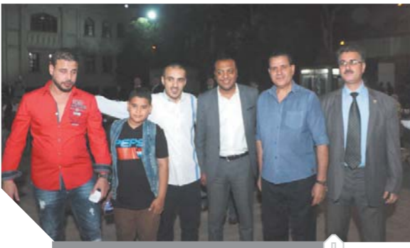
شامخ والكردى ويحضى الشباب في الحفل

إما إعلانات أفلام العيد السعيد فهي حرب داعش أو حروب رجال المافيا والعصابات في أمريكا اللاتينية وصور الانفجارات والمطاردات والقتال والأسلحة والذخيرة مثيرة للفتيان والاشمئزاز لأننا نشعر كما لو أننا في ساحة حرب وقتال عبثى ساذج ماجور.. أما الإعلانات، فلا حول ولا قوة إلا بالله ويكفى المجلس الأعلى للإعلام انشغالهم المستمر ببيع الماضى بدلا من البناء المستقبل ولقاء برنامج لا يعنى أنه قد أدى دوره المهيب العظيم فما يحدث من تجاوزات إعلامية وفتنة تذر شؤم على مستقبل وطن وشعب وجيل كامل سوف نجنح نمار زرعنا ونندم على حرقنا بعد فوات الأوان.. والكرة لعبة وصناعة ومهارة وتدريب ودراسة.. ولكنها ليست فناً.