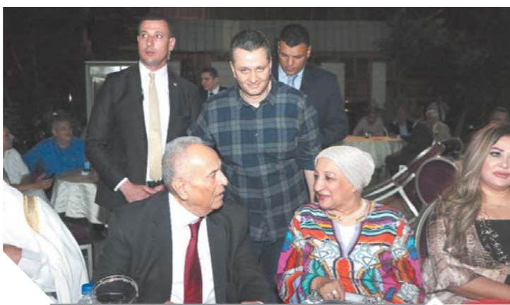
أبوشقة والسيدة قرينته في حفل السحور