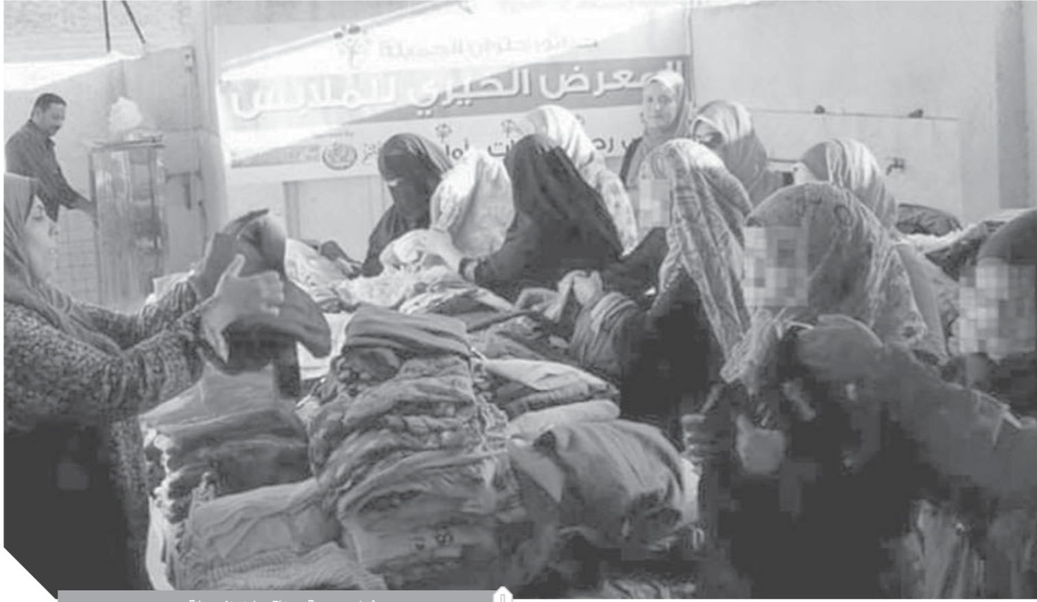
شباب جمعية حدائق حلوان الجميلة