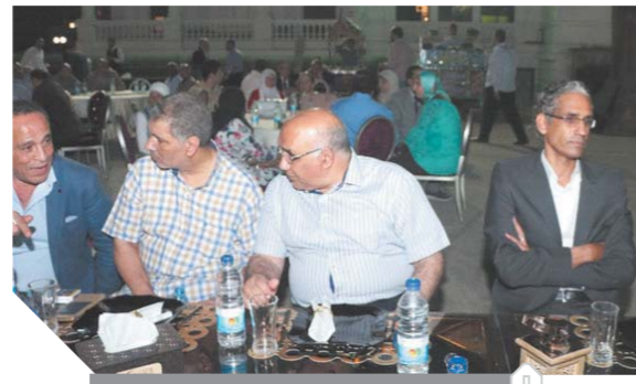
تهاى وسباق ونيسب عبد الله خلال الحفل