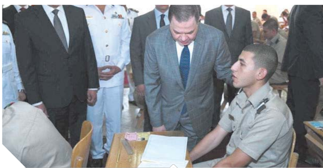
وزير الداخلية خلال تفقده امتحانات الشرطة

وأكد الوزير خلال تفقده للجان أهمية الإعداد والتأهيل الجيد لطلبة كلية الشرطة وتسلحهم بالعلم والمعرفة ليكونوا قادرين على حمل أمانة الدفاع عن أمن الوطن، في إطار من الالتزام بأحكام القانون وإعلاء قيم حقوق الإنسان بما يضمن دعم رسالة الأمن وتحقيق الاستقرار.. وأعرب عن ثقته بمسئولي التدريب والتأهيل الذي يحصل عليه طلبة كلية الشرطة، واكتسابهم المهارات المطلوبة التي تمكنهم من التعامل مع مختلف المواقف الأمنية بكفاءة عالية.