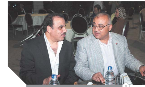
عبد العزيز النحاش وخالد مشعل