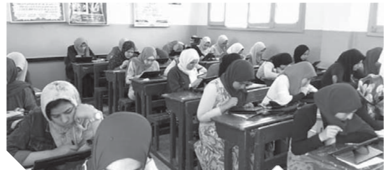
هل يحل التابلت مشكلة التعليم؟

الصعوبة في نماذجها المختلفة، وأسئلته لم ترد بالكتاب المدرسي «طب يقولنا نذكر منين عشان نعرف نحل» واشتكى أولياء الأمور، من تداول بعض الطلاب «أكواد» الامتحان قبل بدئه ليتمكنوا من الغش الإلكتروني، كما اشتكوا من تداول أجزاء من الامتحانات عبر صفحات «فيسبوك»، مؤكداً أن النظام الإلكتروني للامتحان لم يقض على الغش، بل ابتكر الطلاب اليات جديدة له. كما طالب أولياء الأمور وزارة التربية والتعليم، بإيجاد حلول للمشاكل التقنية، المتعلقة بعدم جاهزية «التابلت» لبعض الامتحانات مثل: الرياضيات، والفيزياء، والكيمياء، لعدم تضمنه بعض الرموز المطلوبة بهذه المواد، بالإضافة إلى صعوبة استخدام القلم الإلكتروني في الإجابة، وتعمل موقع الامتحان أكثر من مرة خلال فترة الإجابة. وأبدى أولياء الأمور استيائهم من الصور التي يجري تداولها عبر مواقع التواصل الاجتماعي بشأن داخل اللجان، حيث تسمح بعض المدارس بجلوس الطلاب الذين يحصلون على أكواد متطابقة متجاوزين الغش الجماعي ليتمكنوا من الغش، وتساؤلوا عن موقف اللجان من الغش المتعمد معهم قبل انتهاء الوقت المخصص للإجابة.