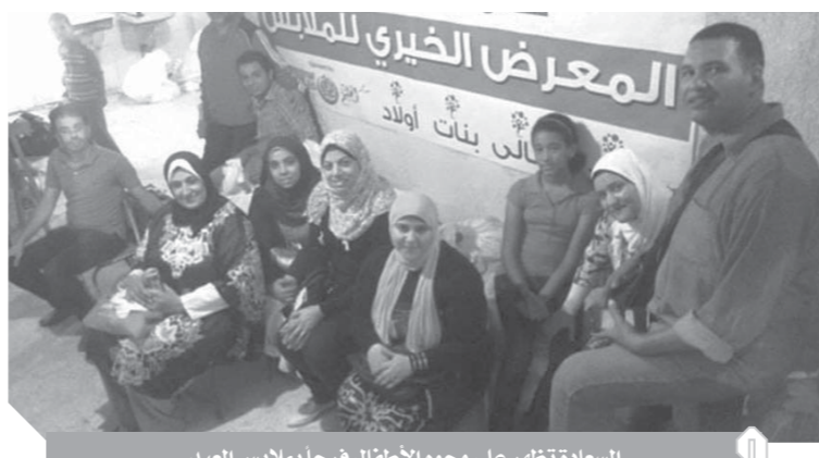
السعادة تظهر على وجوه الأطفال فرحاً بملابس العيد

وأوضحت «نيرمين» أن أسعار الملابس هذا العيد مرتفعة ولا تستطيع الأم المعيلة أن تتكفل وحدها بأبناء منزلها وأطفالها المادية دون مساعدة، وقالت إنها أطلقت على المبادرة اسم «تهادوا تعابوا»؛ لأن الرابط الحقيقي بين الأمهات المعيلات على هذه