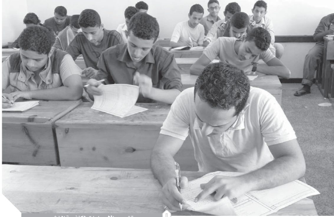
تشديد الإجراءات لمكافحة الغش