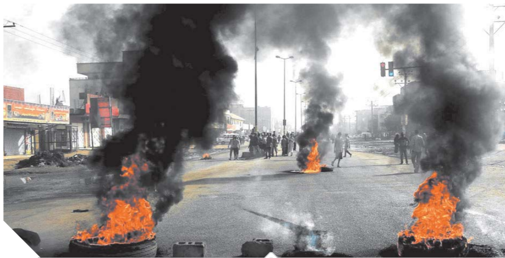
جانب من الاشتباكات في محيط اعتصام القيادة

لا تستهدف منطقة الاعتصام، والذين خرجوا إن أردوا العودة فلهم ذلك، استهدفنا فقط منطقة كولومبيا.. وتوقفت رحلات الطيران الداخلية والخارجية بمطار الخرطوم الدولي، بالتزامن مع دعوات للتظاهرات في العاصمة الخرطوم، احتجاجاً على فض اعتصام المحتجين أمام مقر قيادة الجيش وسط الخرطوم.