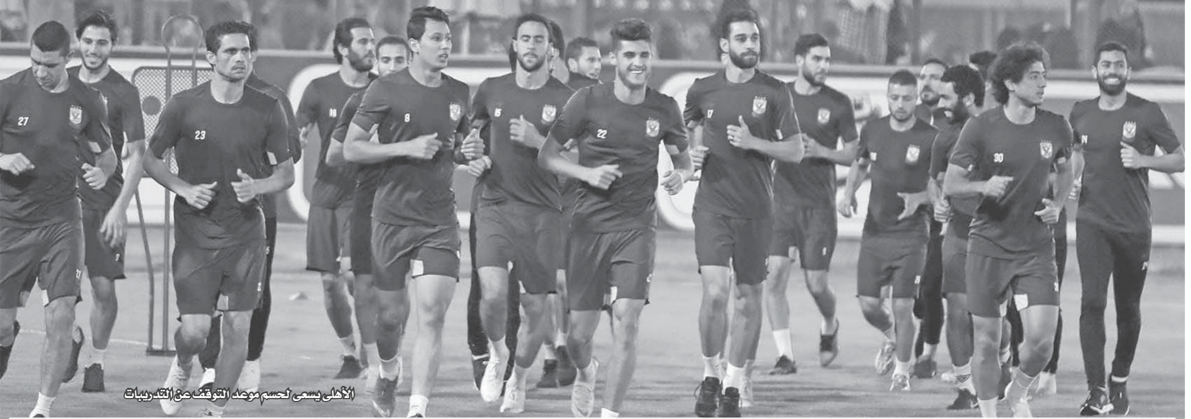
الاهلى يسمي بحسم موصاه التوقف عن التدريبات