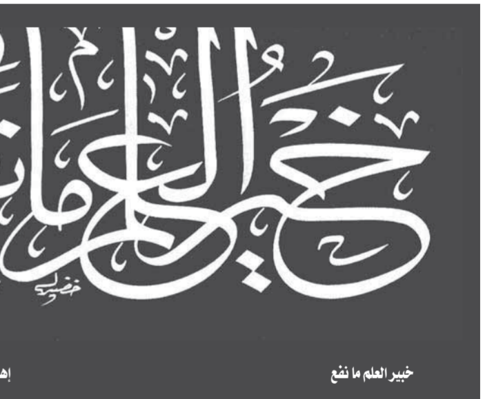
إهداء الشان خضير البورسعيدى

وفي سن العشرين أمر الرسول أسامة بن زيد بقيادة الجيش الذي يضم بين أفرادها وجنوده أبو بكر وعمر.. وساد بعض التذمر بين صفوف المسلمين، ولما عرف الرسول قال: إن بعض الناس يطعنون في إمارة أسامة وطعنوا في إمارة أبيه من قبل وإن كان أبوه خليقا للإمامة وأسامة خليفة لها. وتويع الرسول صلى الله عليه وسلم قبل تحرك الجيش. وهدس الخليفة الأول بوبكر الصديق وصية الرسول.. ويوم وفاة الرسول تلقى إمبراطور الروم هرقل الخبر وبدأ جيش أسامة يغير على تخوم الشام، فحير الأمر هرقل كيف لا يؤثر موت رسولهم في خططهم ومقدرتهم.. وانكسح الروم وغادر الروم حدود الشام وعاد جيش أسامة منتصرا بدون ضحايا.. ولقي أسامة ربه في العام الرابع والخمسين من الهجرة مليبا دعوة الله إلى دخول أوسع الجنان، تستقبل واحدا من الأبرار المتقين.