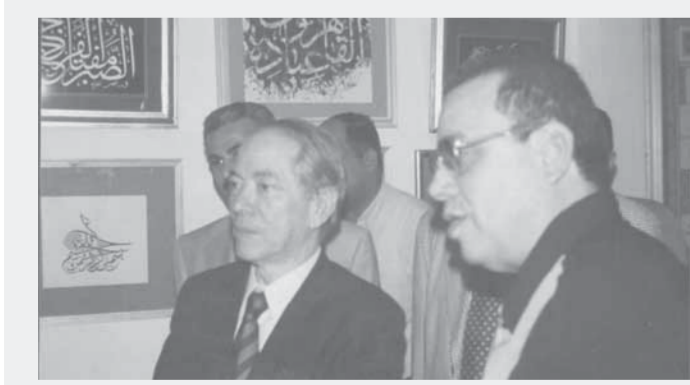
مع أسامة الباز