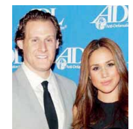
جدل بعد زواج طليق ميجان ماركل

كيتيت. هبة مرعى: يبدو أن المنتج التلفزيونى «تريفور إنجليسون»، قرر أن يسير على خطى طليقتة، دوقة ساكس وزوجة الأمير هارى ميجان ماركل، وتقدم لخطبة صديقتة. ونشر «تريفور»، 42 عاماً، خبر خطبته عبر صفحته الخاصة على إنستجرام، كتب فيها «أنا أكثر رجل محظوظ فى العالم.. استعدوا للاحتفال، وأرفقها بصورة له مع خطيبته، خبيرة التغذية الشهيرة تريسي كورلاندى، وفي يدها خاتم ماسى لامع، وذلك بعد مرور أسبوعين فقط من حفل الزفاف الأسطوري لتطليقتة ميجان ماركل والأمير هارى. جدير بالذكر أن ميجان ماركل وتريفور إنجليسون، قد تزوجا بهراسم زواج تقليدية في حفل زفاف في جامايكا عام 2011، ثم حصل الاطلاق على الإطلاق عام 2013.