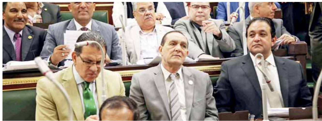
مجلس النواب خلال مناقشته تقرير الخطة عن الموازنة العامة للدولة

25 توصية ومقترحاً من «خطة البرلمان» لزيادة موارد الدولة وعدم المساس بمحدودي الدخل