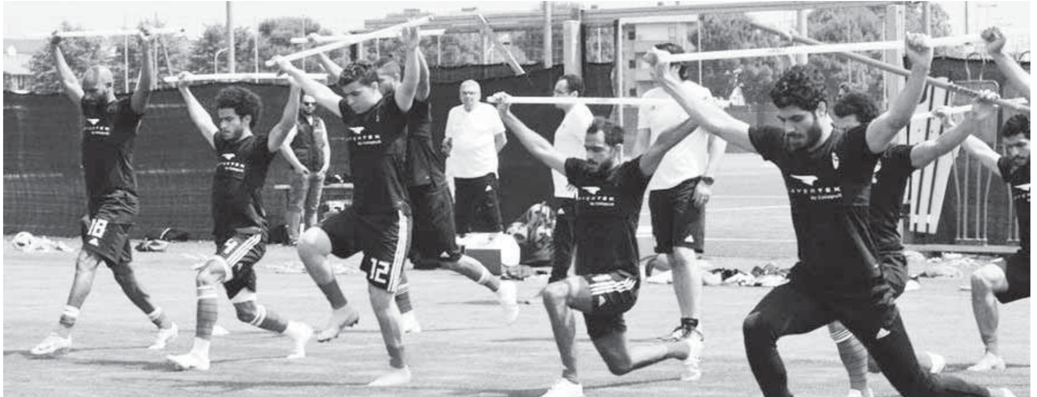
المنتخب يختم تدريباته اليوم في معسكر إيطاليا