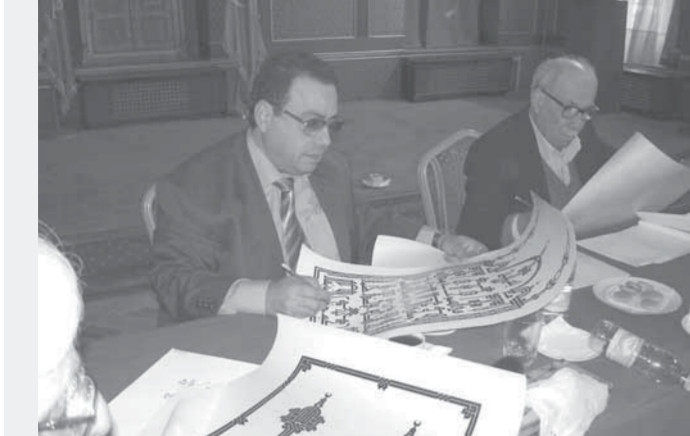
في إحدى المسابقات الدولية

الله حكيم، وتشريع الحكيم كله حكمة، قال تعالى: (أفحسبتم أنما خلقناكم عبداً وأنكم ربنا لا تزجرون (115)) «المؤمنون».