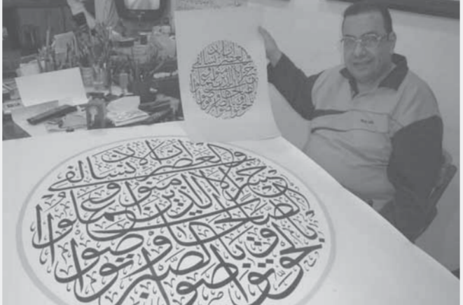
في متحف بالجمالية