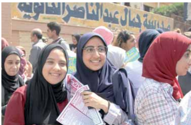
التفاؤل يبدو على وجوه طالبات الثانوية عقب أدائهن امتحان اللغة العربية والدين