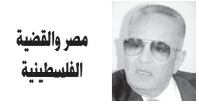
بهاء الدين أبوشقة

نعم مصر عمود الخيمة أبي من أبي وشاء من شاء.. لا يمكن بأي حال من الأحوال أن تستقيم أوضاع الدول العربية ومنطقة الشرق الأوسط بدون القاهرة.. هذا هو قدر مصر، وهذه هي مسؤوليتها تجاه الأشقاء العرب، ولا يمكن لها أن تتخلى عن دورها في مساندة الجميع.. مصر عمود الخيمة، وغالباً ما يكون هذا العمود وتبدأ شديداً لا تهزه الريح ولا تؤثر فيه عوامل الأحوال الجوية.. وكذلك الحال الموقف المصري هو العمود المتين الذي ترتكز عليه كل دول المنطقة العربية بلا استثناء.