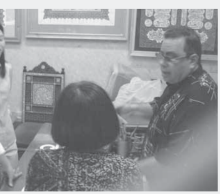
خلال استقبال بعض الزوار لمتحفه