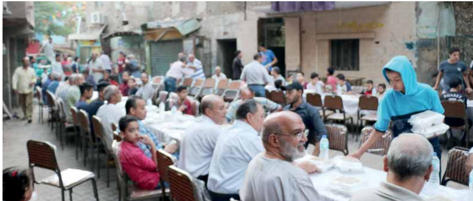
مائدة المحبة عادة يحرس عليها أهالي الجيزة

أضاف: شارع جمال عبد الناصر يختلف عن أي مكان آخر، مشيراً إلى أن فكرة فطار «المحبة» بدأت داخل شارع التحرير وشارع جمال عبد الناصر منذ أكثر من 15 عاماً وكان الشباب الصغار منذ 15 سنة يتجمعون ويأتون بالطعام من منازلهم ويفطرون في الشارع. وتابع قائلا: «كانوا يستأقوا أي حد معدى ويقولوا لازم تقطر معنا وبدأ الموضوع يتطور وبدأوا يجيبوا كراسي وترابيزة ويتجمعوا وتوسعوا في الفكرة واستمروا لمدة 10 سنين يتجمعوا واحنا كبار تبنينا الفكرة وحبينا طورها وبدأنا ندعم الشباب وبدأنا نجيب الناس اللي اتربوا معنا في الشارع علشان يفطروا معنا في مائدة المحبة للقاء الأجيال». وأردف قائلا: «من أول شهر رمضان نكون على أهبة الاستعداد للفطار واللى عندو