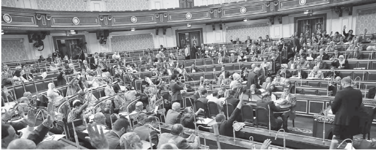
جانب من جلسة مجلس النواب أمس