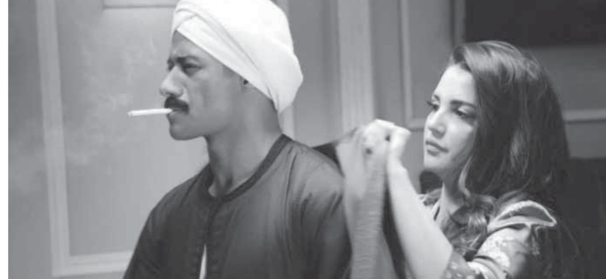
محمد رمضان في مشهد من «نسر الصعيد»